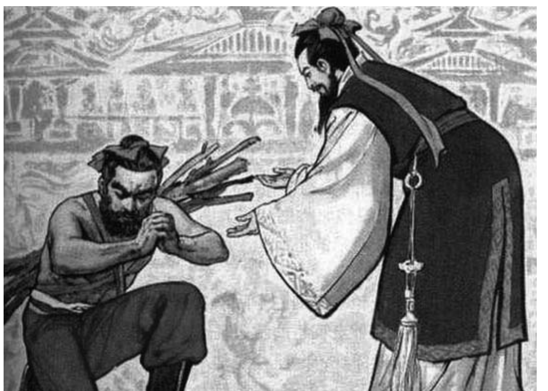
图：蔺相如的宽容大度感动了廉颇。廉颇便负荆向蔺相如赔罪，两个人从此成为莫逆之交，秦国因此不敢窥视赵国。

包容是善的力量，它能拉近人与人之间的距离，改善彼此间的关系。古语说“厚德载物”，因德是无私的、最可信赖的，是万物皆可亲近的媒介，这种德越醇厚，就越有承载性和包容性。因此道德高尚的人能够在任何环境中不为利欲所动，同情、爱护和帮助他人，心里总是装着别人的安危，唤醒、偕同他人一道行善、实践道义。