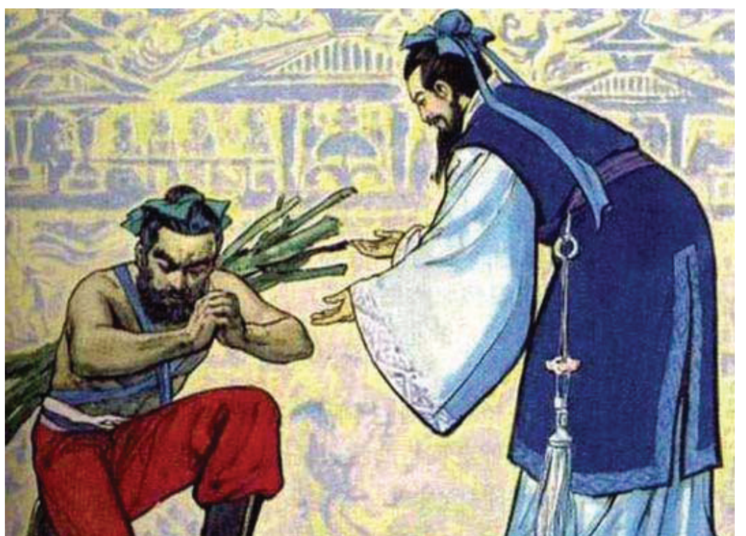
图：蔺相如的宽容大度感动了廉颇。廉颇便负荆向蔺相如赔罪，两个人从此成为莫逆之交，秦国因此不敢窥视赵国。

包容是善的力量，它能拉近人与人之间的距离，改善彼此间的关系。古语说“厚德载物”，因德是无私的、最可信赖的，是万物皆可亲近的媒介，这种德越醇厚，就越有承载性和包容性。因此道德高尚的人能够在任何环境中不为利欲所动，同情、爱护和帮助他人，心里总是装着别人的安危，唤醒、偕同他人一道行善、实践道义。