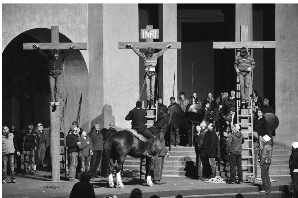
图：排练《耶稣受难剧》场景

按照传统的说法，从他们发誓的那一刻起，鼠疫就再也没有夺走当地人一条性命。第二年，欧伯阿梅高人开始履行他们的诺言，首度上演了《耶稣受难剧》。从此，他