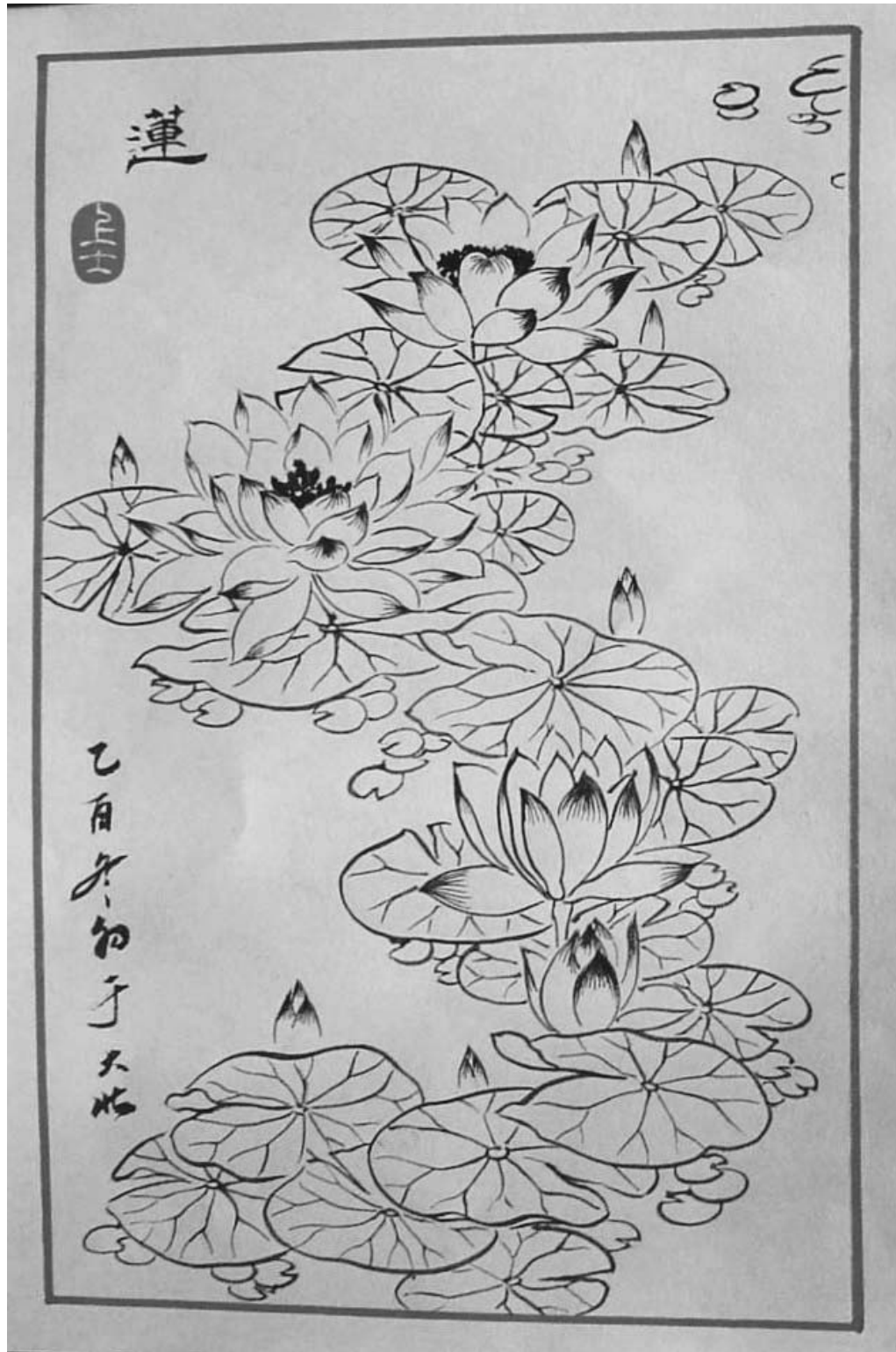
图：大法弟子绘画作品：《莲》

如“一品清廉”，古时官分九品，一品最高，莲谐音廉，含为官清廉寓意，“一品清廉”就是指虽然官高位显，但更要廉洁奉公，不贪污、不受贿，这是千百年来人们对从政者道德操守的基本要求。如民间流传的《一品清廉图》就是一茎青色莲花的图案。莲又称荷，而“荷”“和”谐音，吉祥和合，“以和为贵”是我国的传统理念，