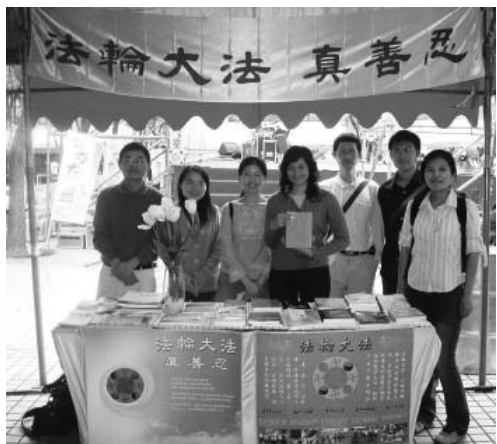
图：二零零七年台湾交大校庆期间交大法轮大法社摊位

自从中共迫害法轮功学员以来，毒手伸进了各个角落，从此，上海交大炼功点上百名师生修炼的情景已不再，取而代之的是各种令人痛心的迫害。迫害开