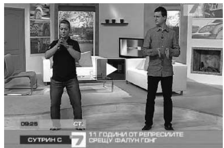
图: 保加利亚西人法轮功学员(左)为主持人和观众演示功法

在七月二十日直播节目的最后, 两位法轮功学员还将象征希望的手叠莲花作为礼物送给两位主持人, 他们呼吁制止迫害法轮功。