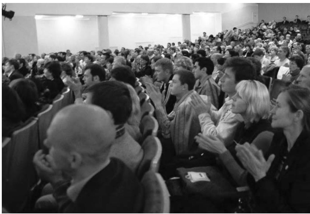
图：二零零零年在圣彼得堡第一次俄罗斯暨前苏联地区法会期间的集体炼功