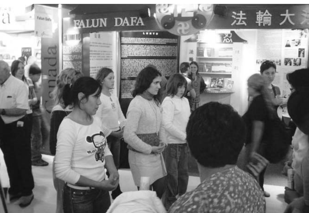
图: 参观书展的民众在法轮功展位前学炼功法

法轮功(也称法轮大法)于一九九二年五月从中国大陆传出, 已历十八年。法轮功揭示宇宙特性“真、善、忍”, 强调重德修善。学炼者普遍强身健体、心性道德提