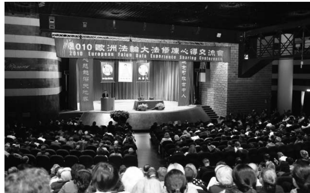
二零一零年欧洲法会在罗马召开

现在我已是四十六岁的女人了。当身边曾经非常健康的伙伴们一个个出现不同程度的健康危机