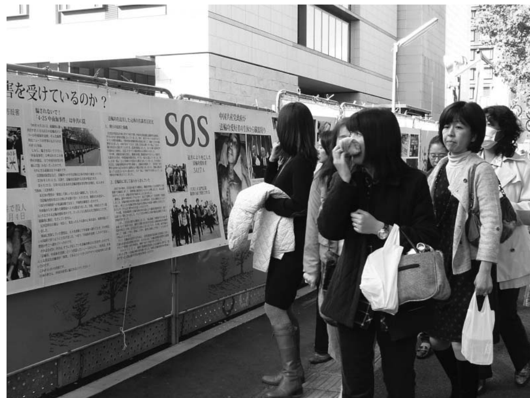
图：法轮功真相展板吸引了民众关注

韩国最大媒体韩联社十一月十五日凌晨以头条报导法轮功学员上诉终获胜诉的新闻。目前，韩国各大主流媒体，KBS电视台国立电视台，文化放送电视台MBC电视台，YTN的专业新闻广播社，朝鲜日报，首尔新闻，京乡日报以及门户网站Daum公司等，几乎所有的韩国主流媒体，都对法院此一判决进行重点报导。