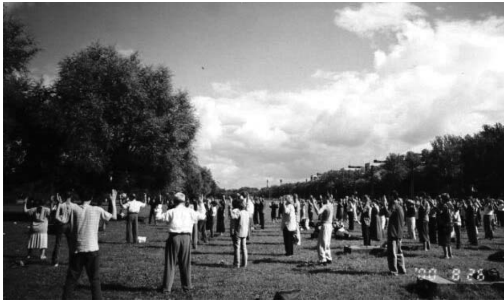
图：二零零零年在圣彼得堡第一次俄罗斯暨前苏联地区法会期间的集体炼功

中共迫害法轮功长达十一年之际，二零一零年七月二十日圣彼得堡的法轮功学员在市中心举办了讲真相活动，揭露中共践踏人权的恶行，呼吁世人帮助制止这场迫害。川流不息的人群中不断有人停下来，详细询问法轮功真相，谴责中共的迫害；还有很多早已知道真相的人们想要学功，向学员们了解哪里能买到法轮功的书籍。