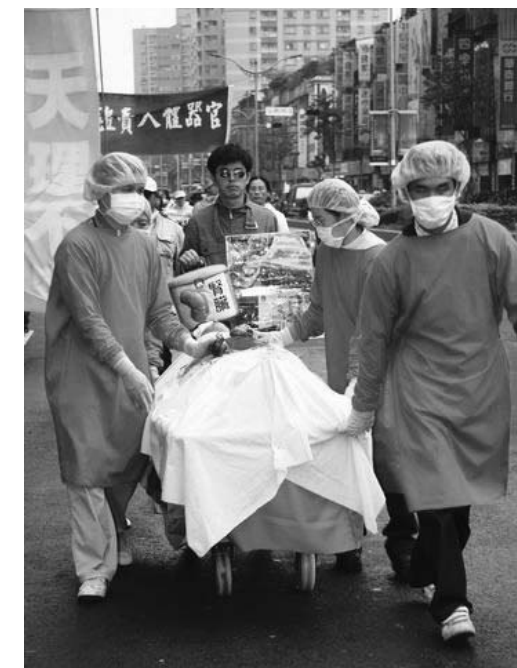
演示图：台湾法轮功学员大游行揭露中共活摘器官暴行

法轮功学员在向全世界讲清真相中，将中共的邪恶迫害告诉了全世界，善良的人们纷纷认清中共的魔性和邪恶，反对这场迫害，选择了抛弃魔，走向神，选择了光明的