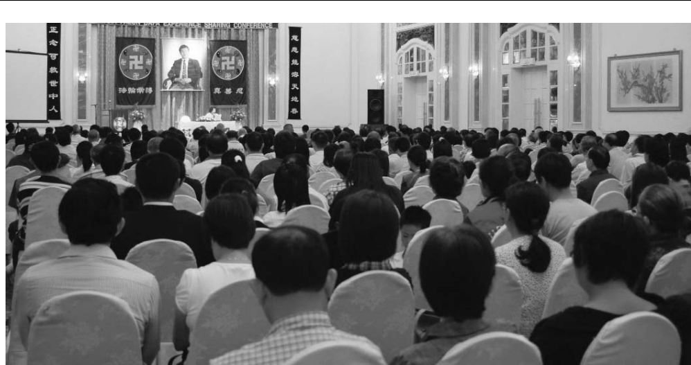
图：二零一零年马来西亚法轮大法修炼心得交流会现场

当医生知道我的情况后,感到很吃惊,这在中外医学史上是个奇迹!我对师父的感激之心是无法用语言来表达,我的泪水经常会夺眶而出,是伟大慈悲师父救了我!是大法给了我的人生!