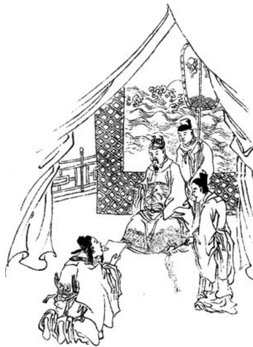
图：唐张公艺，九世同居。睦族之道，忍字百余。

这个县委副书记，与唐朝的敬昭道，颇有共同之处。他们都是冒着风险去帮助别人，又都得到了善报。正是：善恶确实有报应，天理昭昭最分明；请君细看行恶者，几个能够得安宁？陈良宇，本事大，到头还是摔趴下！