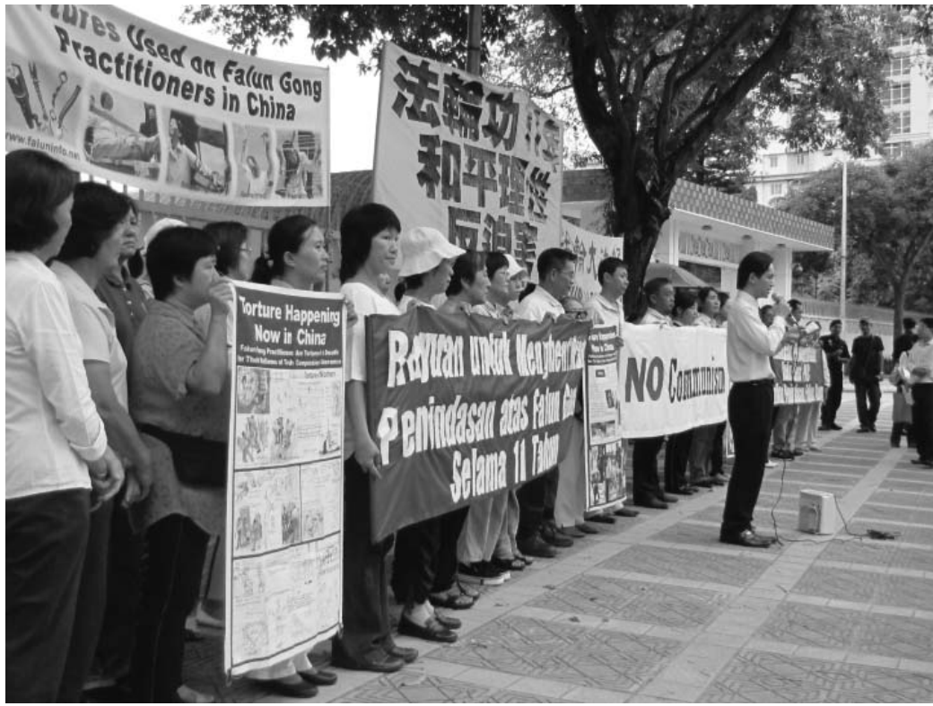
图：世界人权日，马来西亚法轮功学员在中共驻马使馆前，抗议中共迫害法轮功