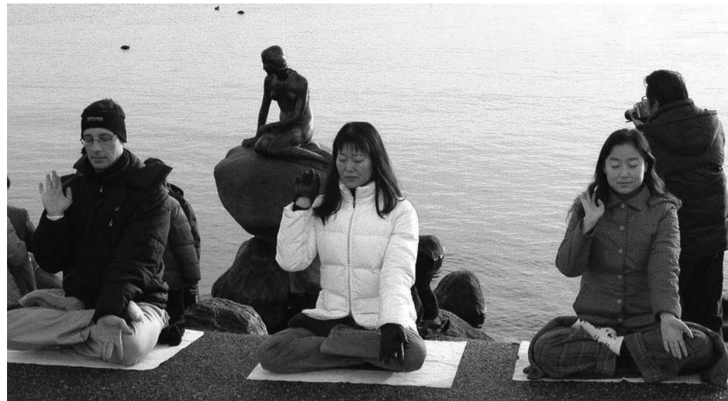
图：丹麦法轮功学员在美人鱼雕像前炼功

二零零二年九月二十二日在哥本哈根召开了二零零二年欧洲法轮大法修炼心得交流会。欧洲各国的法轮大法弟子云集哥本哈根,英