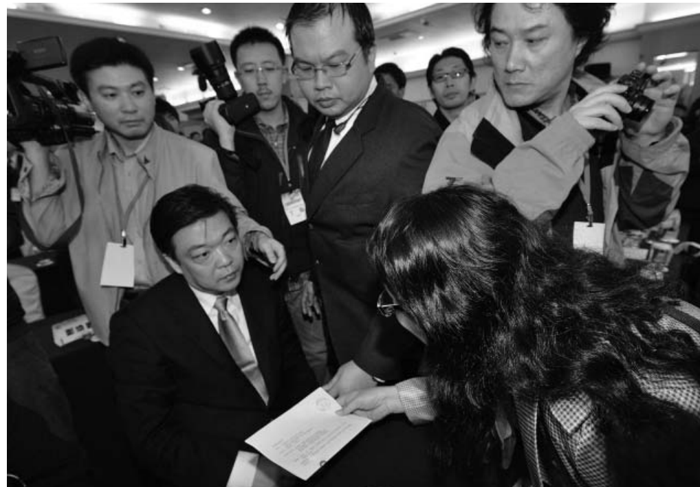
图：中共北京副市长吉林在数百人的会场上，对递到眼前的诉状，一脸愕然

二零零二年，吉林调任北京市政法委书记，二零零四年任北京副市长，之后，吉林又担任奥运协调小组副组长，在二零零八年，以奥运维稳为借口，发动一波大规模逮捕行动，北京音乐人于宙被酷刑迫害致死，于宙的画家妻子许那遭绑架，至今仍被关押。