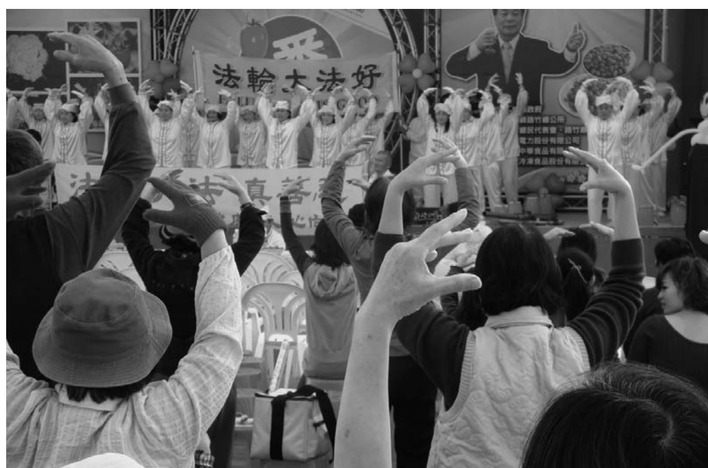
图：“路竹番茄文化节”现场观众一起学炼法轮功功法

番茄是路竹乡最热门的农作物之一，这里也是嘉南平原以南最大的番茄产地，与花椰菜、鸡蛋和虱目鱼并列为路竹四宝。路竹乡王和雄表示，借由番茄文化节活动将这些日常生活中最平凡普遍、但是具有丰富营养的食品分享给全国民众。