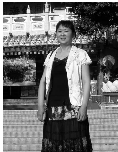
图：全国人大代表、全国劳模朱颖