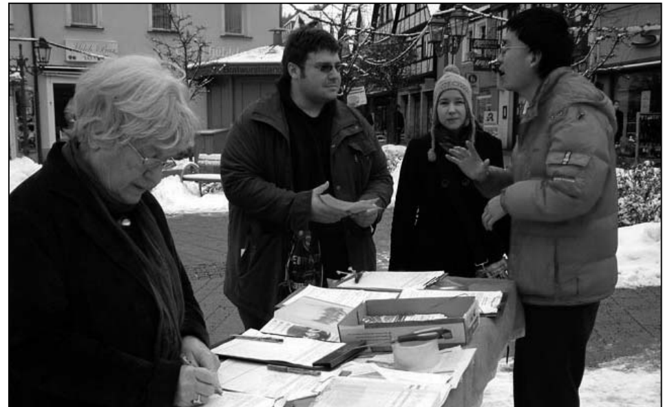
图：十二月九日和十日在德国库尔巴赫，法轮功学员在市政府附近的广场举行向库尔巴赫市市民讲真相的活动。

德国也是一个灾难深重的国家，上个世纪经受过世界大战的重创和共产党在东德的独裁统治。独裁者对人权的践踏也是这个国家挥之不去的痛楚记忆。法轮功修炼者在这里举办的讲述中共对大法弟子人权迫害的消息自