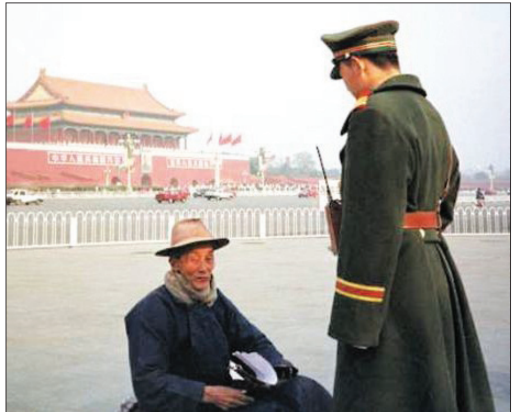
图：美联社图片：步行到天安门广场情愿的法轮功修炼者。

在今天的中国，当中共把崇尚“真、善、忍”的法轮大法诽谤、诬陷时，当真理被中伤，谎言与谣言充斥着整个中华大地，善良的民众被欺骗时，法轮功修炼者在高压诱惑下没有选择变节，在被造谣中伤时没有选择沉默，在被凌辱折磨