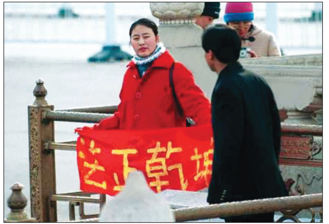
图：美联社图片：一名女法轮功学员在天安门广场和平请愿

通过历次的政治运动，中共打断了中华民族的脊梁骨，但是中共的血腥迫害动摇不了法轮功。这