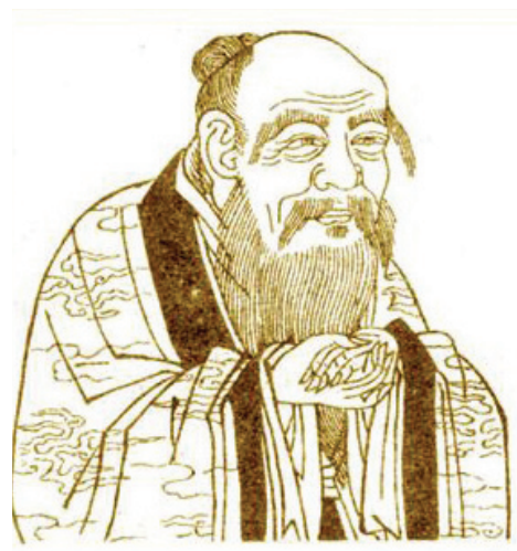
图：成语“道法自然”出自于老子的《道德经》

成语对道家文化的体现。“道法自然”、“清静无为”等成语都是道家思想的反映。有许多成语出自《老子》：如“天道无亲，常与善人”，意思是说天道不分亲疏，对所有的人都是一视同仁的，但行善是符合天道的，所以天道总是与善良的人同在，使其做事有如神助；“法网恢恢，疏而不漏”（原作“天网恢恢，疏而不漏”），意思是说天道无亲，常与善人。