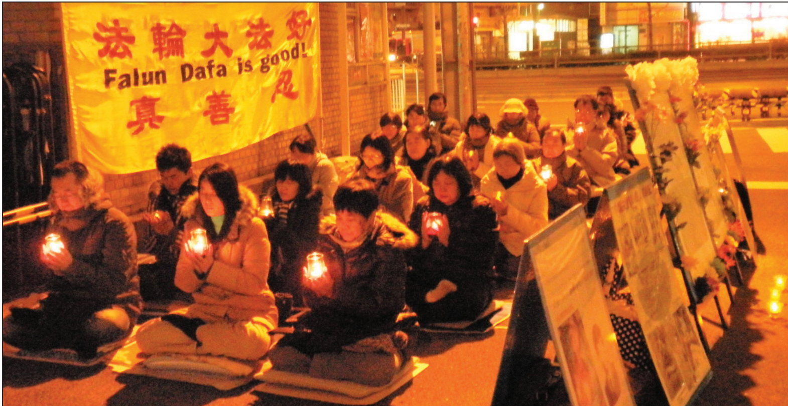
图：日本大阪点亮烛光悼念被中共迫害致死的中国大陆法轮功学员

尽管当天很寒冷而且还下着雪，但法轮功修炼者在严寒中默默地坚持着。在这十一年的迫害期间，虽然中共动用了几乎所有的宣传机构对法轮功进行栽赃、抹黑，但是法轮功学员们坚持不懈地讲真相，已经有越来越多善良的民众明白了法轮功被迫害的真相，并且明白了中共的造假伎俩，以后也不会再被中共的造假媒体所欺骗。