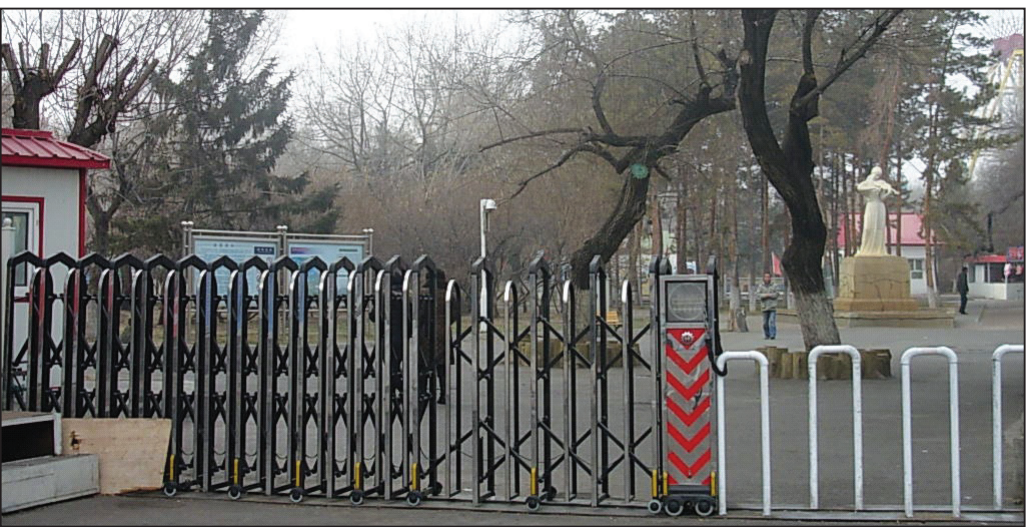
图：龙沙公园二号门

齐齐哈尔的人都知道，在龙沙公园二号门门前经常能看到一位拔牙卖药的南方人，他药摊上的那一堆牙象小山一样高。李老师在《转法轮》第七讲中对此有所论述：“我在齐齐哈尔办班时，看到街上摆摊的有一个人给人拔牙。一看这人就是南方来的，不象东北人的装束。来者不