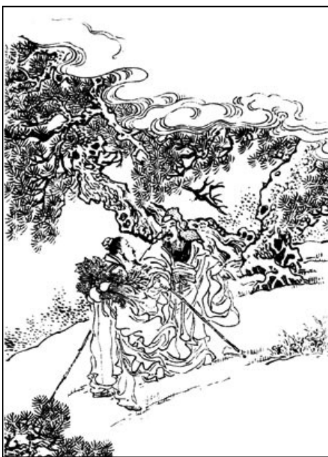
图：泰伯、季历让国，是为了遂父亲意愿。

给儿子姬昌，就是中国礼乐文化的奠基人周文王。泰伯带着二弟飘然远去，目的是为了遂父亲意愿，让三弟顺利继位，而父王也不会给世人留下偏爱让位之嫌，这曲全于父子兄弟的一片衷肠，浑然不落痕迹，真是可称为“至德”的了。