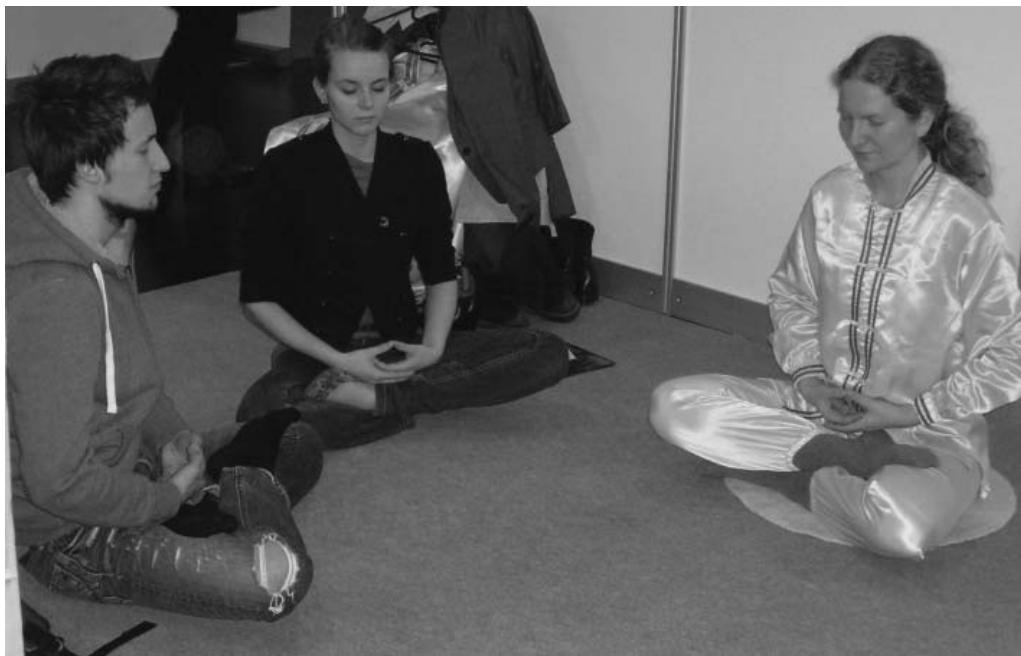
图：现场学炼法轮功

被祥和的能量场所震撼，她说：“真不敢相信，这么好的场！”在博览会期间，约一万六千人到访参观，他们大多都是来自斯泰