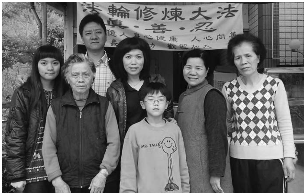
图：若兰山庄家族的大姐二姐及么弟一家人跟妈妈的合影

为了向大陆的同胞讲法轮功的好，老阿嬷装了一部电脑。媳妇说：“刚开始妈妈拿不稳滑鼠，她说拿滑鼠比锄头还重，就用另一只手按着拿滑鼠的手臂说，不要跑、不要跑。妈妈用心