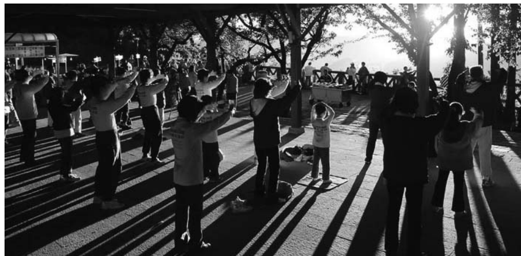
图：在阿里山祝山之颠的法轮功学员迎着第一道晨曦演练功法

学，一个礼拜就熟练了。”现在，老阿嬷坐在电脑前，握着滑鼠说：“法轮功这么好，为什么还被打压，我要把法轮功的好处告诉大家。”