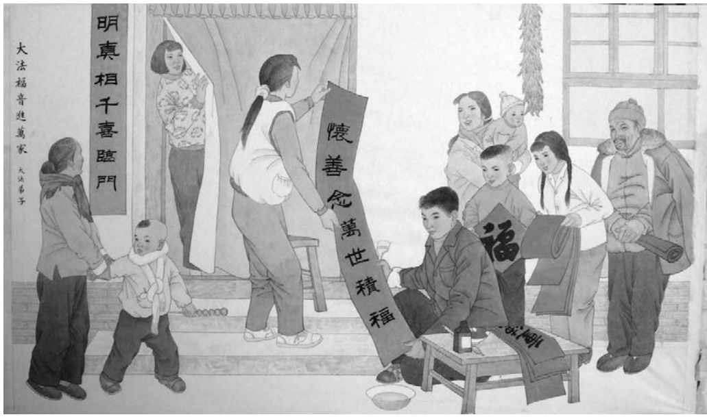
图：绘画：明真相千喜临门

对联是由两个工整的对偶语句构成的独立篇章，其基本特征概括起来是：字数相等，平仄相对；词性相近，句法相似；语义相关，语势相当。比如：上句是“风吹天边月”，下句就对“雨洗山上松”；上句是“物华天宝”，下句对“人