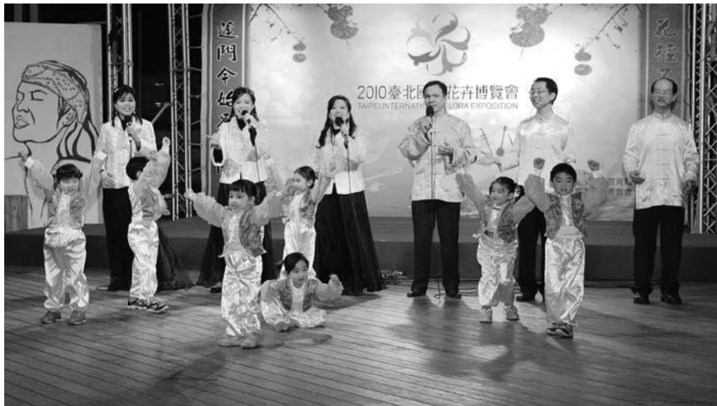
图：逍遥心小合唱团与豆豆园的小朋友们。

子，作曲者同时也是演唱者。受访时告诉现场观众创作的想法与歌曲的内涵。她说法轮功告诉我们在日常生活中修炼“真、善、忍”，做个好人中的好人，才能使人心向善，道德回升！但是由于修炼人数日益增多，导致中共非常畏惧与妒嫉，于是展开了一连串的打压迫害，到目前为止，中国的法轮功修炼者被迫害致死的人数还在增加当中。“梅”，也象征法轮功学员就象梅花一样，歌词表达他们在严酷的环境