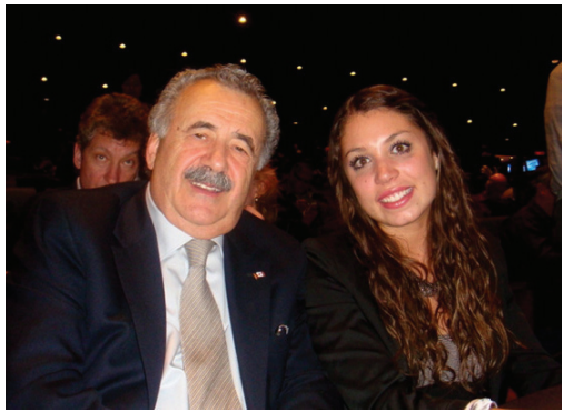
图: 加拿大联邦参议员迪·尼诺今年是第四次观看神韵演出, 这次他还带来了他的作为舞蹈演员的孙女

多伦多市议员加里·克劳福德(Gary Crawford)是一位画家及艺术倡导者。他说: “那些舞蹈、舞蹈编排、色彩、动作, 给我一种神奇的、美好的感觉。”“演出富有精神内涵, 有一种超