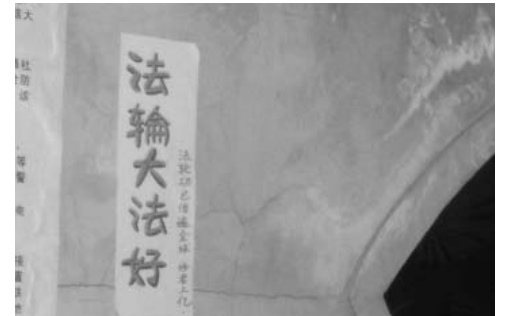
图: 街头墙壁上的“法轮大法好”