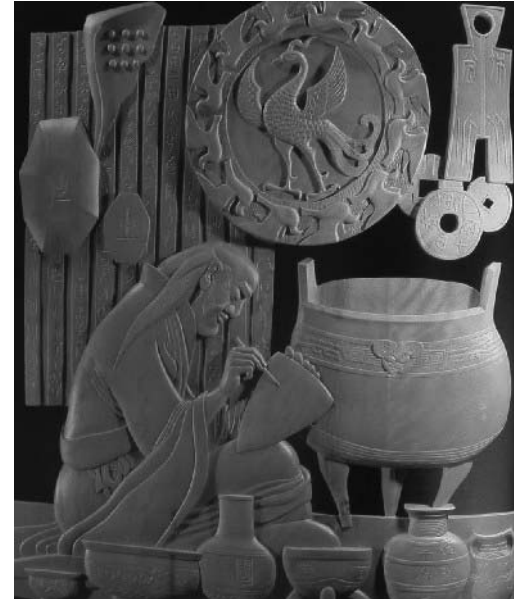
图：武训故乡的武训像

凡“清”之境界，或得天然之趣，或有高洁之风。清静之心，来自不染世间名利，不着人间纷纭，看透富贵如云烟，修养崇高。老子云：“清静为天下正”、《淮南子》道：“清静者，德之至也”。古人讲清静无为，乃有所为有所不为，有为在克己修身，改过迁善，