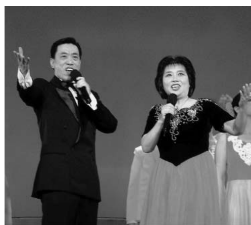
图：歌唱家关贵敏夫妇