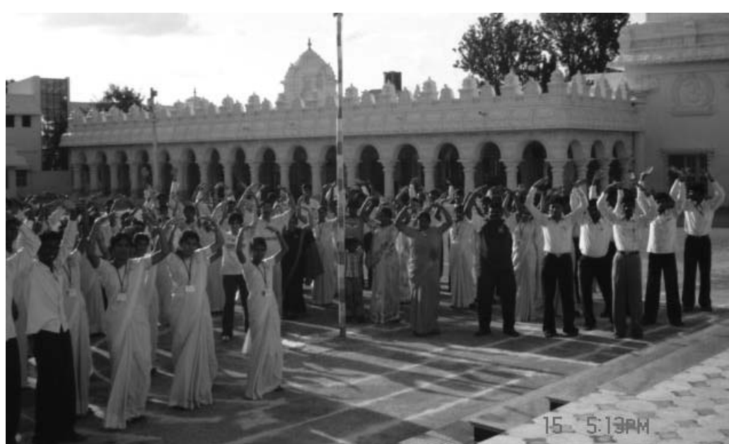
图：印度班加罗尔一所学校举办法轮功讲座，民众学炼功法

早在二零零一年六月二十九日，《印度国家新闻报》就以《身心的促进》介绍法轮功；该年底，《印度德干前锋报》刊登文章，介绍法轮功在印度广受欢迎的情况。二零零三年二月，印度公开发行人印度文《法轮功》。更令人为之震撼的是法轮功在印度学校的发展。