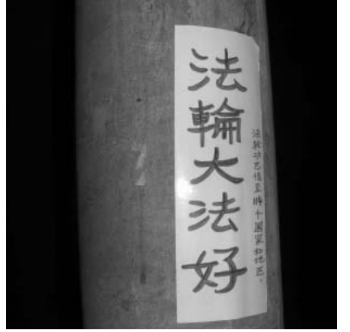
图: 电线杆上的“法轮大法好”

(明慧网通讯员湖北报导) 二零一一年二月二日, 也就是大年三十除夕之夜, 湖北省某市多处出现彩色法轮功真相标语, 为寒冷的除夕之夜增添了不少喜庆。 在这除旧迎新之际, 法轮功学员们不畏严寒、不顾个人的安危, 把“法轮大法好”的真相传播给世人。美丽的彩色真相标语, 包括真相对联、福字贴以及手工写的“法轮大法好”民谣等, 出现在街头巷尾、楼道和宣传栏, 驱散了冬夜的寒冷, 给人们带来希望。 冬夜里, 真相标语散发着光彩, 象征在新的一年里, 法轮大法的真相福音会为越来越多的有缘人开启理智之门, 让更多世人明真相、得福报。