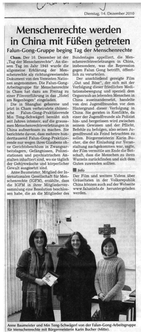
图：《卡姆日报》报导世界人权日放映电影《善与恶》

而《卡姆时报》则报导了法轮功学员免费教功的消息，同时介绍了明慧丛书《绝处逢生》的德文版，让读者了解法轮功祛病健身的奇效。