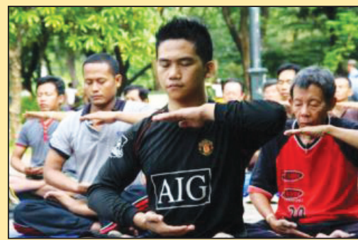
雅加达环球报：法轮功学员讲述中共的迫害 (第七版)