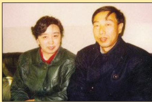
打着法律幌子的大规模迫害 (第六版)