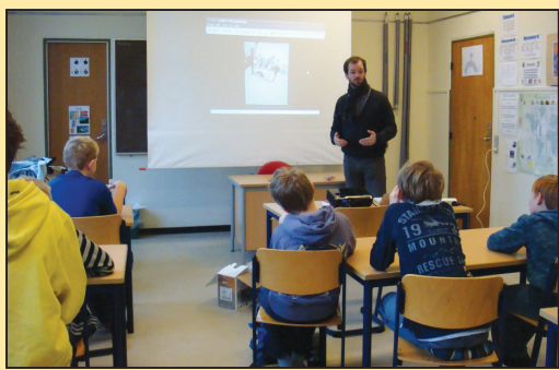
法轮功走入丹麦课堂 (第二版)