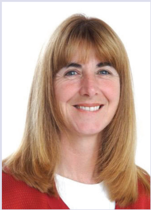
图：奥克兰市议员凯西博士

还以为是以为自己一直支持法轮功，所以陷害法轮功的邮件只发给了她，但就在当天，在听到其他几个议员的询问后，她才意识到中共这次又干起了与上次干扰神韵演出同样的行径。