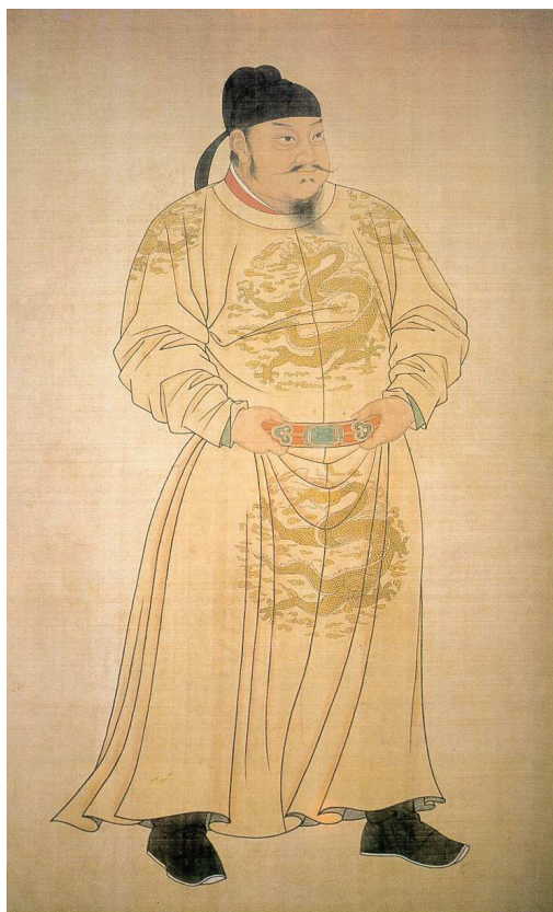
图：唐太宗之所以能够成为一代明君，正是因为他懂得克制自己的欲望，听从他人的好言劝阻。图为唐太宗画像。

克制自己的喜好之心，就会沉迷其中不能自拔。古代的明君之所以能政令清明，百姓安居乐业，也是因为他们知道克己复礼，约束自身的缘故啊。