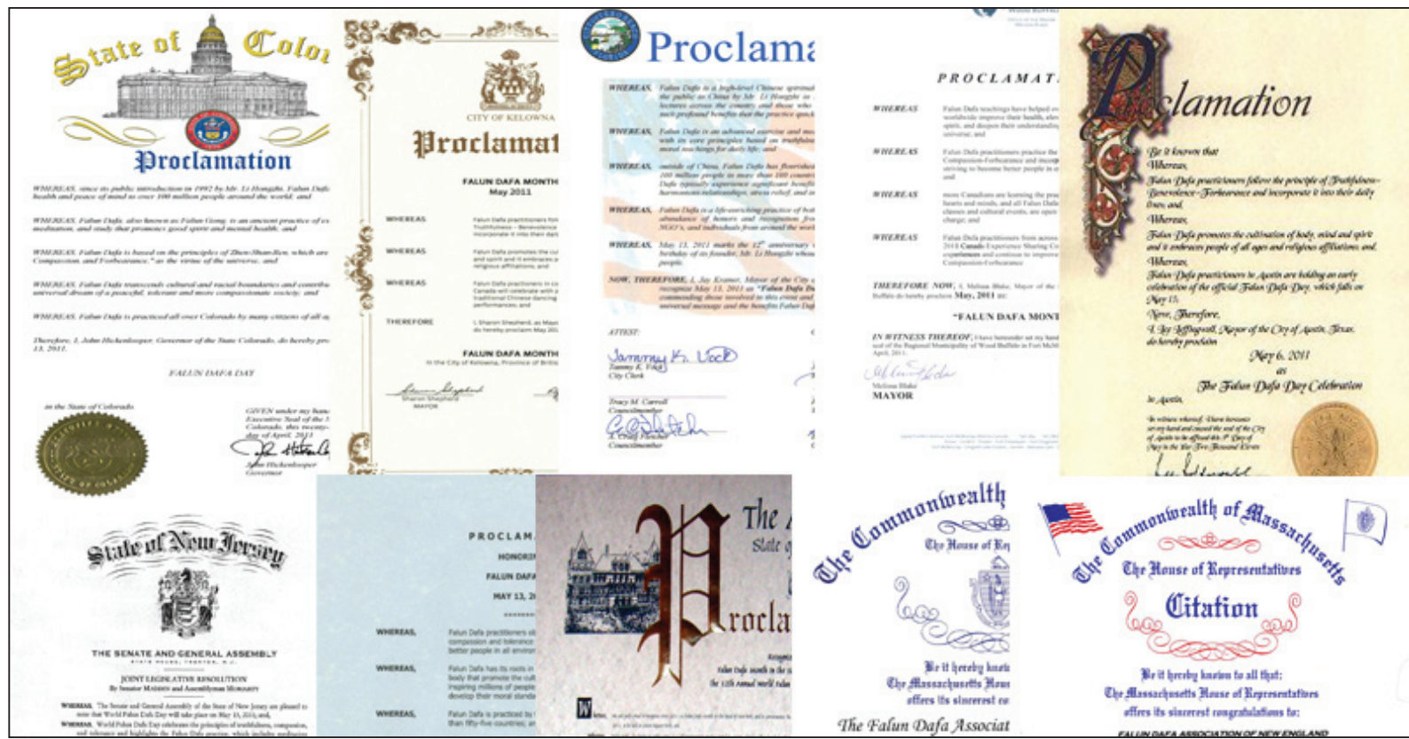
图：美国、加拿大部分政要颁发褒奖，宣布法轮大法日，赞颂“真、善、忍”