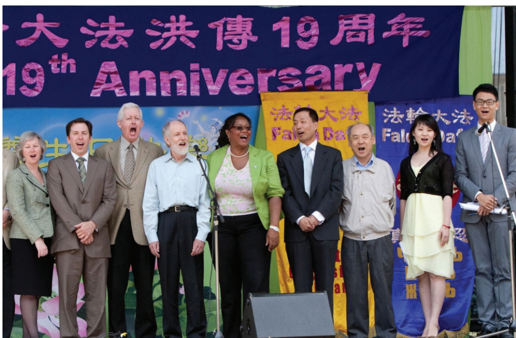
图：二零一一年五月十三日，加拿大多伦多政要嘉宾在庆祝法轮大法日的活动中欢呼“法轮大法好！”

海外法轮功学员用集会、游行、歌舞，向世人展示法轮大法的美好；中国大陆的法轮功学员则用散发传单、讲真相、劝“三退”（退党、退团、退队）、张贴祝贺“世界法轮大法日”等的贺卡向被蒙蔽的中国人传递真相。这么多年他们也都是一如既往的做着，不知不觉中走过了中共疯狂迫害的十二年，回头一看，众多的世人已经明白了真相，“三退”的人数已接近一亿人了。