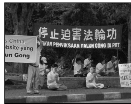
图：泗水市法轮功学员在中领馆前抗议中共输出迫害

他表示，中领馆妄图透过该网站挑拨印尼华裔群体的仇恨，这一举动大大损害印尼多元、多种族社会，也给印尼民主自由社会带来莫