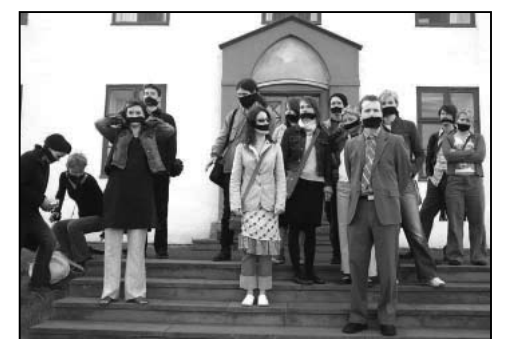
图：2002年6月12日冰岛人在总理办公室外抗议

冰岛政府的错误行径受到国内民意的强烈谴责。民众多次抗议示威，并用黑布蒙上嘴巴，抗议政府不听民众呼声。六月十三日，由冰岛国会议员、社会知名人士等四百五十人联名在首都雷克雅未克最大一家报纸——《莫干布拉迪日报》（Morgunbladid）上刊出巨幅广告，广告名称用“对不起”三个大中文字标出，英文标题的内容是“向法轮功学员道歉”。