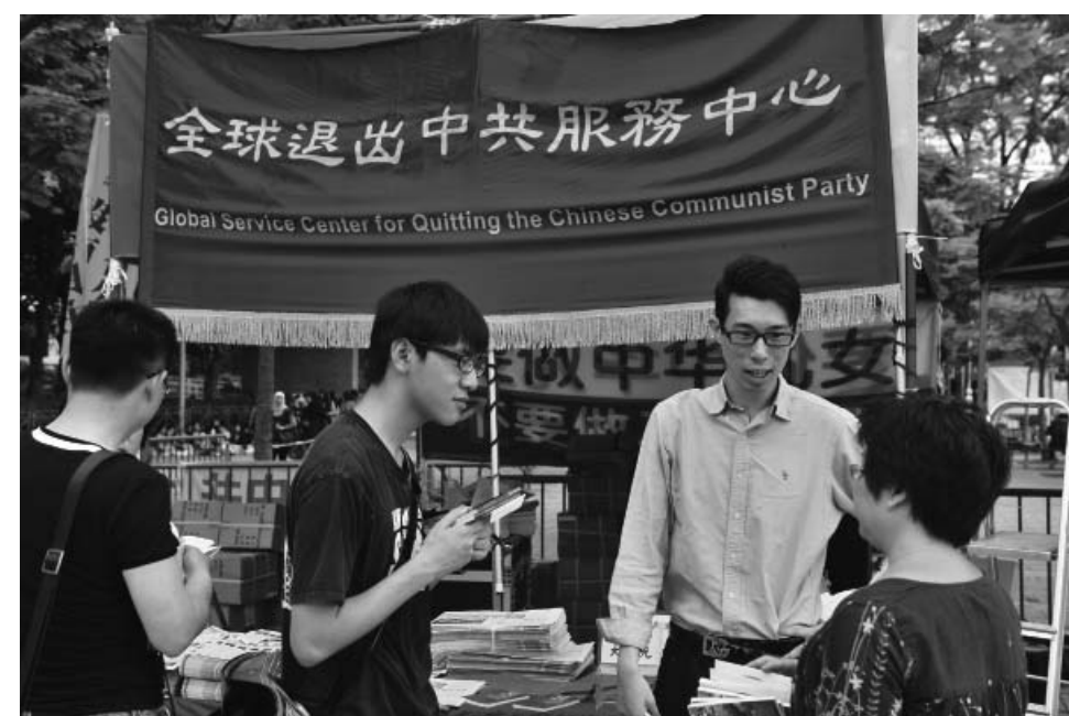
图：香港维多利亚公园的退党服务中心

在“三退”浪潮中，越来越多的中国民众觉醒了。朋友，你退了吗？快快退吧，天要灭中共邪党，“三退”保平安。