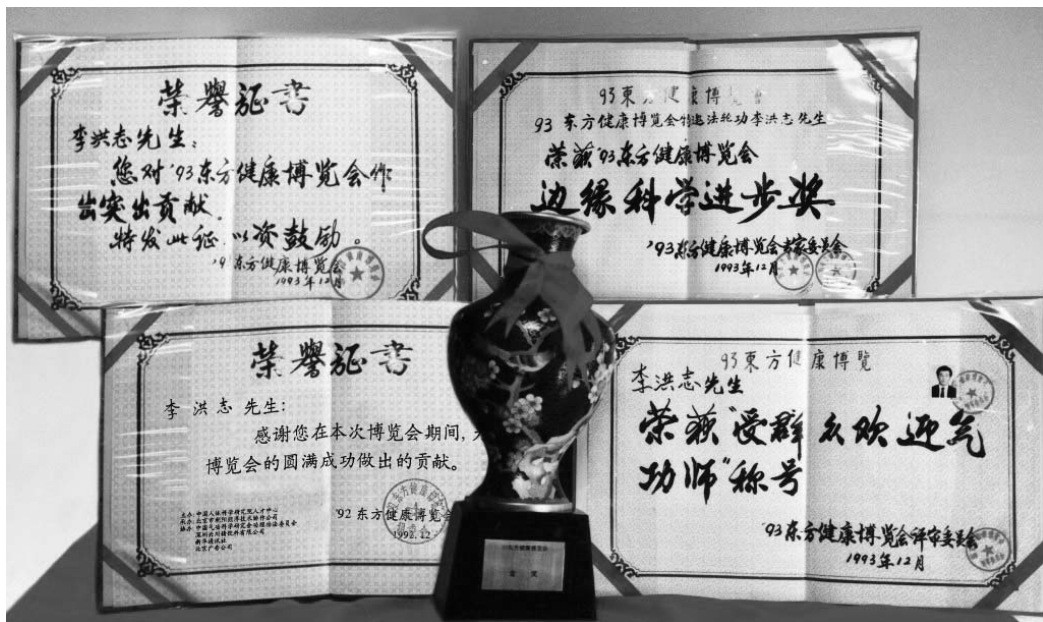
图：李洪志大师和法轮功在93年东方健康博览会获得的褒奖

在这届博览会上，李洪志大师把做学术报告的门票收入全部捐给了“中华见义勇为基金会”。而且在这次博览会上，李洪志大师获得了博览会最高奖“边缘科学进步