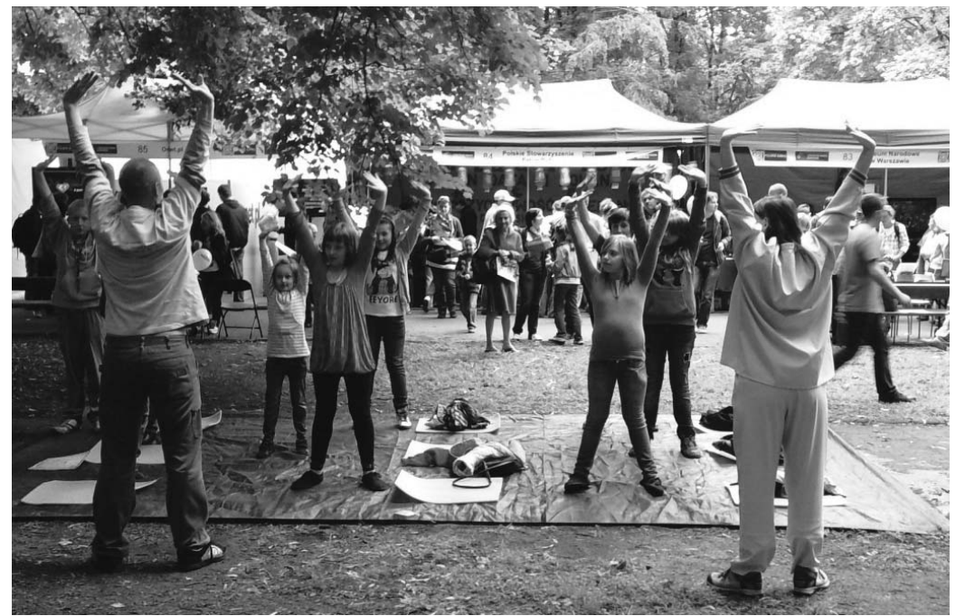
图：欧洲最大户外科普展上的部分学功人群

中波双语的“法轮大法在波兰”与“真善忍”的大字横幅端庄秀丽，身着黄色T恤的法轮功学员正在安静祥和地打坐，慈悲的音乐象一股清流沁入人们的心田。当大家了解到可以在这里学炼法轮功时，只几分钟的时间，就在那里排起一队长龙，人们都兴致勃勃地想要学炼法轮功。不久，在教授练习书法和折叠纸莲花的桌子前也都排