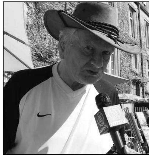
图：马可·盟汤伯勒说，中共比希特勒更恶劣

后表示：我很震惊，从来没想到中共如此残暴。它们是如此的狭隘和缺乏包容性，绝对地权力至上，而人们成了被利用的工具。勒莫瓦纳说：我们必须不断地谴责这种残酷虐待的暴行，并且要付诸行动以推动政府听取真相并向正确的方向运转。