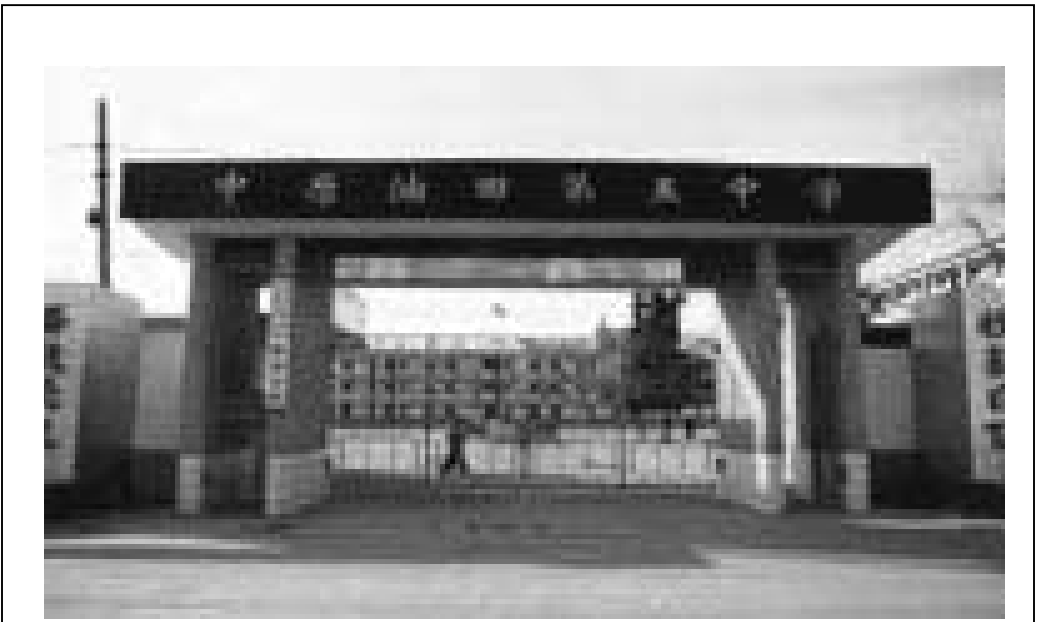
图：中原油田第五中学