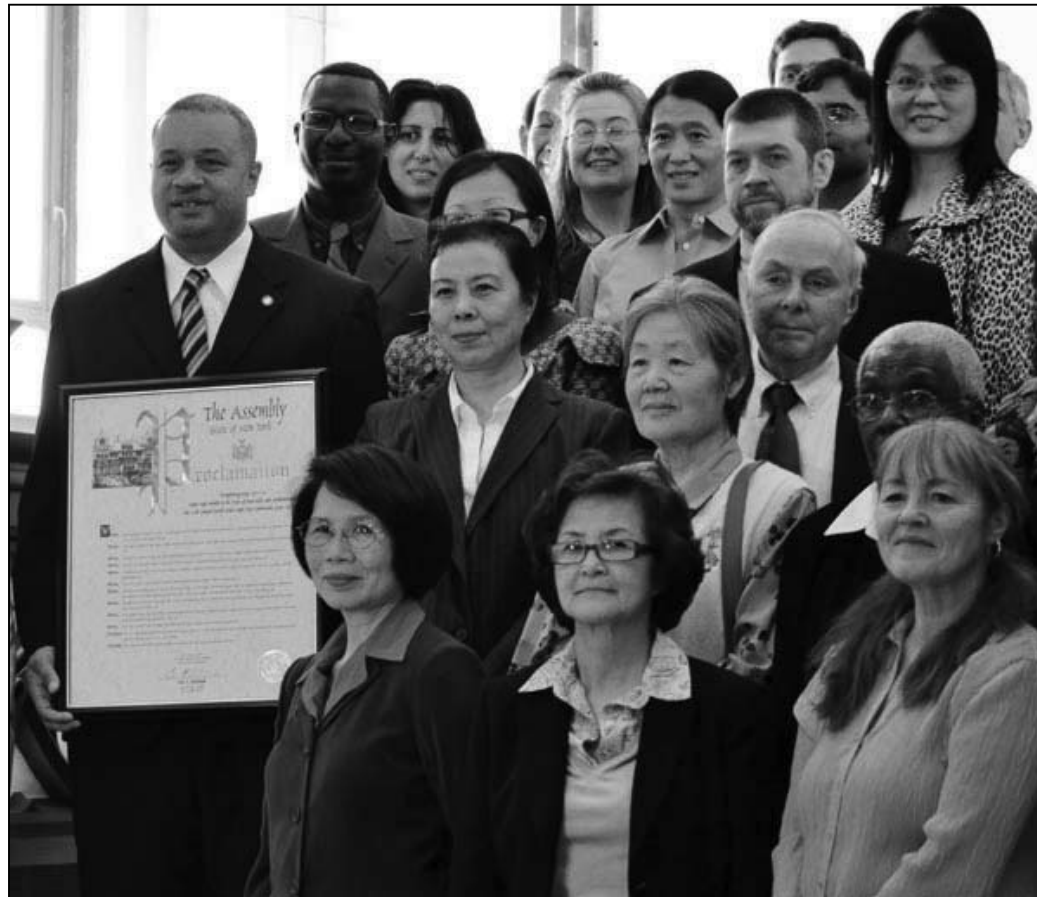
图：纽约州众议员艾里克·史蒂文森（左一）与法轮功学员合影

2006年9月，欧洲议会通过决议，强烈谴责中共当局对法轮功学员的迫害，包括酷刑、活体摘取器官等罪行，要求中国政府立即停止迫害法轮功，并立即释放被关押的法轮功学员。澳大利亚国会参议院于2008年6月24日通过了127号动议案，要求中共停止迫害法轮功。2008年“世界人权宣言”发表六十周年前夕，“法轮功受迫害真相联合调查团”（CIPFG）与全球300多位政要，联署致信联合国人权理事会，要求制止中共迫害法轮功。来自美、加、澳、法、日、韩等18个国家300多位政要联署致信联合国人权理事会主席、联合国秘书长，表示支持已有133国 135万多人参加的“全球百万签名反迫害”行动，呼吁联合国采取有效行动，要求中共立即停止迫害法轮功。2010年3月16日，美国国会众议员在国会大厦投票通过了第605号决议案——要求中国政府立即停止迫害法轮功。