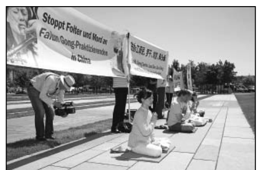
图：法轮功学员在德国总理府前炼功，打横幅，抗议中共迫害法轮功的。但是在德国这个有信仰自由和言论自由的社会里，我可以表达我的想法，希望温家宝能够了解真相，凭着良心做出正确的选择，停止对法轮功的迫害。”

出席六月二十八日立法院《血腥的活摘器官》研讨会的立法委员田秋堇、蔡同荣、陈亭妃均表示，应立法规范台湾民众赴大陆接受器官移植手术，并承诺将协助“器官不明罪”的立法推动。