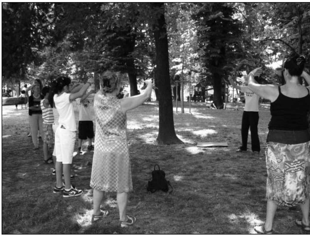
图：一拨又一拨人们来学炼法轮功

一位意大利人看到法轮功遭迫害真相展板后，好奇地停下来仔细阅读，渐渐表情变得十分严肃。他告诉法轮功学员说，他一直很喜爱中华文化，练习武术多年，可是中共迫害法轮功的事情，他以前却一点儿都不知道，