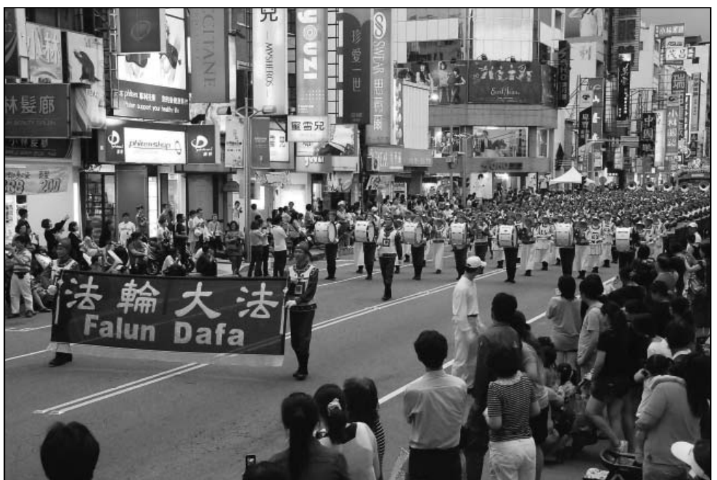
图：天国乐团踩街所到之处万人空巷

据嘉义市市长介绍，嘉义市办理管乐节活动，自一九九三年开始迄今已有十七届，历届受邀队伍来自北美洲、欧洲、亚洲、澳洲等主要国家，活动参与人数曾经达到三十万人。因为今年适逢中华民国建国一百年，嘉义市本次举办的国际级音乐活动，与“台北国际花卉博览会”、“世