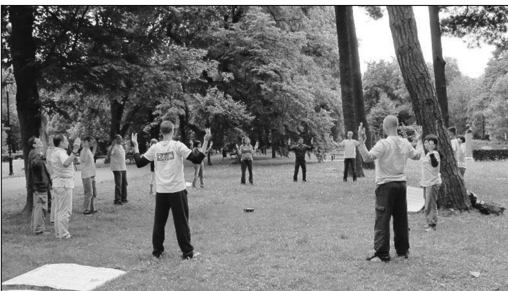
图：尤丹纳公园里，闻讯赶来学功的波兰人加入炼功的行列