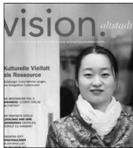
图：奥地利杂志《老城视觉》以法轮功学员作为封面人物

报道中说：法轮功是中国古老的修炼方法。法轮功修炼者在中国遭到迫害和酷刑折磨。修炼者被大批逮捕，法轮功书籍被焚烧，这都是司空见惯的事。在中国甚至还有一个专门负责转化法轮功修炼者的官方机构（注：610非法组织，类似纳粹盖世太保）。而法轮功只不过是一种祥和的修炼方式，是以“真、善、忍”为原则的修炼方法。《老城视觉》是季度性杂志，