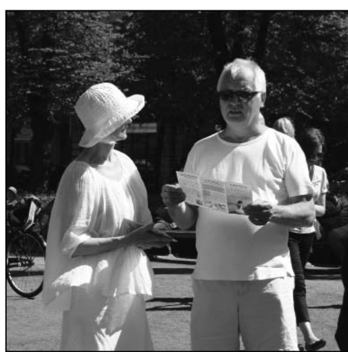
图：法轮功学员（左）讲真相

一位先生告诉学员说，他在中国旅游期间，导游告诉他们不要在公共场合做任何类似气功的动作，不然他们有可能会被抓捕入狱。这位先生不明白为什么。今天在公园看到法轮大法的横幅和演示功法的学员，他想了解更多关于法轮大法的信息。学员为他详细讲述