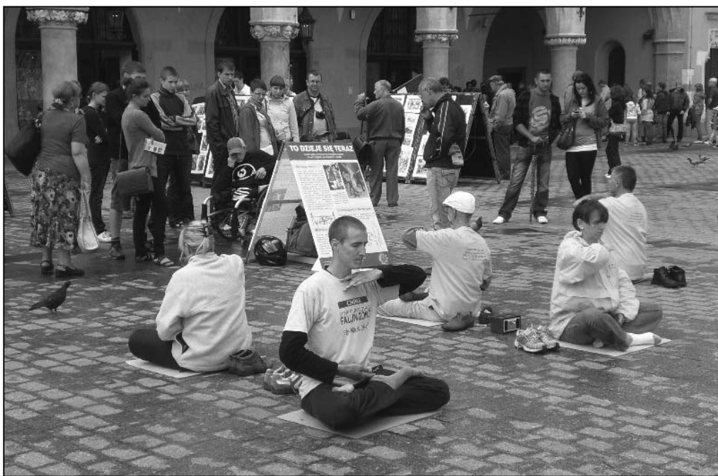
图：克拉科夫老城广场上，波兰民众在观看法轮功真影展板

下午，法轮功学员又来到克拉科夫老城“主市场”（Rynek Glowny）广场。这个中世纪广场宽长两百米，周边有八十一米高的哥特风格的圣玛丽教堂，有波兰历史博物馆和油画博物馆，还有一栋四层楼高的书店，广场中心还有一个已经营业了五百多年