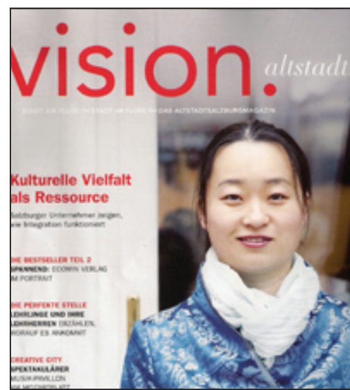
图：奥地利杂志《老城视觉》以法轮功学员作为封面人物

报道中说：法轮功是中国古老的修炼方法。法轮功修炼者在中国遭到迫害和酷刑折磨。修炼者被大批逮捕，法轮功书籍被焚烧，这都是司空见惯的事。在中国甚至还有一个专门负责转化法轮功修炼者的官方机构（注：610非法组织，类似纳粹盖世太保）。而法轮功只不过是一种祥和的修炼方式，是以“真、善、忍”为原则的修炼方法。《老城视觉》是季度性杂志，