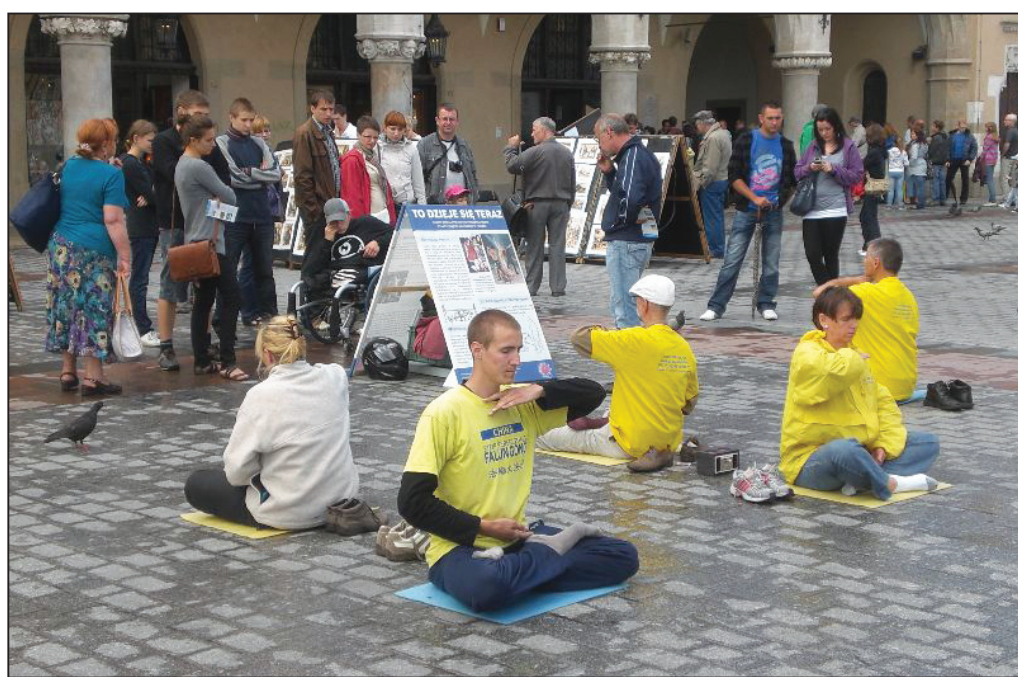
图：克拉科夫老城广场上，波兰民众在观看法轮功真影展板

下午，法轮功学员又来到克拉科夫老城“主市场”（Rynek Glowny）广场。这个中世纪广场宽长两百米，周边有八十一米高的哥特风格的圣玛丽教堂，有波兰历史博物馆和油画博物馆，还有一栋四层楼高的书店，广场中心还有一个已经营业了五百多年