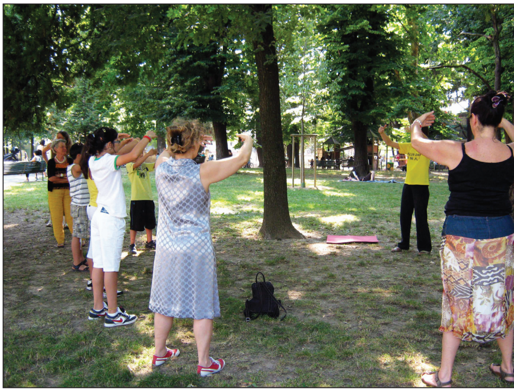
图：一拨又一拨人们来学炼法轮功

一位意大利人看到法轮功遭迫害真相展板后，好奇地停下来仔细阅读，渐渐表情变得十分严肃。他告诉法轮功学员说，他一直很喜爱中华文化，练习武术多年，可是中共迫害法轮功的事情，他以前却一点儿都不知道，