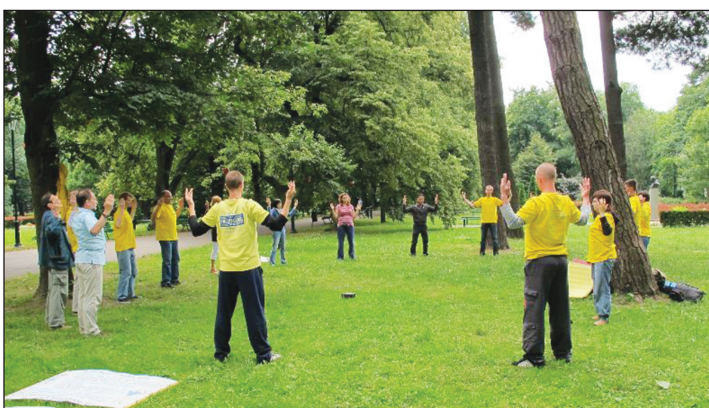
图：尤丹纳公园里，闻讯赶来学功的波兰人加入炼功的行列