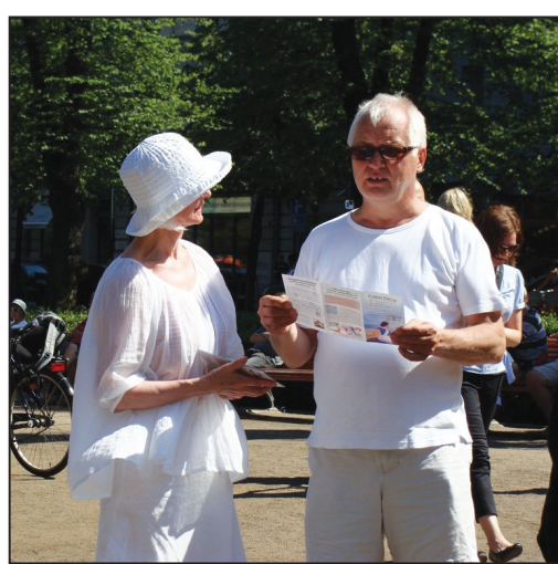
图：法轮功学员（左）讲真相

一位先生告诉学员说，他在中国旅游期间，导游告诉他们不要在公共场合做任何类似气功的动作，不然他们有可能会被抓捕入狱。这位先生不明白为什么。今天在公园看到法轮大法的横幅和演示功法的学员，他想了解更多关于法轮大法的信息。学员为他详细讲述