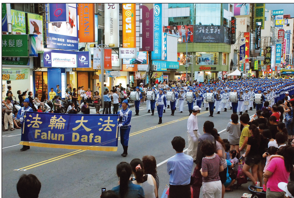
图：天国乐团踩街所到之处万人空巷

据嘉义市市长介绍，嘉义市办理管乐节活动，自一九九三年开始迄今已有十七届，历届受邀队伍来自北美洲、欧洲、亚洲、澳洲等主要国家，活动参与人数曾经达到三十万人。因为今年适逢中华民国建国一百年，嘉义市本次举办的国际级音乐活动，与“台北国际花卉博览会”、“世