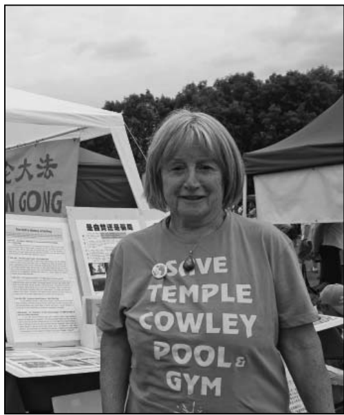
图：牛津市议员努娜·杨

学员们有的向游人展示法轮功五套祥和舒缓的功法，有的向人们分发法轮功传单，讲述真相。民众对中共迫害法轮功表示无法理解，不少人在征签表上签名支持法轮功学员反迫害、对中共活摘法轮功学员人体器官贩卖