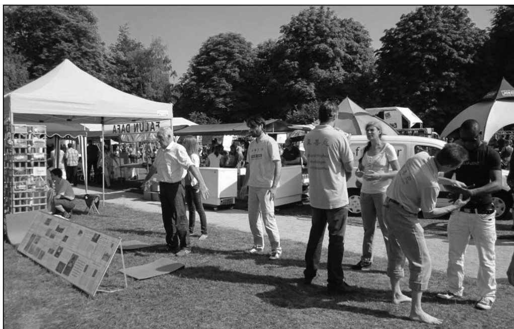
图：梅赫伦市民学炼法轮功