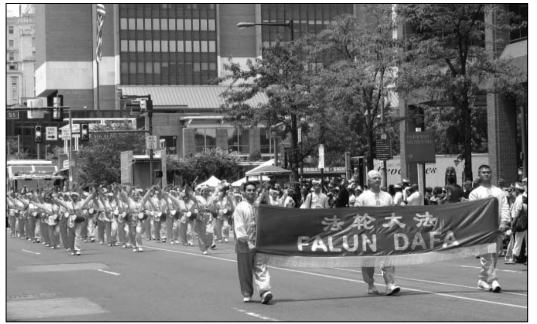
图：费城独立日大游行中的法轮功腰鼓队

于种种原因没有如愿，现在终于联系上学员了。碰巧的是，炼功点距离她的住处只有几分钟的车程。当晚，她在炼功点进一步了解了法轮功真相，如愿学到了梦寐以求的法轮功功法。