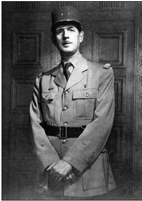
图：戴高乐事后非常感谢那位拒绝执行他的命令的司令。图为戴高乐总统。

在我们这个世界上，就勇敢而言，绝对执行命令的勇敢多而敢于抗拒执行荒唐的命令的勇敢少。这是因为权力者一般都竭力提倡、培养、制造绝对的听命