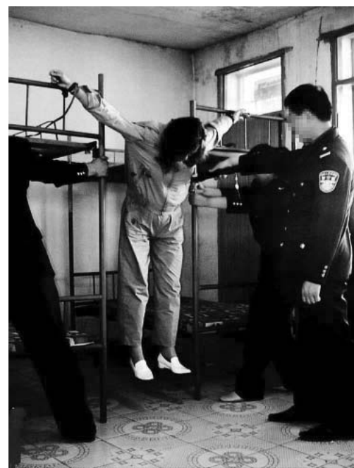
图：酷刑演示：恶警把大法学员的双手分别吊铐在两张上下铺的床栏上，然后指使几名恶人向两边拽床，拽的大法学员身体像裂开一样痛苦，五脏六腑都疼痛异常

站立，右脚被举在上铺床沿上，左腿的小腿骨顶在下铺床沿上，右腿小腿肚压在上铺床沿上，这样他的腿就被劈直了。而后再将他的双手抽紧分别铐在床头和床尾。这样持续一个半小时后，用同样的方式换腿再劈一个多小时。等到放下来时左腿已使不上力了。间歇十来分钟后，恶警又指使犯人用脚踩着他的腿，把另一条腿劈开压，使麻木的腿再次有了撕裂的感觉，比上刑时