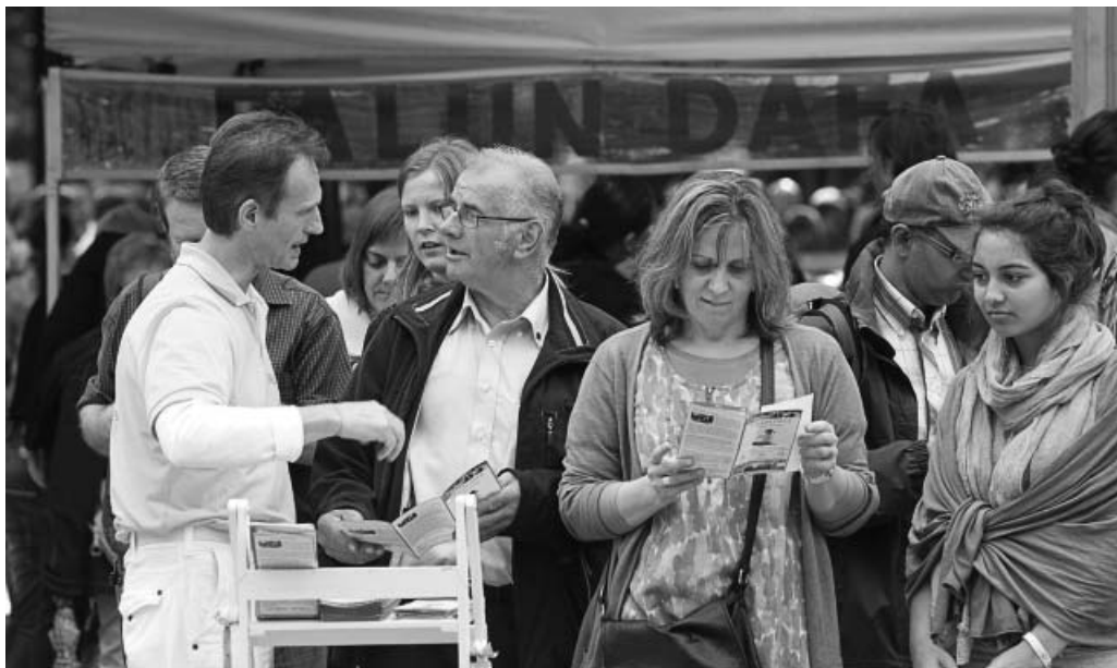
图：法轮功展台前的人们