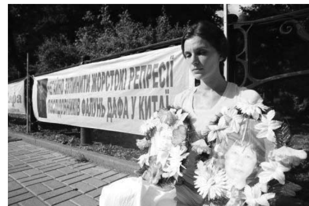
图：乌克兰独立新闻社报道法轮功学员反迫害的图片

集会与游行结束后，活动主办者还在中国城附近及乔治街举行真相长城，以横幅、展板、资料等方式，向路人讲解中共的罪恶及正在发生的退党大潮。