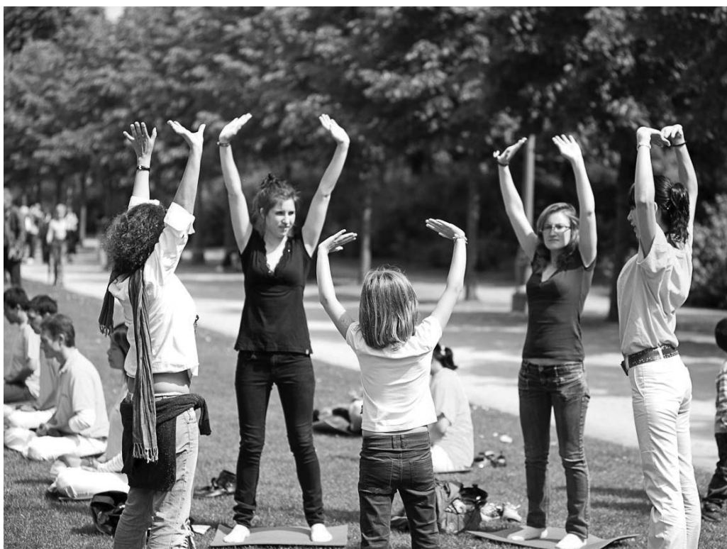
图：现场学炼法轮功的人们

法所带来的精神内涵与丈夫有着同样的感受，她还说：“这应该是让全人类都感兴趣的（功法）。”