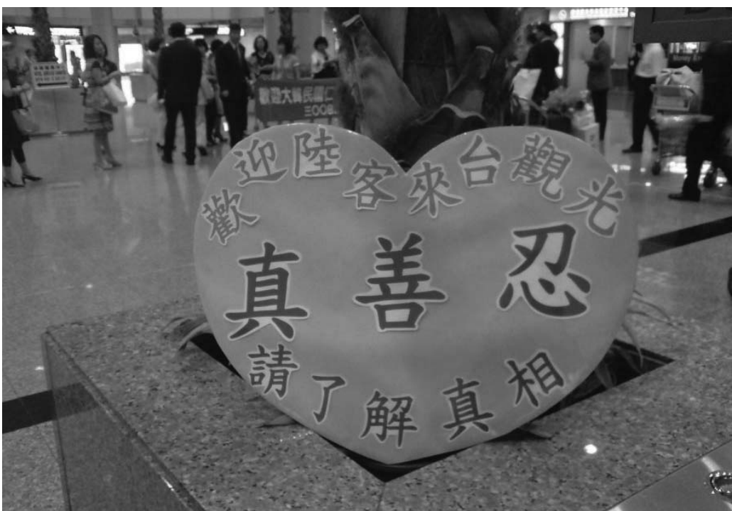
图：桃园中正国际机场大厅“欢迎陆客来台观光”的真相展板

有一次，一位大陆来的学员激动地拉着讲真相的台湾学员去跟她的家人坐在一起，跟他们说说台湾的情况。学员欢迎他们来到台湾，并告诉他们全世界都能合法修炼法轮功，出来了就多看。