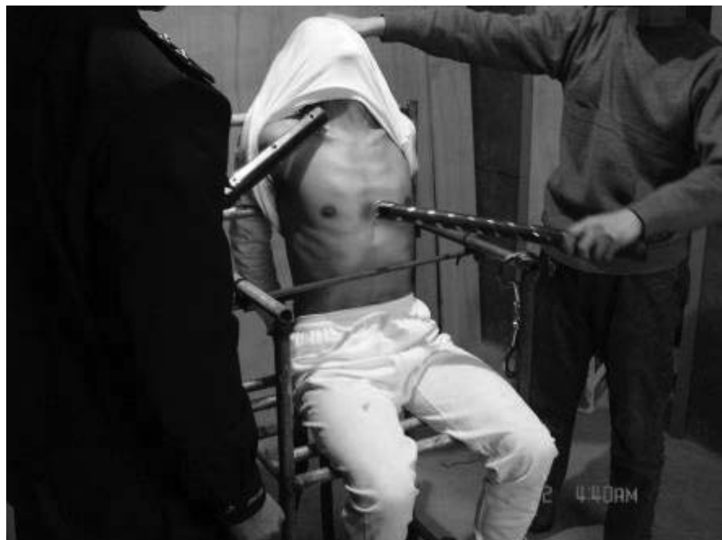
图:酷刑演示:电棍电击

位于安徽宿州市内的安徽省第三监狱,是中共指定关押被非法判刑的法轮功学员的黑窝。法轮功学员被非法判刑入狱后,直接投入严管队(普通刑事犯入监则在监舍),用恶警的话说:就是要给你心理上制造高压态势。期间法轮功学员稍有炼功盘腿等动作,轻则被