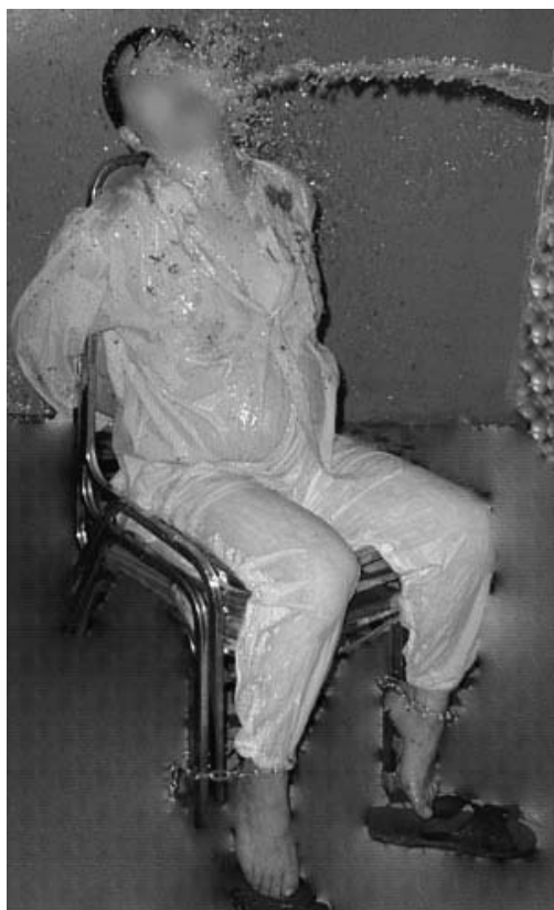
图：酷刑演示：用自来水管子向受害人喷水