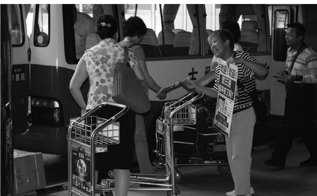
图：在中国大陆游客上车前，法轮功学员仍不放弃善心说真相

看。并诚意地告诉她的家人说：“放心，不会有事的，天佑善良人，我们只是希望你们都能明白真相，当历史翻过这一页时，我们都能问心无愧地说，还好没有冤枉过好人。”后来这一家五口带着笑容，离开机场时还频频回头，挥手道别。