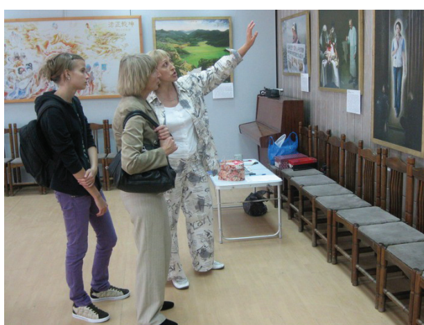
图：俄罗斯米诺新斯科城市画廊观赏真善忍美展

来参观，纷纷赞叹于画作所表现的内涵和画家的技艺。米诺新斯科市文化部主管表示：“真善忍美展”是本城市有着重要意义的大事，市民和来本市的客人对这次画展都留下了深刻的印象。