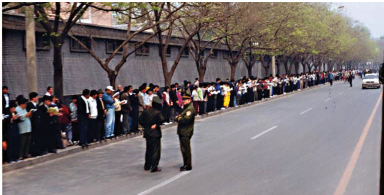
图：一九九九年四月二十五日，法轮功学员在国务院信访办门外的府右街和平上访