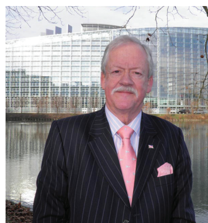
图：欧洲议会议员罗杰·赫尔默先生

（明慧网通讯员韩国报道）自从中共开始大规模残酷迫害法轮功以来，一些法轮功学员为了躲避迫害来到了韩国。目前，除一名法轮功学员通过法律诉讼获得了韩国难民资格外，到目前为止，其余的法轮功学员的难民申请都没有得到认可。同时，韩国政府将十名在韩国未获得难民身份的法轮功学员遣返回中国。