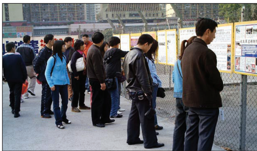
图：在香港旅游景点观看真相展板的游客

对于国人在境外绵绵不断的收获法轮功真相，中共一如既往的试图再以谎言欺骗迷惑人心，阻止人们获