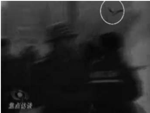
图: CCTV“自焚”节目慢动作分析-2: 重物猛击刘的头部后被弹起

另一自焚者王进东在电视画面中点火自焚后, 两腿间的盛放汽油的雪碧瓶竟然完好无损; 头发最容易被火燎, 但是电视画面中王进东的头发完好(见上图); 电视中王进东背后的警察手持灭火毯悠闲地