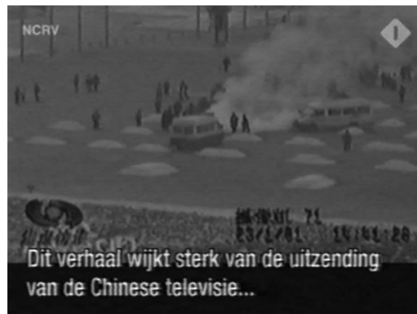
图：荷兰国家电视一台2005年3月14日在「时事评论」专题播放法轮功节目，其中揭露了中央电视台「自焚」伪案，质疑两辆警车为何备有（按中共媒体报导的）二十多灭火器。

他赞成我的分析，我接着给他讲。“中国官方最先说录相是从外国记者手中获得，可外国记者说他们根本就录不上，刚准备录就被在