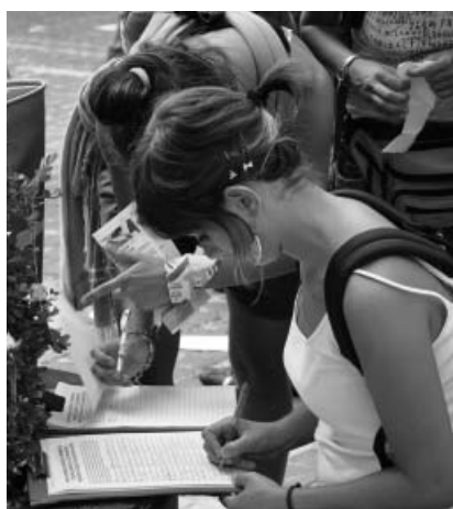
图：意大利民众签名表达他们对法轮功的正义支持

有许多人表示难以理解为什么中共要迫害信仰“真善忍”的人。一位曾在大陆遭迫害的学员以个人的亲身经历解释说：“我在被非法关进拘留所时，上至拘留所所长，下至一般小看管，都对我说：‘我们知道你是好人。’当我反问他们既然你们知道我是好人，为