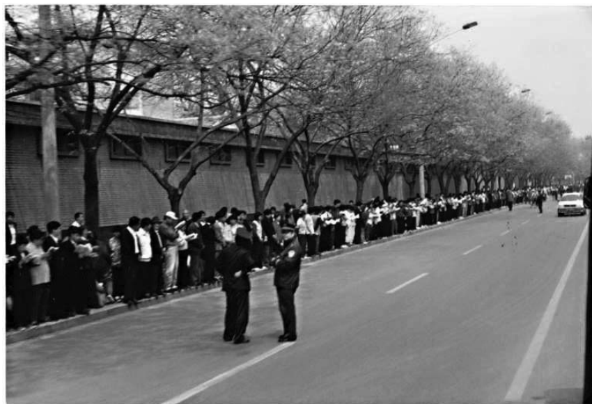
图: 秩序井然的“四二五”上访民众