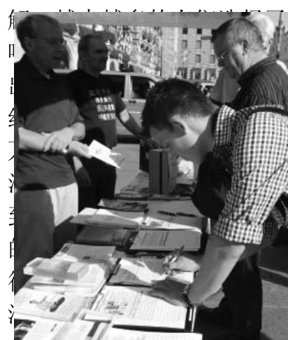
图：民众签名制止中共迫害法轮功

照相留影，有的欣然接过资料，有的表示很敬佩法轮功学员的勇气，也有人关切地询问法轮功创始人的近况。一位大陆来的男士要接过《九评共产党》时，被他的同伴阻止，并催促他快走。法轮功学员告诉他，“他现在管了你，到大难来时，他连自己都保不住，还能管你吗？自己的事情还是要自己说了算。”那位男士听明白了，表示要退出中共。当天共有二十多位大陆人士在现场表示退共产党、退共青团和少先队。