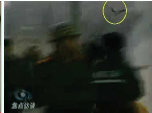
图: CCTV“自焚”节目慢动作分析-2: 重物猛击刘的头部后被弹起

另一自焚者王进东在电视画面中点火自焚后, 两腿间的盛放汽油的雪碧瓶竟然完好无损; 头发最容易被火燎, 但是电视画面中王进东的头发完好(见上图); 电视中王进东背后的警察手持灭火毯悠闲地