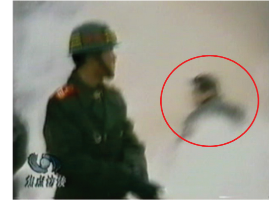
图: CCTV“自焚”节目慢动作分析-4: 一名身穿大衣的男子正好站在出手打击的方位, 仍然保持着一秒钟前用力打击的姿势