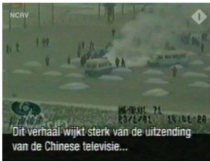
图：荷兰国家电视一台2005年3月14日在「时事评论」专题播放法轮功节目，其中揭露了中央电视台「自焚」伪案，质疑两辆警车为何备有（按中共媒体报导的）二十多灭火器。

他赞成我的分析，我接着给他讲。“中国官方最先说录像是从外国记者手中获得，可外国记者说他们根本就录不上，刚准备录就被在