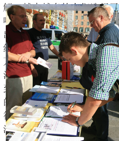
图：民众签名制止中共迫害法轮功

照相留影，有的欣然接过资料，有的表示很敬佩法轮功学员的勇气，也有人关切地询问法轮功创始人的近况。一位大陆来的男士要接过《九评共产党》时，被他的同伴阻止，并催促他快走。法轮功学员告诉他，“他现在管了你，到大难来时，他连自己都保不住，还能管你吗？自己的事情还是要自己说了算。”那位男士听明白了，表示要退出中共。当天共有二十多位大陆人士在现场表示退共产党、退共青团和少先队。