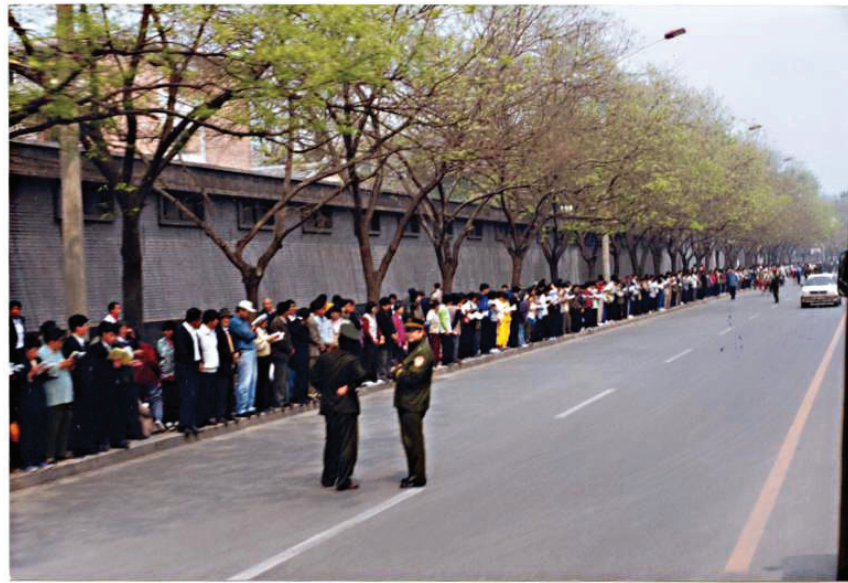
图: 秩序井然的“四二五”上访民众