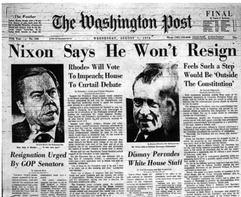
图：1974年8月7日，尼克松总统辞职前两天，华盛顿邮报持续报道水门事件。

会被投到监狱，报纸也会被查封。可是凯瑟琳觉得，新闻应该把诚实作为第一原则，既然有这样的事情，就应该如实报道。不久，“水门事件”第一次在《华盛顿邮报》上被揭露。