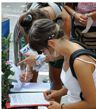
图：意大利民众签名表达他们对法轮功的正义支持

有许多人表示难以理解为什么中共要迫害信仰“真善忍”的人。一位曾在大陆遭迫害的学员以个人的亲身经历解释说：“我在被非法关进拘留所时，上至拘留所所长，下至一般小看管，都对我说：‘我们知道你是好人。’当我反问他们既然你们知道我是好人，为