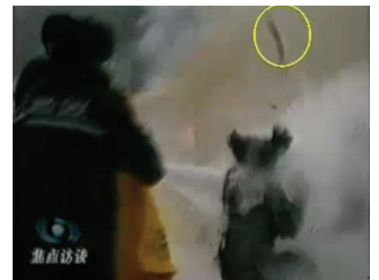
图: CCTV“自焚”节目慢动作分析-3: 重物逆着灭火器喷射流飞向警察