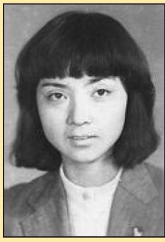
沈阳妇女被中共迫害致死 (第六版)