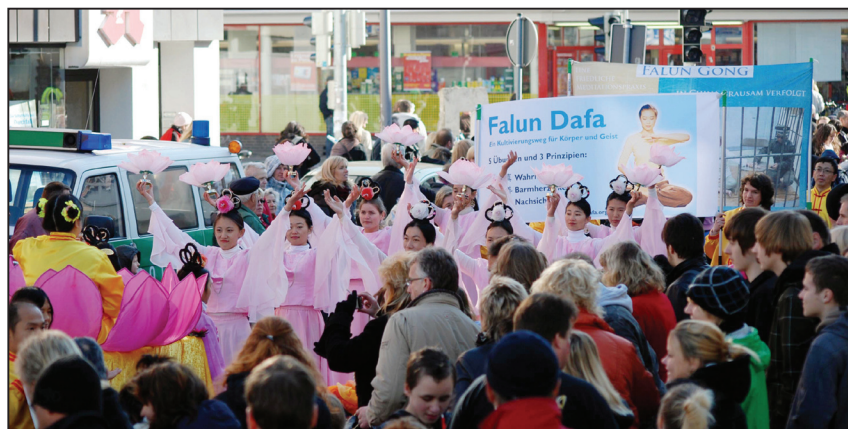
上图：仙女队的莲花舞引来阵阵赞叹

自由集市在不来梅已有九百七十六年的历史了，今年有约二十多万观众观赏。一百四十七个各有特色的彩车，从两米见长的迷你老爷车，到两层楼高的巨型大货车，被装饰成各种风格。今年的游行队伍中，声势最浩大的是法轮功学员组成的欧洲天国乐团、花车和仙女队，所到之处引来阵阵赞叹：“他们 (天国乐团) 的衣服真漂亮”，“我喜欢他们 (天国乐团) 的音乐”，“舞蹈真是美丽”，“太好了，你们明年还来吗？”