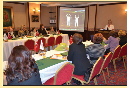
土耳其法轮功学员举办专题介绍会 (第七版)