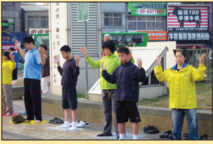
修炼的喜悦与坚持 (第二版)