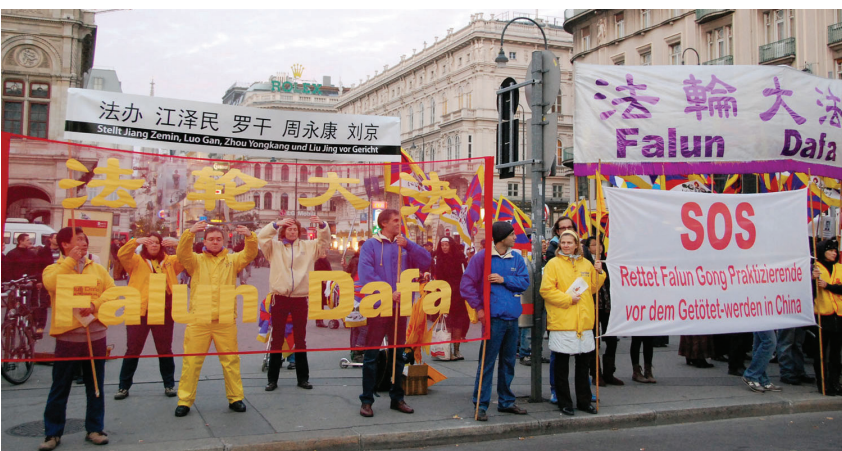
图：法轮功学员在卡拉扬广场抗议中共迫害

十月三十日致十一月一日中共党魁胡锦涛到访奥地利期间，当地法轮功学员举行了和平抗议活动，谴责中共对法轮功的迫害，呼吁惩治迫害法轮功的元凶江泽民、罗干、刘京、周永康，责令中共立即释放被非法关押的法轮功学员。