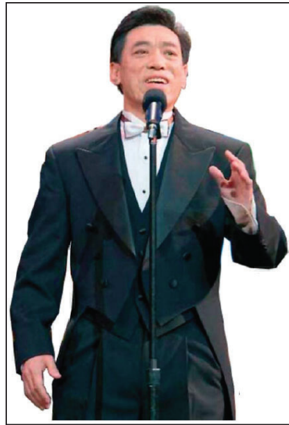
图：著名男高音歌唱家关贵敏

追本溯源，现在人们被中共几十年来灌输了“无神论”、“一切向钱看”等等种种变异思想，使世风日下，道德急速下滑。人们心中的白衣天使变成了白狼：“缝肛门”事件、红包送错肚里留纱布事件等等层出不穷。中共挑起的一次次群众斗群众的政治运动，使人与人之间没有了信任，互相伤害，落井下石，坑、蒙、