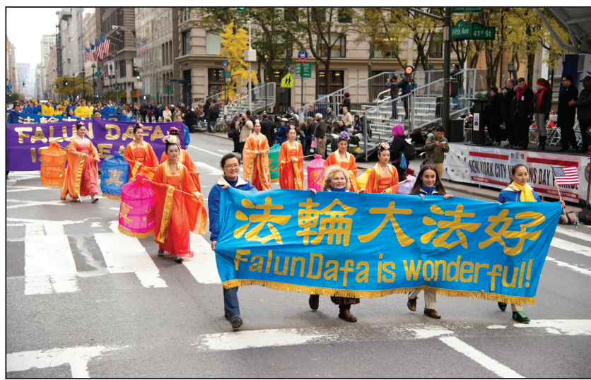
纽约老兵节游行 法轮功展风采

轮功学员手持蓝色的《转法轮》书的模型走在队伍的最前面。其后是手持写有“真善忍”七彩灯笼的盛装仙女们。身着蓝色外套的炼功队伍在舒缓的炼功音乐伴奏下，演示着法轮功法，缓、慢、圆的动作发出祥和的能量。殿后的腰鼓队鼓声齐鸣，在“法轮大法好”的歌声中翩翩起舞，耀眼的金黄色服装闪闪发光。