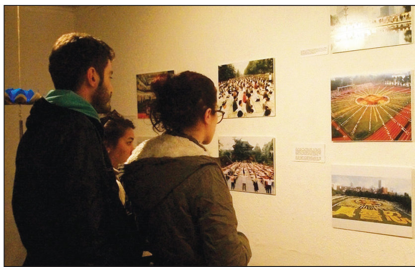
图: 参观者聚精会神地观看图片