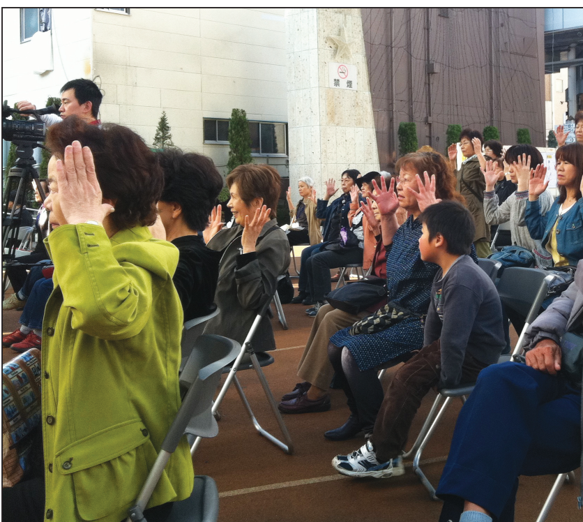
图: 观众跟着法轮功学员做第二套功法

随着学员们不断地向世人讲述真相,人们越来越明白了法轮大法的“真善忍”原则以及对修炼者身心健康所带来的益处。人们也越来越喜欢法轮功学员表演的节目。