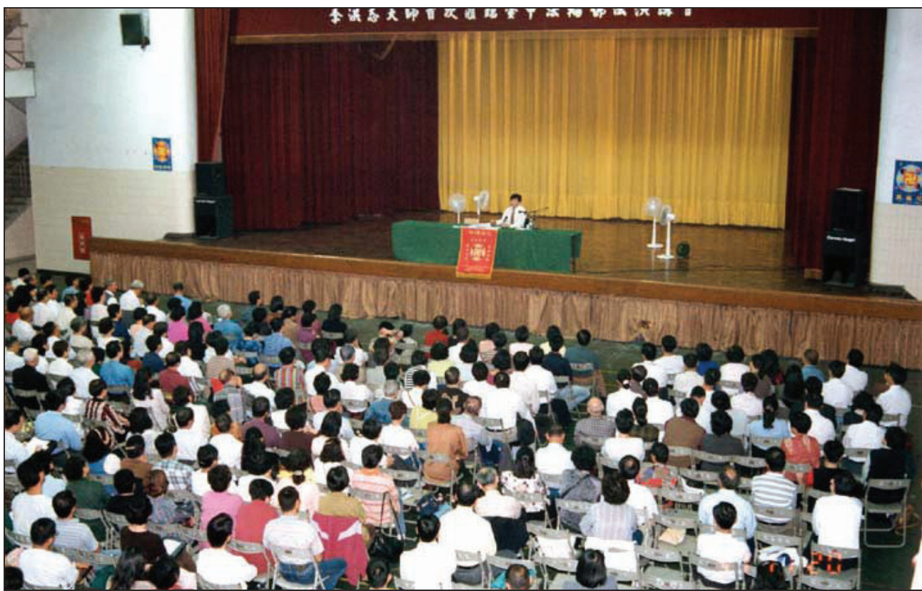
图：李洪志师父于一九九七年十一月在台中雾峰农工讲法

过了约半年，李洪志师父访问台湾时，林福生幸运地去聆听师尊讲法，令他印象最深刻的是，师父讲法五、六小时都没有休息，当时有学员几次请师父稍事休息，但师父都以手势表示不用。