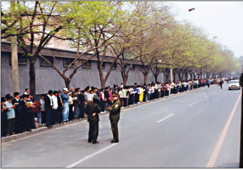
图：秩序井然的“四·二五”上访民众

中共闹事在一九九六年就已经开始。一九九六年六月十七日《光明日报》发表评论文章，诋毁法轮功。《光明日报》不是一个正常的民间媒体，而是中共喉舌。中共的历次整人斗人的运动都是从喉舌媒体的批斗抹黑开始。法轮功学员都是和平善良的民众，他们与世无争，按照“真善忍”做好人，中共喉舌媒体发表批斗