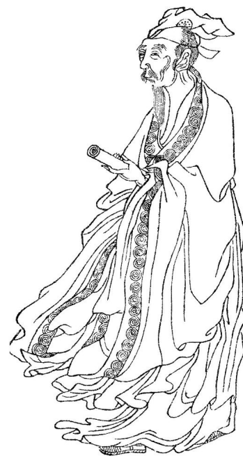
图：白居易画像（刊于民国十年出版的《晚笑堂竹莊畫傳》）

白居易一听，叹服不已，从此走上了修炼的路。他不仅虔心修行，还用他的俸禄请人彩绘大型天国世界图、佛像、神像、印佛经，劝勉人们要信奉佛法，相信因果，并写道“愿以今生世俗文字放言绮语之因，转为将来世世赞佛乘转法轮之缘”。