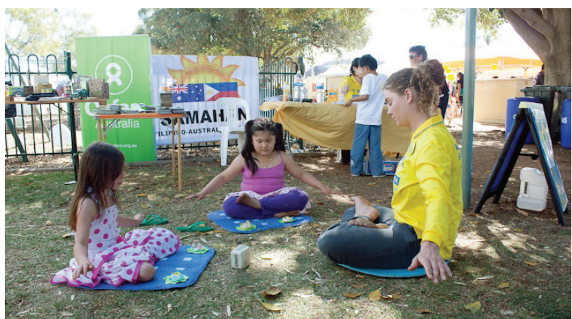
图：学打坐的小姑娘