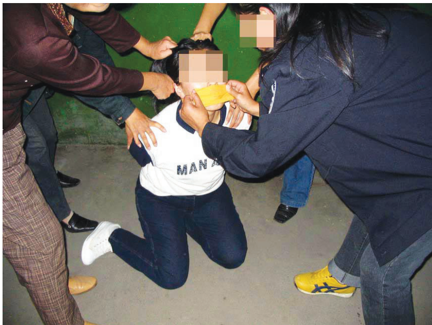
图：酷刑演示：用胶带封嘴

自从中共重庆市委书记薄熙来(曾在辽宁因迫害法轮功学员臭名远扬)及王立军(紧随薄熙来，曾在辽宁密令不法人员活摘法轮功学员器官，调到重庆后任重庆市公安局长)到重庆后，重庆地区对法轮功学员的迫害就更为严重。在薄熙来、王立军及重庆“六一零”淫威下，重庆各地大肆非法抓捕法轮功学员，二零一一年七月二十日前后就有近二百名法轮功学员被非法抓捕，