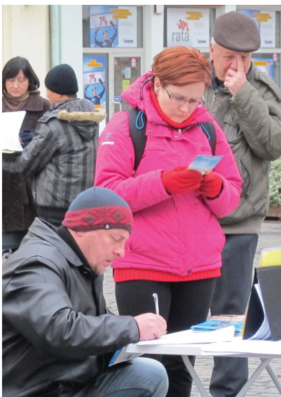
图：波兰民众明白真相后纷纷签名反迫害

一位小学生，跟在法轮功学员身后，等到大人都签完后，才小声问：“我不够十八岁，还没有身份证，我也不记得我的税号，我是不是也可以签名？”法轮功学员肯定地告诉他，在人的良知道德问题上是不分年龄的，在正义和邪恶之间作选