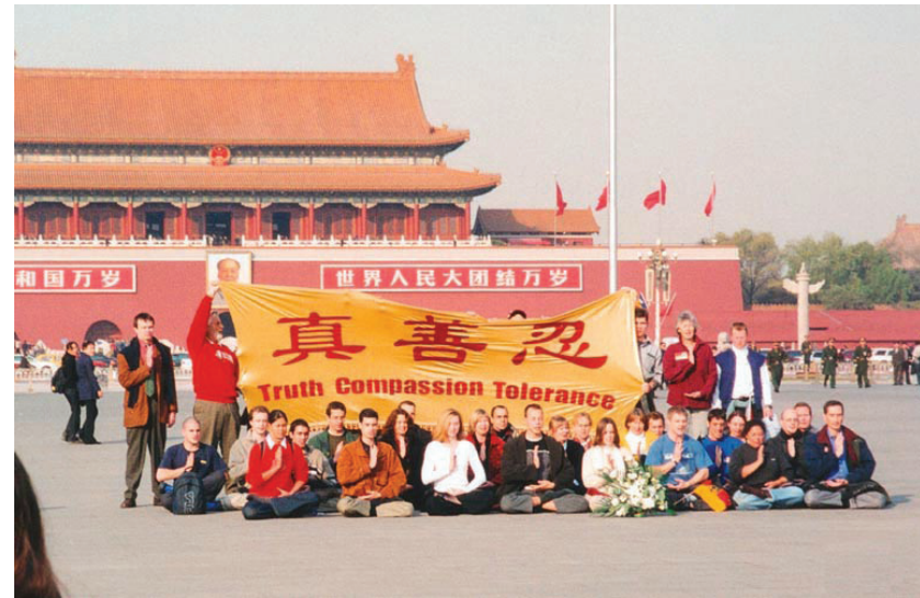
图：二零零一年十一月二十日，三十六名西人法轮功学员到天安门前打出了“真善忍”的横幅，向中国人民讲述法轮功的真相。

地的法轮功学员冒着生命危险，在天安门广场和平请愿的壮举。而这些铭刻在历史中的一幕幕，却是中共想方设法封锁，不想让中国人了解的。其中部份中国法轮功学员在天安门上访后，被中共动用国家机器和军队活摘器官致死，这重大的历史真相，正随着中共退出历史舞台被一步步地揭示给世人。