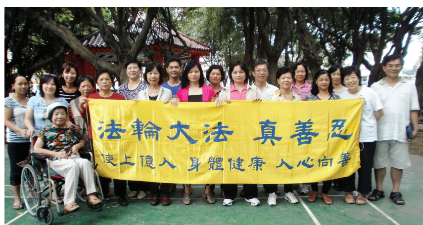
图：曾先生（后排戴眼镜者）修炼法轮功后，摆脱忧郁的人生，生活变得踏实而有意义。

好，当问题的冲击上来时，他就会先静下心来，不象从前，用情绪很激动地处理事情，紧张的婚姻关系日渐变好，与儿女的关系也缓解。现在，如果太太较为不理智地与他对话时，他会想到师父讲的“向内找”法理，先想到自己说出去的话、做的行为是否有刺激到对方，也就能理解、包容妻子的情绪。