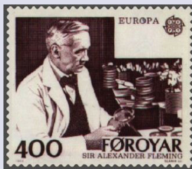
图：弗莱明纪念邮票

随着时间的流逝，弗莱明的儿子从伦敦的圣玛丽医学院毕业了。经过自己的努力，他后来成为世界有名的“亚力山大弗莱明”，青霉素就是他发明的。