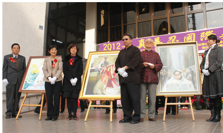
图：南投“真善忍国际美术巡回展”开幕揭画仪式

一位学员带着真相资料去按中使馆的门铃，但没人出来开门。一旁的警察说，再按，多按会儿。使馆还是一片沉寂。其实，学员只是想将真相资料当面递给里面的人，但是没有一人出来接。警察觉得可笑。学员把真相资料投进中使馆信箱里。学员看见对面中使馆的窗口有人在录像。过了一会儿，先是大使出来，没等学员走到跟前，他就驾车跑了。又出来两个中年男子，边打手机，边东张西望，看见一位女学员走过来，其中一人对着手机里喊：“他们要是再逼近我，我就喊警察了！”此时，一群克罗地亚警察就在他旁边。法轮功学员说，外国警察要是能听懂他说的话，对中使馆人的这些不理智行为会觉得更加不可思议。