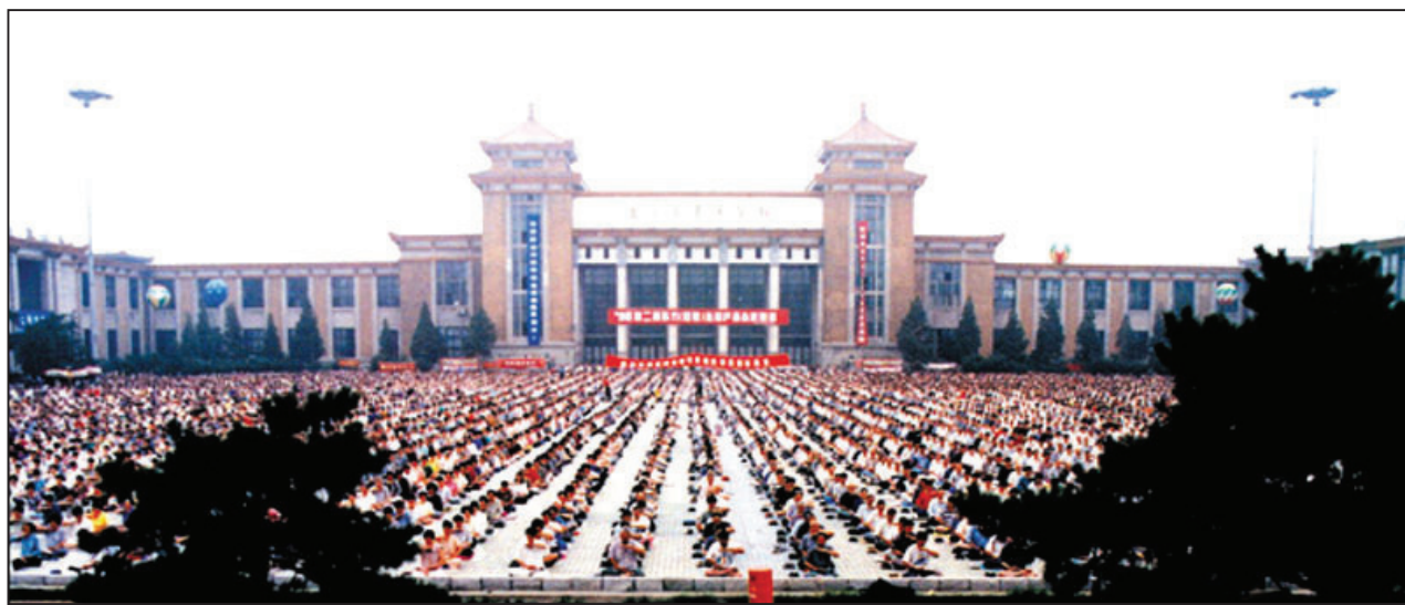
图：1998年沈阳万人集体炼功

这位作家患的什么疾病呢？是脊椎病。这忽然便使我想起中国大陆湖北的一个人来，她也曾患有脊椎病，可是自从她二零一一年清明节开始修炼之后，便发生了枯木逢春般的变化。她说：“我以前无数次的想到了死。”走入修炼后，“我身体有很大的改观。我记得在学法十天左右的一天晚上洗澡，我的手无意中触到了脊椎处。我惊奇地发现：向左边偏弯的脊椎正了。当时又没有打针和吃药，只是看大法书，弯曲的脊椎都快直