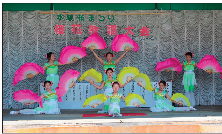
图：明慧学校的法轮大法小弟子们表演扇子舞

这两天的中午，法轮功学员们在舞台上的文艺表演，吸引了很多来赏樱花的人。明慧学校的法轮大