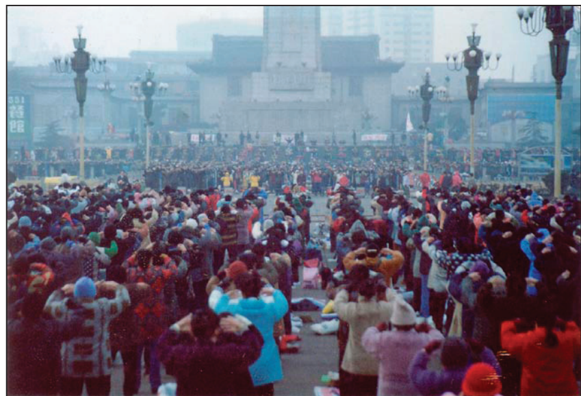
图：法轮功学员在剑潭活动中心草坪上集体晨炼

二零零一年农历正月的一个傍晚，我突然感觉眼睛看东西模糊，有重影（医学上称为“复视”），并且行走不便，头部胀痛，之后日益加剧。无奈只好上医院诊治。接诊的医生听说上述症状立感无能为力，建议转院到市级医院诊疗。于是我们立即赶往市中医院，在那里治了近一个月，打针、针灸、按摩等等，各种滋味尝了个遍，入院时的症状不见好转不说，某些方面还有所