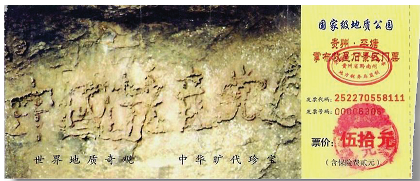
图：贵州省平塘县掌布乡国家级地质公园门票