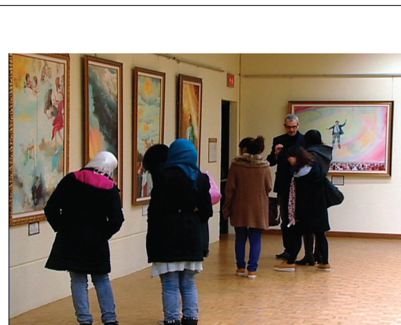
图：真善忍美展吸引卑诗省大学师生参观

法轮功也称法轮大法，是由李洪志先生于一九九二年五月传出的佛家上乘修炼大法，以“真善忍”为根本指导。经亿万人的修炼实践证明，法轮大法是大法大道，在把真正修炼的人带