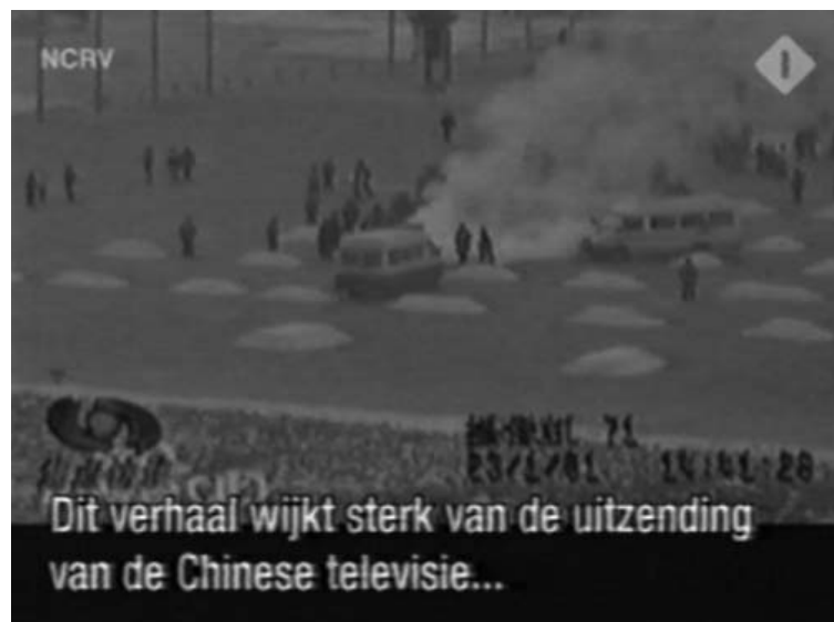
图：荷兰国家电视一台2005年3月14日在「时事评论」专题播放法轮功节目，其中揭露了中央电视台「自焚」伪案，质疑两辆警车为何备有（按中共媒体报导的）二十多个灭火器。

一个月后，我回家了。到家才知道，当电视演自焚戏时，九岁的儿子当时就说：“自焚的不是法轮功，法轮功不杀生，不自杀。”他爷爷说：“是法轮功。”儿子说：