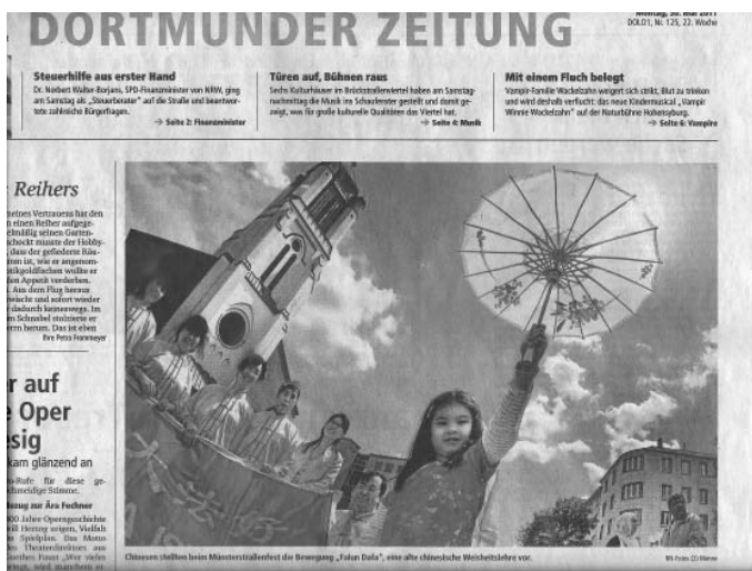
图：鲁尔信息报上刊登的巨幅照片

是缓慢圆的，在祥和的音乐声中，人们认真地听着解说员对法轮功每一个动作的讲解。很多人都是第一次听说什么叫结印，什么叫阴阳，什么叫合十，什么叫双盘打坐，什么叫周天等，在炼法轮功的时候，身体和宇宙是怎样做能量的交换而达到身体健康的目的。各族裔的人们深深地被这东方深厚的修炼文化所吸引，功法展示结束后报以热烈的掌声。