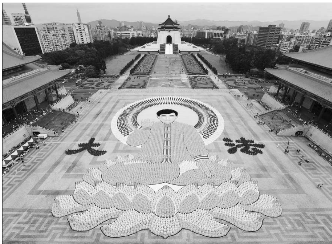
图：台湾法轮功学员在中正纪念堂排像

台湾社会广泛的知道法轮功这个修炼团体，是从一九九九年中共政权打压法轮功的时候开始的。经过十三年来的努力，法轮功在台湾不但已经摆脱中共官方宣传的丑化，学习和修炼的人数持续增长，而且成为领导台湾社会正视中共邪恶势力的主要力量，得到社会各界的肯定。