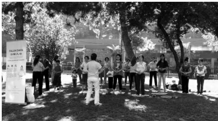
图：伊斯坦布尔市的Ortakoy公园里，游人踊跃学炼法轮功

法、法轮周天法和神通加持法」，并且有一套以「真善忍」用来说明宇宙人生原理的教导。据估计，在一九九九年之前，在大陆学习的人有上千万（编注：当时官方估计有七千万至上亿人修炼法轮功）。一九九九年受到中共打压之后，更广泛传播到台湾、美国、欧洲、澳洲等地区。法轮功学员在中共倾国家之力，用残暴的手段镇压的情况下，不但没有被摧毁，相反的，许多法轮功学员的坚定信仰，让世人改变了「中国人没有坚定的信仰」的一般印象。因此，有良心的人们开始为法轮功辩护。法轮功也在全世界范围内得到了人们的尊敬。