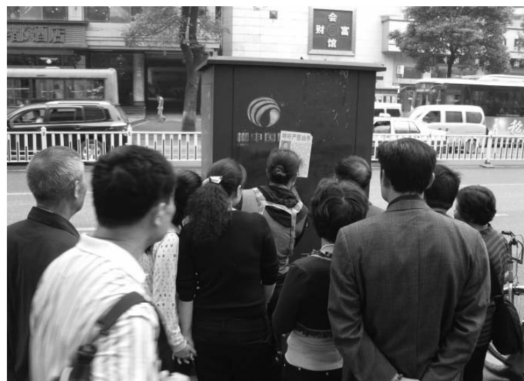
图：民众观看“呼吁严惩凶手”的张贴

尽管综治办、居委会每天每时都派专人清除粘帖，但“呼吁严惩凶手”的粘帖还是不时的显现在大街小巷中，给人们了解真相打开了一扇窗口。公道自在人心。