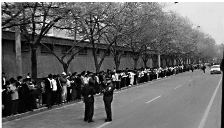
图:一九九九年四月二十五日,逾万名法轮功学员在北京和平上访

众、非法抄家、拘禁、罚款等严重干扰法轮功学员正常修炼的事件。到一九九九年四·二五之前的三年中,中共的打压、骚扰没有间断。