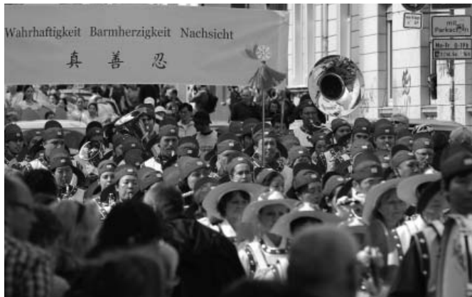
图：欧洲天国乐团第一次参加比勒费尔德多元文化节大游行

新老城区，马路两边水泄不通，挤满了市民。欧洲天国乐团身着蓝白相间的古装，紧接其后的是金黄花车上舒缓优美的功法演示；粉裙飘飘的扇子舞队清丽脱俗，轻摇绸扇，让久盼的观众耳目一新；而压阵的则是几面大横幅，揭露中共活体摘取法轮功学员器官牟取暴利。