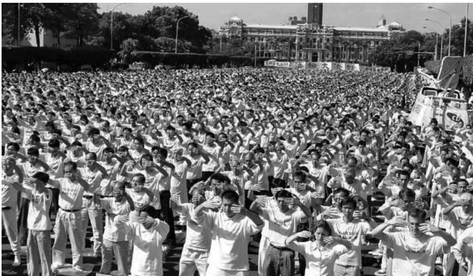
图：二零零七年四月台湾法轮功学员在台湾总统府前万人炼功

溪修炼法轮功后的转变，待人处事的方面，变得没脾气、不再爱出风头是身边人对他们的共同感觉。