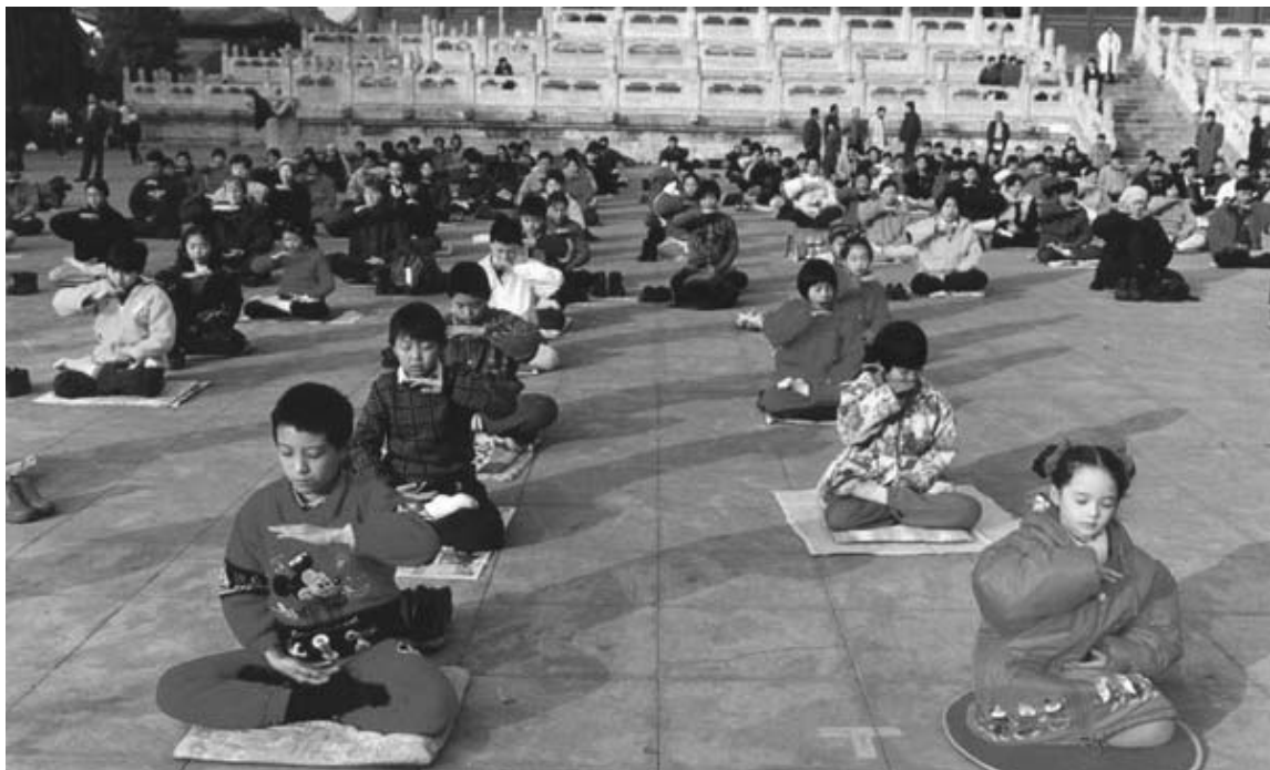
图：迫害发生前，大陆小弟子炼功图片

奇迹真的出现了。第二天早晨，孩子喊着要卡迪那食品，已十多天不吃不喝、头天喝水腮帮子疼的直哆嗦的孩子开始吃饭了！在场的人都惊呆了，