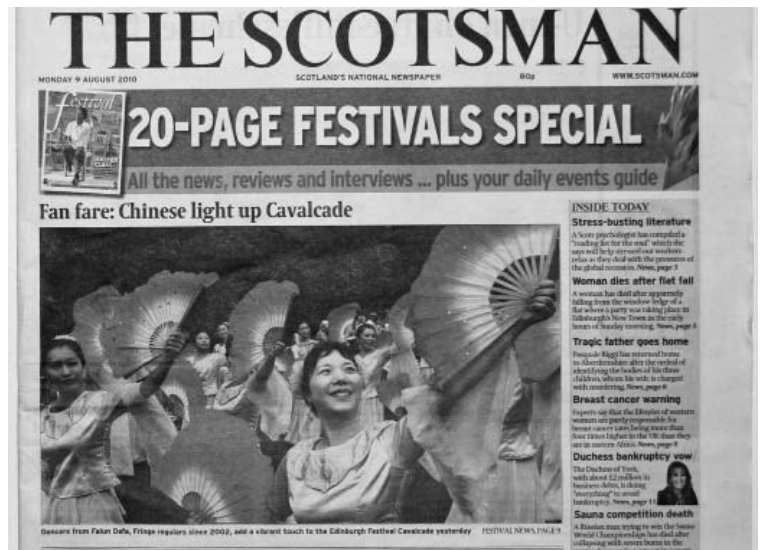
图：《苏格兰人报》刊登了法轮功团队的大幅照片