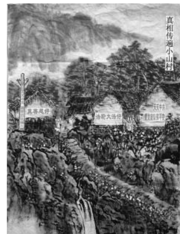
图:水墨画:真相传遍小山村

到家了,我回到自己的房间,一点困意没有而且身体轻飘飘的,心情非常舒畅,希望我们发出的每一份真相资料都能被村民看到,使他们受益。