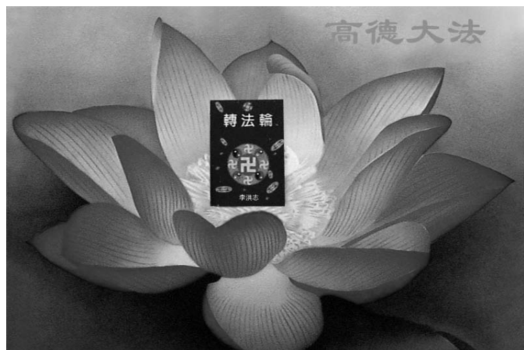
图：手工喷绘：“高德大法”

后来一位法轮功学员对她劝善，给她介绍法轮功，她也走上了修炼之路，明白了炼功人要有慈悲心，善待每个人，不能杀生，更不能杀人造大