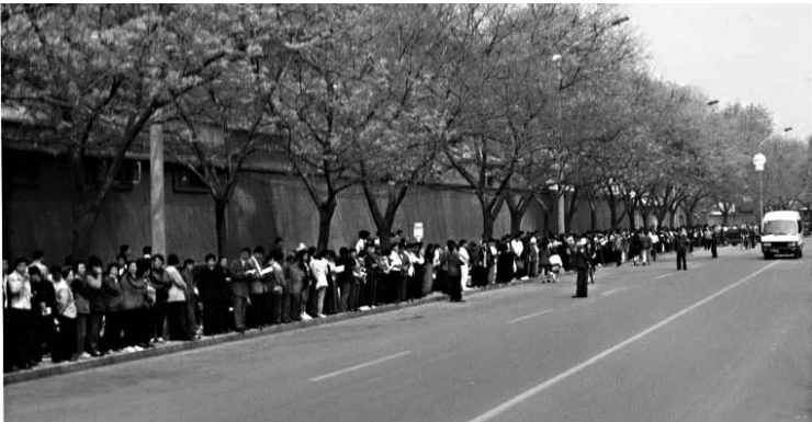
图：秩序井然的四·二五上访民众

1997年初，罗干指示公安部在全国进行调查，网罗罪证欲定法轮功为“×教”，但各地均上报反映“尚未发现问题”，调查不了了之。1998年7月，公安部一局又发出公政[1998]第555号《关于对法轮功开展调查的通知》。《通知》中先把法轮功定罪为“×教”，紧接着又提出：要掌握法轮功活动内幕情况，发现其违法犯罪的证据，各地公安政保部门要深入开展调查。但在全国各地仍然未搜集到任何一条所谓罪证。