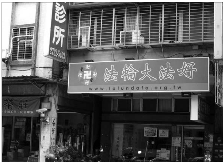
图：沈牙医诊所外的“法轮大法好”看板

沈医师帮他检查后发现，三颗牙根已断，只剩一个牙根粘不住四颗假牙，于是告诉病人必须重做才行，并且向他说明粘不住的原因，病人微微低头喃喃回说：“我知道要重做，可是我因为现在没钱，你能不能帮我粘。”