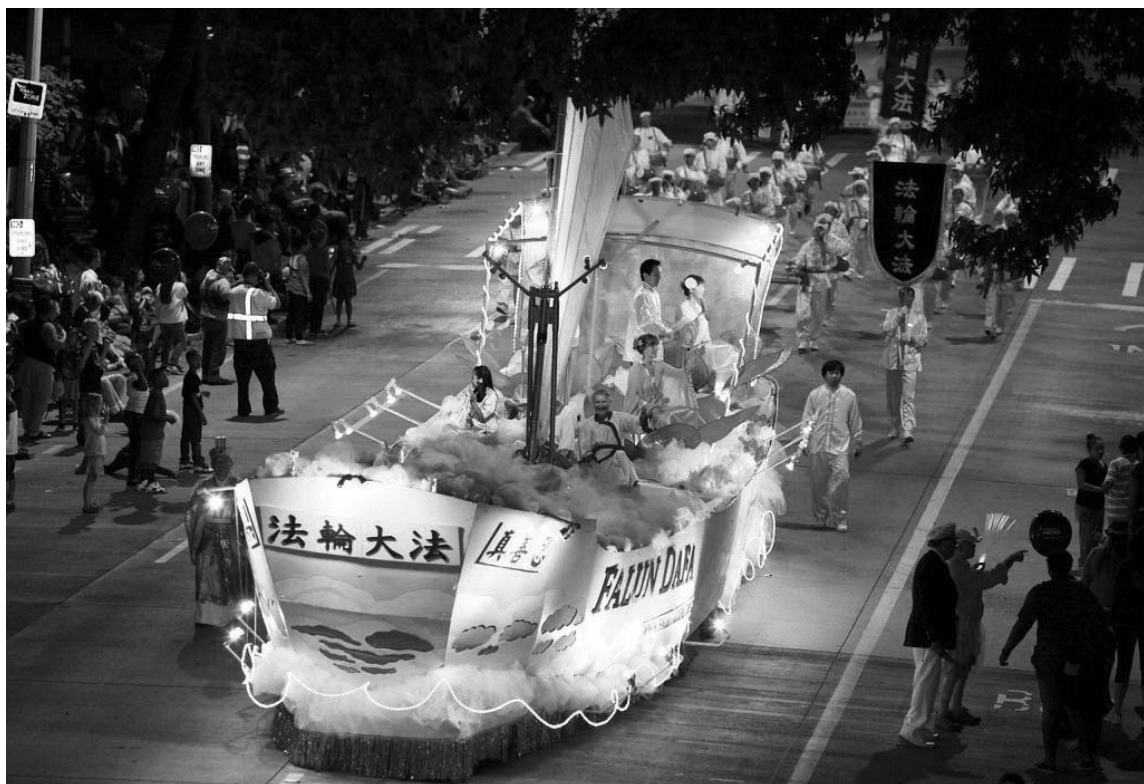
图：“法船”造型的花车美丽殊胜庄严

电视台KIRO7现场直播，主播介绍说：“法轮功，又称法轮大法，是一种古老的性命双修的功