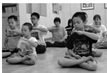
图：在炼法轮功第五套功法—神通加持法

平时，虽然两兄弟会争吵，但是因为同修一部大法，知道“失”与“得”的关系，知道做坏