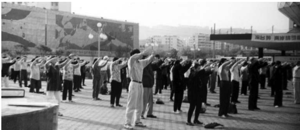
图：迫害发生前，大陆法轮功学员集体炼功（第二套功法：法轮桩法）

从沈阳回来时先到抚顺我的妹妹家住下了。第二天的早晨，那是九七年五月初的一天，这一天是我生命重生的一天。我的妹妹和妹夫带我出去，走不远到了一个叫“天丰商场”的广场。隐约看到有很多人，不知在干什么。此时，我只听到了一种美妙悦耳的声音，我问他们这是什么声音？怎么这么好听呢？妹夫说这是人家在炼功呢。我接着