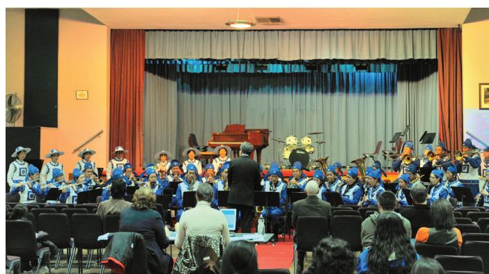
图：悉尼天国乐团参加莱特伊诗塔福歌唱和音乐比赛

此次比赛中，由法轮功学员组成的天国乐团身着蓝白色古装，排成半圆弧形乐阵，参赛的三首曲目是：“法轮大法好”、“助师正