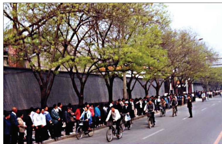
图：“4·25”当天在公共汽车中拍摄的上访人群和悠闲的警察。注意：人群后面的并不是中南海的红墙，街上能看到自行车行驶，根本不存在什么“围攻”。

序井然，离开后地上无一片纸屑，连警察扔的烟头都被法轮功学员清扫干净了。国际社会将4·25上访称作“中国上访史上最理性、最平和的上访”。