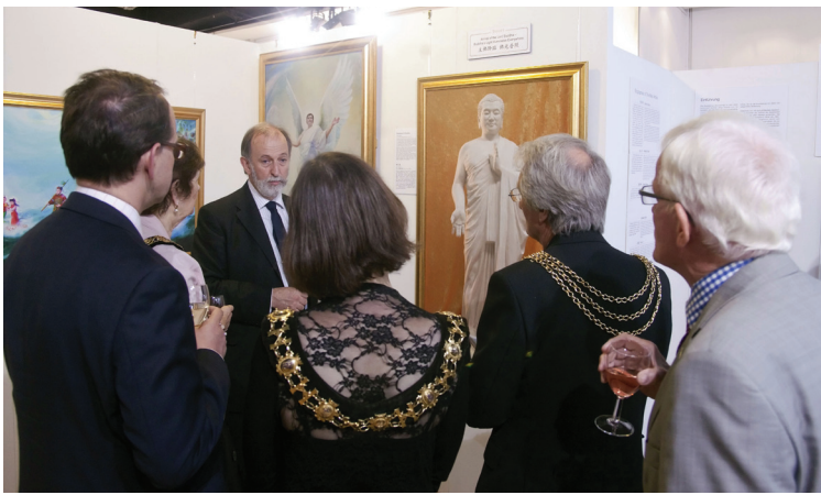
图：多位市长应邀出席伦敦真善忍国际美展开幕式

兰贝斯市长克萊夫·贝内特（Clive Bennett, Mayor of Lambeth）赞叹真善忍美展具有震撼人心的强大力量，他说：“我带走的主要信息是艺术的力量，让人们改变他们观念的力