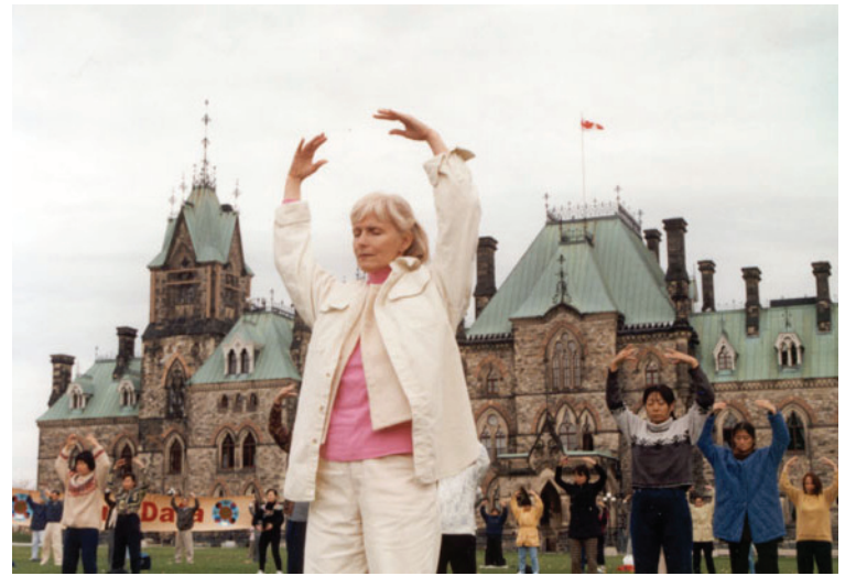
图：康妮在练习法轮功第二套功法

我很高兴能以真善忍为生活的中心。现在所有事情都富有意义。从前当我对人真诚，友善耐心时，总是不被人理解甚至被人欺负，结果自己也感觉很糟。如今我了解不被友善对待背后的原因。虽然外在现实中仍然时常遭受粗暴的对待和谩骂，但我内心微笑对待，明白这是让我去掉又一个执著。做一个修炼人真是奇妙！世界变得如此美好！别人