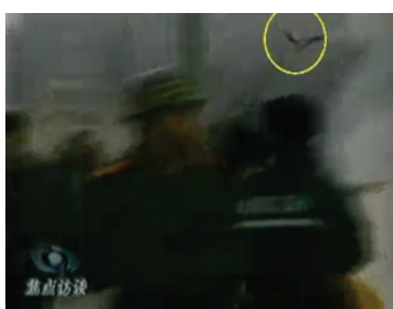
图：CCTV“自焚”节目慢动作分析-3：重物逆着灭火器喷射流飞向警察