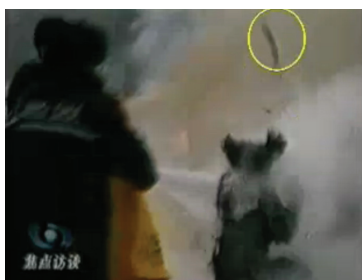
图：CCTV“自焚”节目慢动作分析-2：重物猛击刘的头部后被弹起