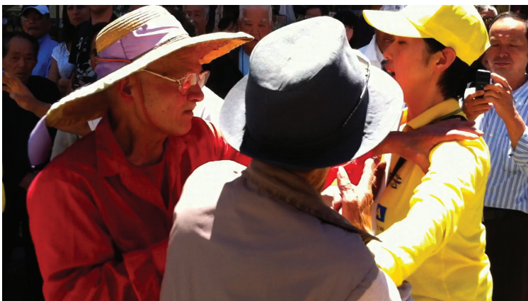
图：暴徒攻击、殴打法轮功学员的罪证

Miller) 表示：“法庭的判决为最终判决。如果被告不遵从法庭的判决指令，我们有权决定是否采取进一步措施。”