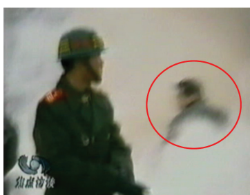
图：CCTV“自焚”节目慢动作分析-4：一名身穿大衣的男子正好站在出手打击的方位，仍然保持着一秒钟前用力打击的姿势