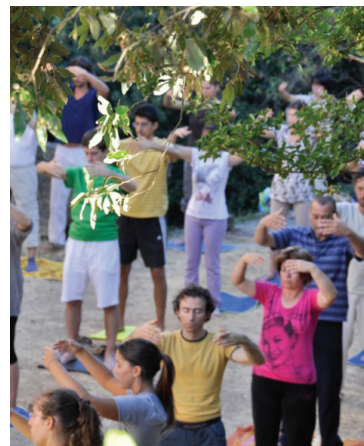
图：意大利法轮功学员集体炼功

法轮大法（又称法轮功、法轮佛法）由李洪志先生传出，是佛家上乘修炼大法，以“真、善、忍”为修炼原则，加上五