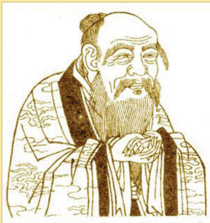
图：成语“道法自然”出自于老子的《道德经》

融合，在融合的过程中，与中国传统文化互相影响、吸收，佛家文化在中国扎根并发扬光大，成为我国传统文化的重要组成部分，对汉语的语言和语汇也产生了深远的影响。很多成语有着浓厚的佛家文化气息，并蕴含着深刻的佛家慈悲普度的思想，如“佛法无边”、“佛光普照”、“大慈大悲”、“普度众生”等；“明心见性”、“一尘不染”、“勇猛精进”等成语描述修炼人同化佛法，修心去业，保持心地纯净及不断向上升华的状态；“神通