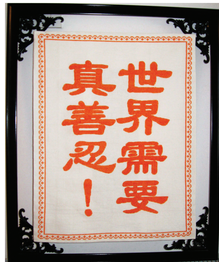
图：十字绣：世界需要真善忍

比起来，现在的做法似乎在物质利益上吃了亏啊。但是师父的教导使我明白，收取这些常人视为理所当然的礼物，表面上似乎自己占了便宜，却要用最珍贵的德去交换，实