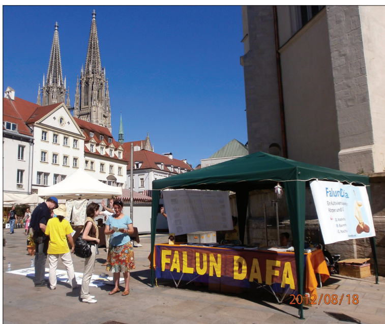
图：法轮功学员在德国雷根斯堡市中心举办信息日活动

有位德国老先生了解在中国发生的活摘法轮功学员器官的恶行、中共进行的群体灭绝的罪行，他马上在反迫害征签表上签了名。他在一九七九年的时候就去过中国，他说那