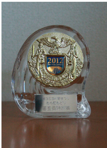
图：法轮大法明慧学校获得了儿童组的特别奖

日本明慧学校参加了兵库县小野市一年一度的大型节日一小野节，获得了儿童组的特别奖。