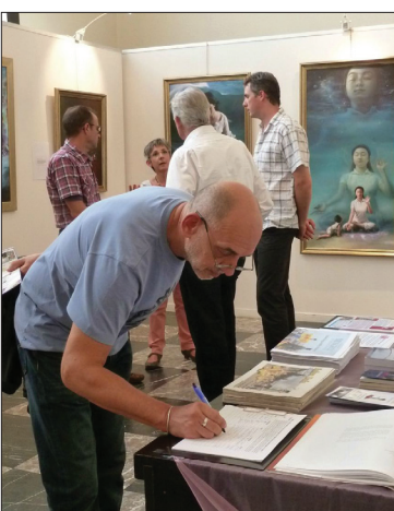
观众在留言簿上留下了感动的心声

宽敞的展厅，错落有致地悬挂、摆放着五十七件作品。每一张画作，都在无声地诉说着一个感人的故事。从远古到当代，从天上到人间，观众纷纷表示，自己从这些艺术中看到、听到了一种心灵的呼唤，在欣赏之余，自己是身心融入作品传达的美好信息之中。