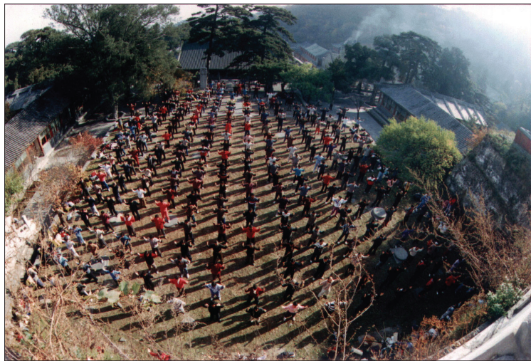
图：一九九八年法轮功学员在北京戒台寺集体炼功

李女士说，也有很多病人称要等李大师亲自给治。其中有一位是家人推着坐轮椅进来的。“师