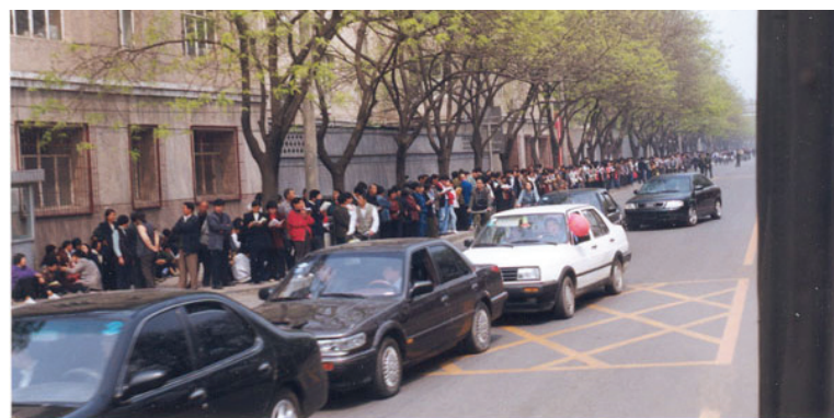
图：中共动用喉舌媒体罔顾事实对法轮功进行污蔑攻击、禁止法轮功书籍正常出版、动用公安非法骚扰甚至殴打法轮功学员等等，都是1999年4月25日万名法轮功学员集体和平上访起因。图为当时法轮功学员集体和平上访(注意街道上汽车、自行车都可以正常行驶，社会秩序正常)。

中共从1996年起，就暗地里开始了对法轮功的打压。先是中宣部1996年发通知禁止出版法轮功书籍，紧接着，中央政法委书记罗干授意公安部，发出通知在全国对法轮功进行秘密调查，为“取缔”作准备。随后在1998年又多次发出通知，秘密网罗罪证欲定法轮功为“邪教”。这些秘密调查虽然并未发现一条法轮功的罪证，各地却发生了公安强行驱散炼功群众、非法抄家罚款等严重干扰法轮功学员正