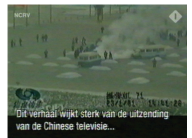
图：荷兰国家电视一台2005年3月14日在「时事评论」专题播放法轮功节目，其中揭露了中央电视台「自焚」伪案，质疑两辆警车为何备有（按中共媒体报导的）二十多个灭火器。