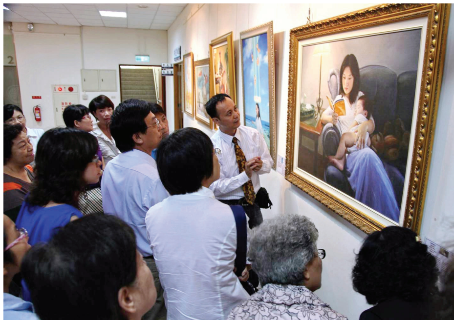
图：正统严谨的绘画，细腻而动人的内涵，震撼每个参观者的心灵。

被中共残酷迫害的法轮功学员坚忍承受及不屈的画作时，为此人间巨难感到难过；其中，他对作品“孤儿泪”及“纯真的呼唤”感触最深。