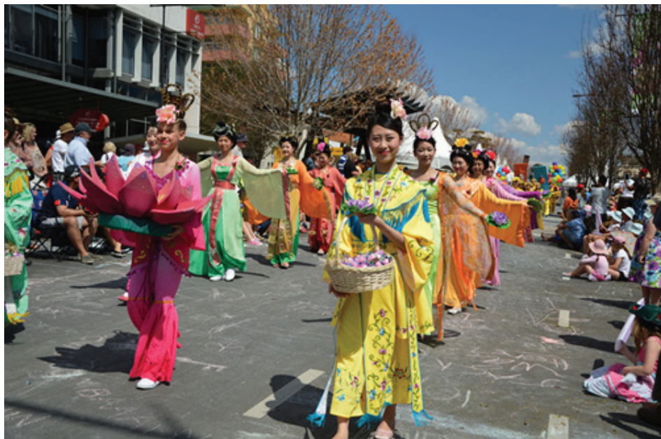
图：仙女队展示中国古代女子的礼仪