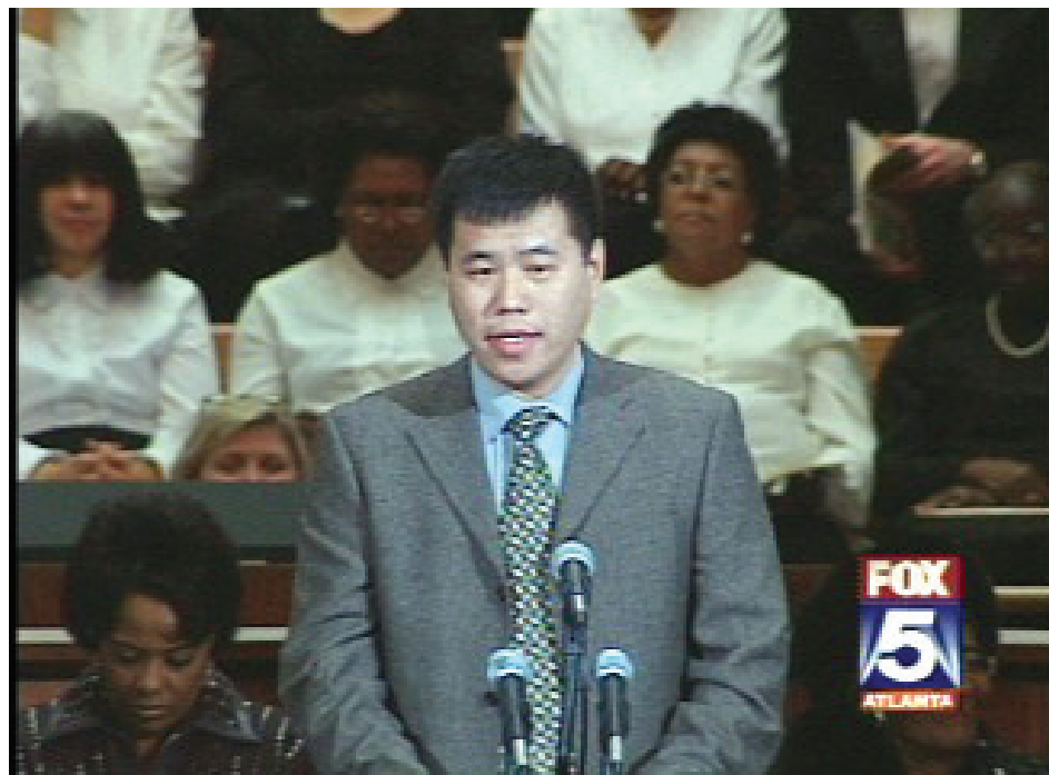
图：法轮大法学会杨森博士致词纪念金博士

人都可以有思想的自由，他们不必因为他们的理想和思维而忍受迫害（包括酷刑、非法拘捕和审讯）。