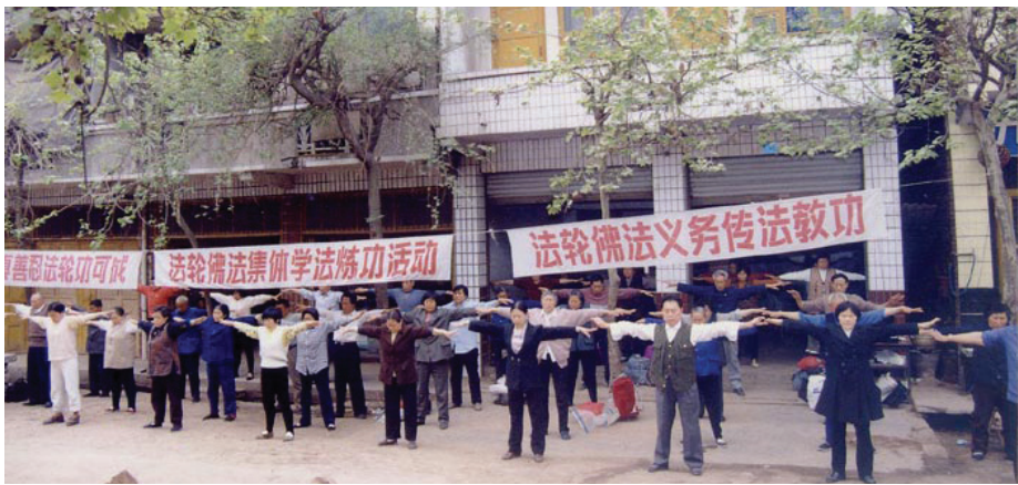
历史图片：99年前四川简阳大法弟子集体洪法炼功