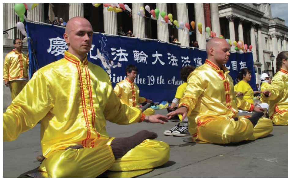
图：英国法轮功学员二零一一年五月十四日在伦敦鸽子广场炼功。

我一开始修炼，就深受鼓舞。炼功使我增加了活力，我所需要的睡眠时间减少了一小时，我想还可以继续减少。我现在享有更健康的身体。早年由于三次肺炎复发留下的严重咳嗽的后遗症在炼功后消失了。我曾有三年患一种讨厌的皮肤病，为此我曾预约做手术；修炼几个星期后，疾患彻底消除。我亲身感受到每通读一遍《转法轮》，对真理的理解就有新的升华和飞跃。