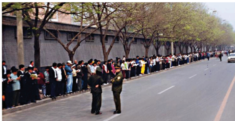
图：一九九九年四月二十五日，逾万名法轮功学员在北京和平上访

1999年4月11日，前政法委书记罗干的连襟何祚庥在天津一杂志上撰文诬蔑法轮功，部分法轮功学员去出版社讲述真相。23日警察打散人群，非法抓走40多人。市政府对法轮功学员讲：你们去北京才能解决问题。于是