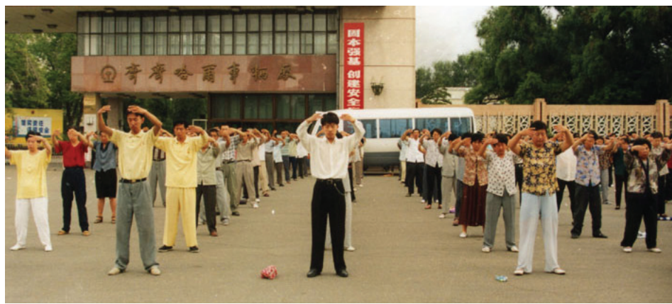
历史图片：一九九九年黑龙江法轮功学员集体炼功

学炼七天，我连拉带吐，师父给我净化身体，三天没吃没喝后，走路象有人推的一样，上楼不用走走，一气就上去了。别人都说：“你以前蒙上一张纸就如死人的脸，现在脸色也好看，太神奇了。”曾因重病医院不收，我这个还能活几个月的人现在突然变成“好人”，大家都感到惊奇，因此每天都有许多人