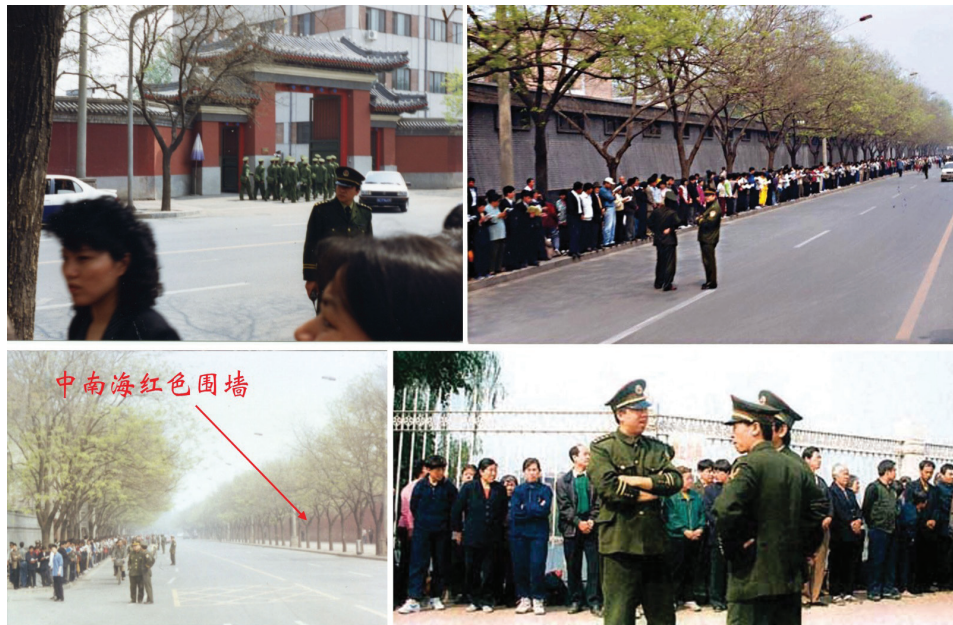
图：一九九九年四月二十五日，逾万名法轮功学员和平上访，学员们静静地在路边看书、等待。从当时的中央电视台新闻画面和现场照片都可以看到，上访群众的身后，并不是中南海特有的红色围墙，而上访群众隔街相望的才是。并且无人聚集在中南海红色围墙的一侧。在央视播出的现场录像中，没有出现示威中常见的情绪激动的人群，没有标语，也没有口号。上访群众没有“围”住中南海，更没有“冲击”。中共所谓“围攻中南海”谎言不攻自破。

“4·25”，法轮功首次引起全世界的关注，法轮功学员所表现出的和平理性和对正信的坚守，得到了国际社会的高度评价，称这次上访是“中国上访史上规模最大、最理性平和的上访”。而江泽民出于妒忌，把和平上访歪曲成“围攻中南海”，与罗干勾结，于1999年7月20日发动了对法轮功的全国性的大迫害。