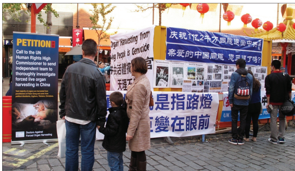
图：民众驻足了解真相