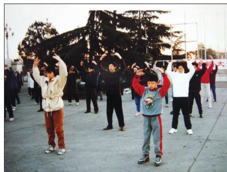
图：一九九九年七月迫害前的北京朝阳区某炼功点

师父把我的身体从里到外净化的干干净净，我好象换了一个人，面黄肌瘦的我，变的白里透