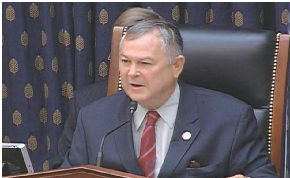
图：美国资深众议员达纳·罗拉巴克：活摘器官是“魔鬼的行径”，我们应该尽最大可能找到从事活摘器官的每一个个罪犯，把他们送上法庭接受审判。

活体器官的产业链是在中共打压政策的纵容和扶持下发生的。从一九九九年到现在中国最大的受迫害群体就是法轮功。被非法关押在各地拘留所、劳教所甚至监狱的法轮功学员，对施害者来说，就成了最方便和安全的器官来源。