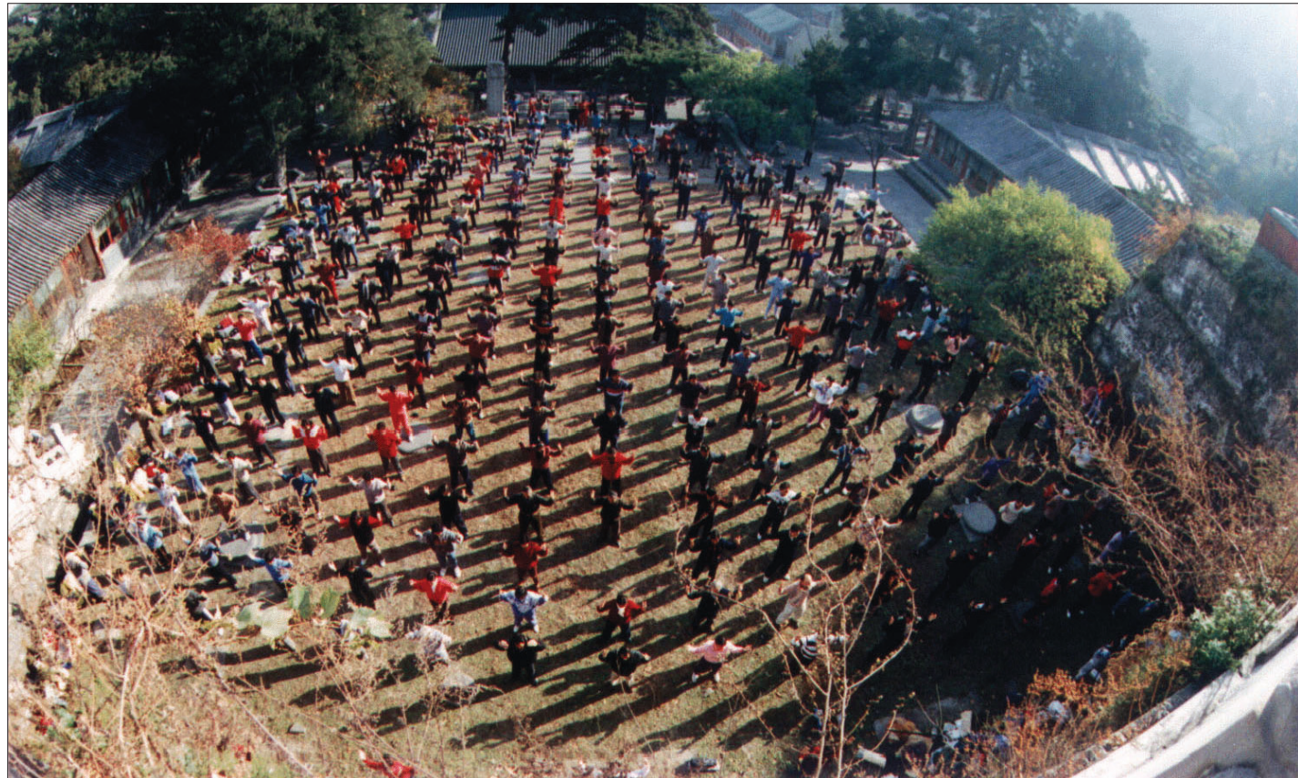
图：1996年北京戒台寺大型集体练功

第一堂课，我睁着眼睛想看清老师面貌，眼睛盯着，耳朵听着，不知什么时候觉的累了，就闭上了眼睛。等我睁眼时，大概快结束了，外甥女告诉我：你睡着了。我说：没有，我都听到了。外甥女说：你还打呼了呢，我给你掐表你睡了四十分钟。我说是吗，心里还是不认帐：我真的听着呢。