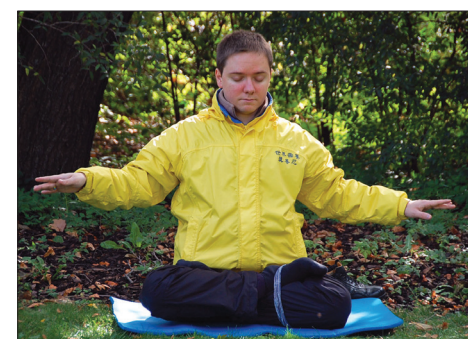
图：瑞尼在炼法轮功第五套功法——神通加持法

维也纳城市公园法轮功炼功点坚持了十几年，给有缘人提供了学法轮功的机会，更给很多从