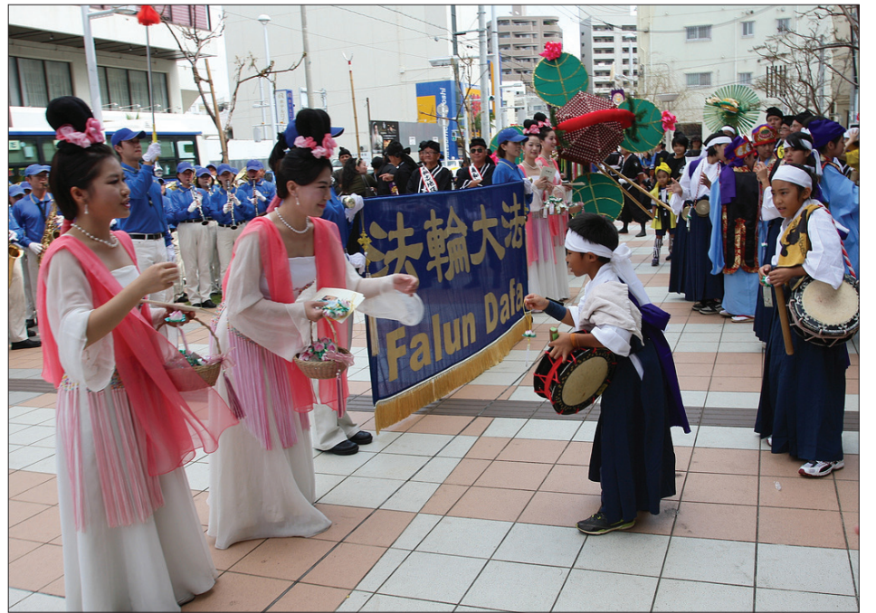
图：天国乐团在旗头阵现场演奏，仙女并发送系有“法轮大法好”卡片的莲花书签。结合，分东西拔河。今年吸引了二十七万观光客。

那霸大绳拔河比赛拥有三百多年的悠久历史传统，源于琉球王朝时期，当时是为了祈求五谷丰收或早时祈雨，典故延至今时今日，象征着商业繁荣。这个祭典所用的粗绳，反映出冲绳的稻米文化，更融合中国和大和文化，分为男绳和女绳，代表阴阳