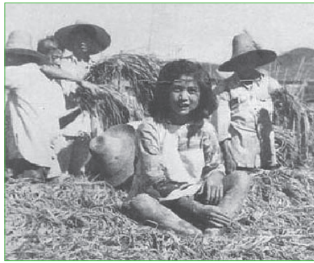
图：“压不倒的稻子”，图为当年的“新闻”图片

读者可能会说，这种“压不倒的稻子”毕竟是另一个时代的谎言了。可是事实上，中共的造假并没有停止过。在一九九九年七月二十日开始迫害法轮功后，中共的谎言又达到一个高峰。在一九九九年的那个夏天，中共动用所有的报纸、电台、电视台，滚动式的散布各种诬陷、谩骂法轮功的谎言，如同“大跃进”和“文革”再现。在二零零一年一月二十三日，中共又在天安门炮制了一起自焚惨案，之后在中央电视台上播出，栽赃陷害法轮功，煽动大陆民众对法轮功的仇