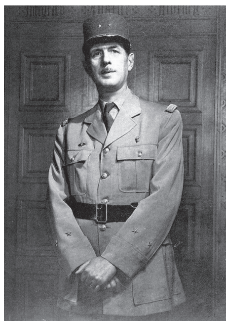
图：戴高乐事后非常感谢那位拒绝执行他的命令的司令。图为戴高乐总统。

现的是一种好品德。连人们教育孩子都常说要做勇敢的好孩子。但勇敢确实又还有一个是与非的前提。不分是非的、没有理性的绝对执行命令的勇敢是一种可怕的勇敢，也是一种愚蠢的勇敢，更是一种专制者欣赏和欢迎的勇敢，充其量不过是没有头脑的匹夫之勇。。而坚持真理、敢于同谬误、同荒唐、同发疯对抗的勇敢、理性的勇敢才是最值得称道的勇敢。