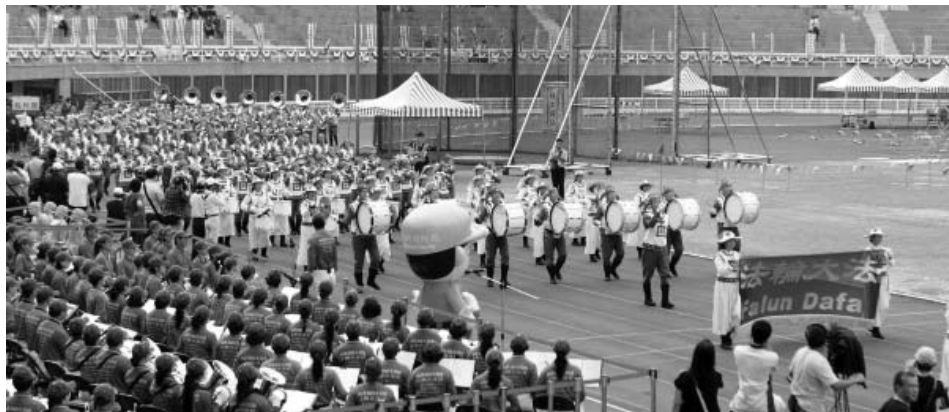
图：身着古装的天国乐团演奏“法轮大法好”，引领选手们与会旗进场。

平泽市市长、地区国会议员、市议会议长等众多政要们参加了本届大会，并对法轮功天国乐团的演奏报以热烈喝彩。为了强身健体参加这次马拉松大会的市民们，非常认真地阅读法轮功学员们派发的真相传单。