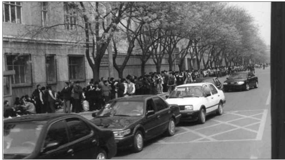
图：中共动用喉舌媒体罔顾事实对法轮功进行污蔑攻击、禁止法轮功书籍正常出版、动用公安非法骚扰甚至殴打法轮功学员等等，都是1999年4月25日万名法轮功学员集体和平上访起因。图为当时法轮功学员集体和平上访（注意街道上汽车、自行车都可以正常行驶，社会秩序正常）。

现已年近七旬的里格女士，谈起童年在东德的生活时，仍能感受到当时埋藏在心底的不安全感。当1999年4月，她在电视上看到，在中国那样一个管制非常严的共产党国家，居然这么多人在政府所在地旁边停留了这么长时间而没有遭到警察的干扰，而