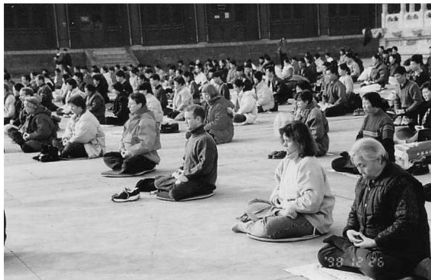
历史图片：北京法轮功学员在集体炼功

炼功后十几年，几十年的病都好了，大法的威力使我坚定不移的信师信法。一九九九年迫害开始，电视上天天在诬陷法轮功，那时我还不知道什么讲真相，我只是想：你说你的，我炼我的，我亲身体会到大法的超常，谁也动摇不了我。