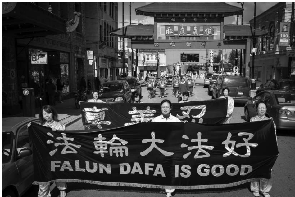
图：法轮功学员在芝加哥中国城游行

一对芝加哥西人夫妇兴致勃勃地观看游行。先生说，他们经常去纽约，在那里常看到法轮功游行，“没想到芝加哥有这么多人炼法轮功。”夫妇二人最