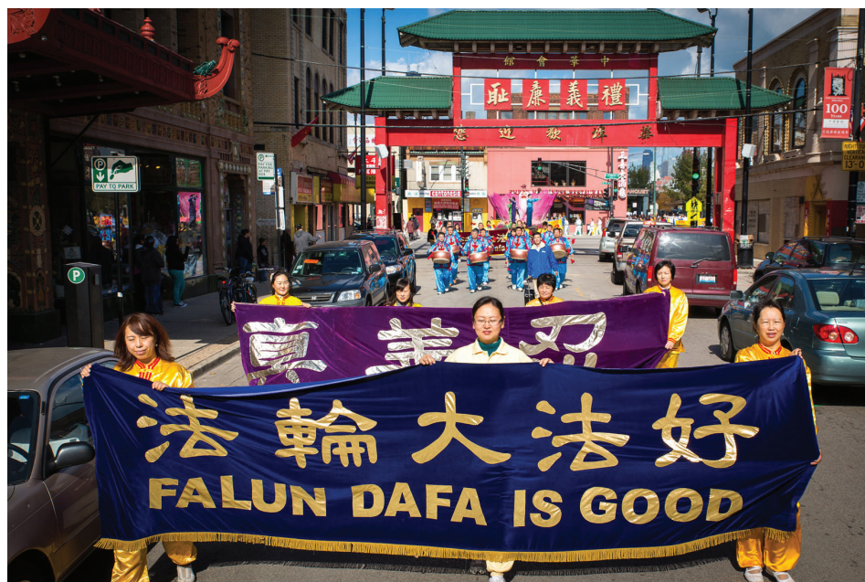
图：法轮功学员在芝加哥中国城游行

一对芝加哥西人夫妇兴致勃勃地观看游行。先生说，他们经常去纽约，在那里常看到法轮功游行，“没想到芝加哥有这么多人炼法轮功。”夫妇二人最