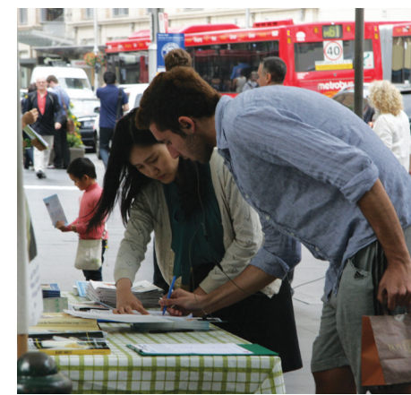
图：悉尼市政府大楼前，人们签名呼吁彻查中共活摘器官的罪行

这位丹麦人被感动了，他一边签名一边说：“我支持你们。活体摘取信仰者的器官，这简直太残酷了，比当年纳粹杀害犹太人还残忍。揭露他们，敦促联合