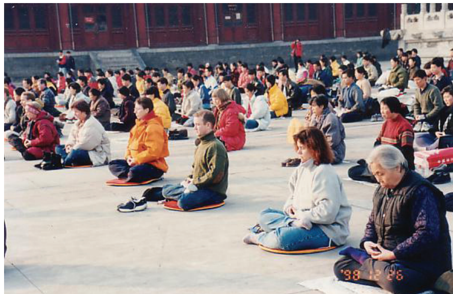
历史图片：北京法轮功学员在集体炼功

炼功后十几年，几十年的病都好了，大法的威力使我坚定不移的信师信法。一九九九年迫害开始，电视上天天在诬陷法轮功，那时我还不知道什么讲真相，我只是想：你说你的，我炼我的，我亲身体会到大法的超常，谁也动摇不了我。