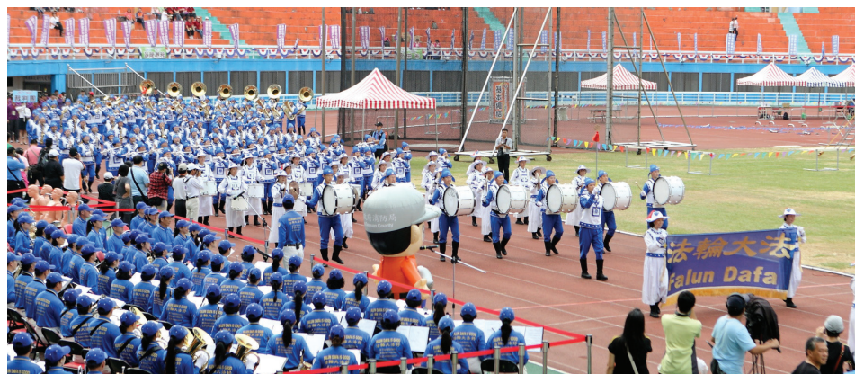
图：身着古装的天国乐团演奏“法轮大法好”，引领选手们与会旗进场。

平泽市市长、地区国会议员、市议会议长等众多政要们参加了本届大会，并对法轮功天国乐团的演奏报以热烈喝彩。为了强身健体参加这次马拉松大会的市民们，非常认真地阅读法轮功学员们派发的真相传单。