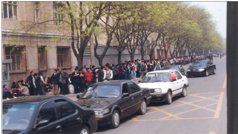
图：中共动用喉舌媒体罔顾事实对法轮功进行污蔑攻击、禁止法轮功书籍正常出版、动用公安非法骚扰甚至殴打法轮功学员等等，都是1999年4月25日万名法轮功学员集体和平上访起因。图为当时法轮功学员集体和平上访（注意街道上汽车、自行车都可以正常行驶，社会秩序正常）。

现已年近七旬的里格女士，谈起童年在东德的生活时，仍能感受到当时埋藏在心底的不安全感。当1999年4月，她在电视上看到，在中国那样一个管制非常严的共产党国家，居然这么多人在政府所在地旁边停留了这么长时间而没有遭到警察的干扰，而