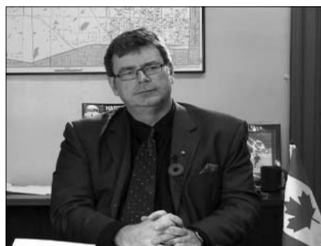
图：加拿大国会法轮功之友主席、国会议员布兰特·瑞诗吉博

议员认为，任何时候，对一个政府来说，活摘器官都是践踏人权活动中最严重的罪行。这个政府将要承担所有对外关系中的