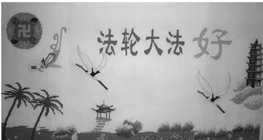
十字绣：法轮大法好