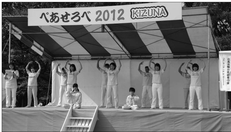
图：日本法轮功学员在“和平与友爱”国际交流节上演示功法