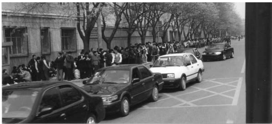
图：中共动用喉舌媒体罔顾事实对法轮功进行污蔑攻击、禁止法轮功书籍正常出版、动用公安非法骚扰甚至殴打法轮功学员等等，都是1999年4月25日万名法轮功学员集体和平上访起因。图为当时法轮功学员集体和平上访（注意街道上汽车、自行车都可以正常行驶，社会秩序正常）。

有人说“四·二五”上访人数太多而触动了中共。可上访是由中国宪法第四十一条和国务院《信访条例》明确规定的公民权利。“四·二五”上访人数达上万，那是因为中共邪党对法轮功的非法侵害涉及到上亿人的正当修炼权利，本应有上亿人去上访才对，“四二五”只去了一万人，怎么能说是多呢？造成如此众多民众合法权利受到侵害，罪魁祸首正是中共。一方面规定公民可以上访，一方面以上访为迫害的借口。这种中共特色，正是中共流氓本性的体现。