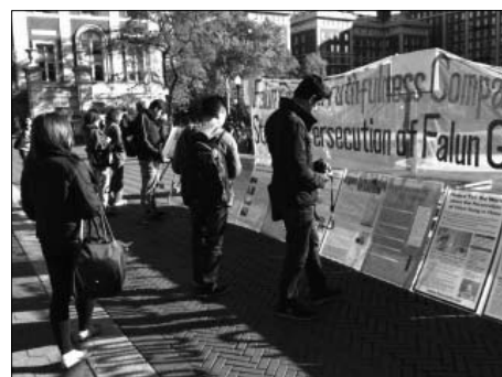
图：哥伦比亚大学学生驻足了解法轮功真相

一位中国学者对活摘器官的真相很感关注，但是希望能够有独立、客观的证据。展览的志愿者向她介绍了加拿大调查团对中共活摘法轮功学员器官的独立调查，并向她展示了《血腥的器官摘取》一书。她在看完以后认为活摘器官的罪行证据确凿，并表示这种罪行超出人性可以容忍的范围。