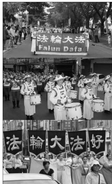
图：法轮功学员参加高雄左营万年季游行踩街

活动主持介绍说：现在邀请法轮功的天国乐团带来精彩的表演，大家请拍手鼓励。这个是世界最大的乐团，感谢法轮功天国乐团来赞助万年季，让这个活动越来越国际化，再次感谢，感谢