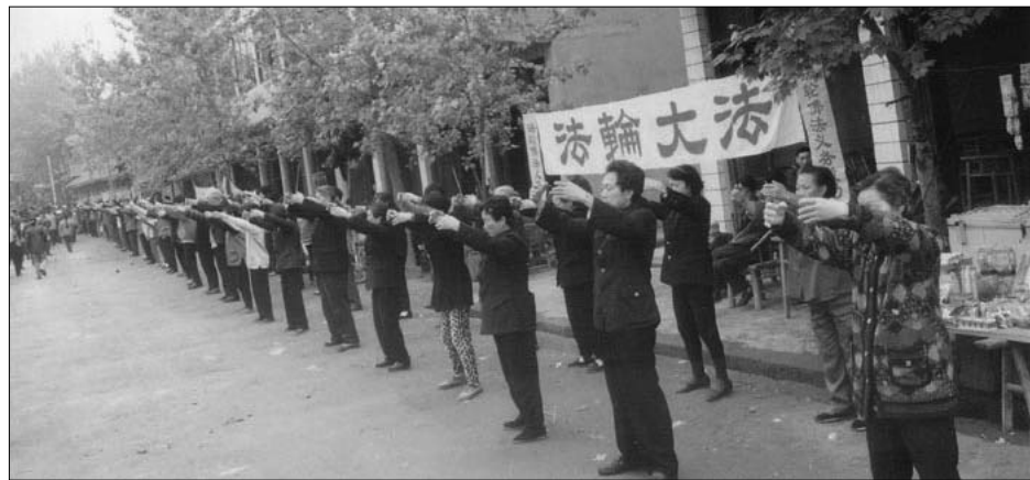
历史照片：迫害前四川简阳大法弟子集体洪法炼功

我接触法轮功是缘于一位当医生的朋友。她和我住在一条街，之前我们一起炼了好几种气功。有一天她找到我，说她找到了一种特别好的功法，叫法轮功。那是一九九七年，她说你还是跟我一起炼吧，这是真正的师父。我说哪知道是不是真的呢。她就不停的劝我，我说怕象以前一样搞砸了。她还是不甘心，叫我到炼功点去，我就去了。我只上过两年小学，再加上四十年多