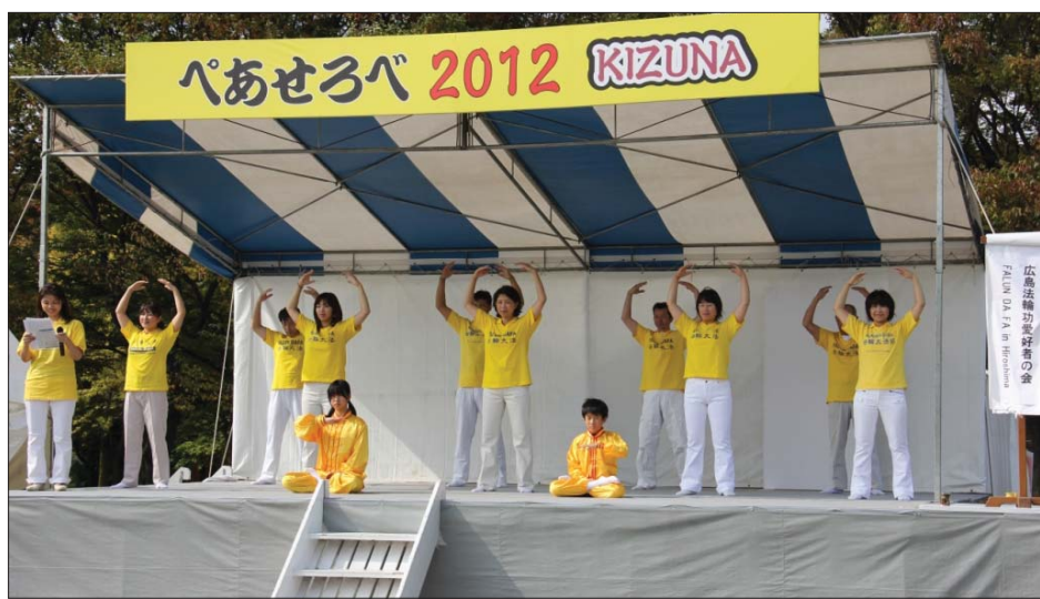
图：日本法轮功学员在“和平与友爱”国际交流节上演示功法