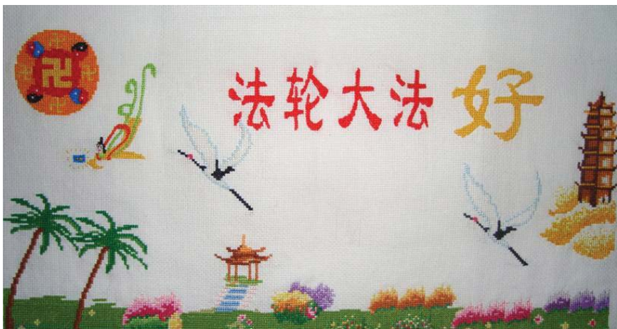
十字绣：法轮大法好