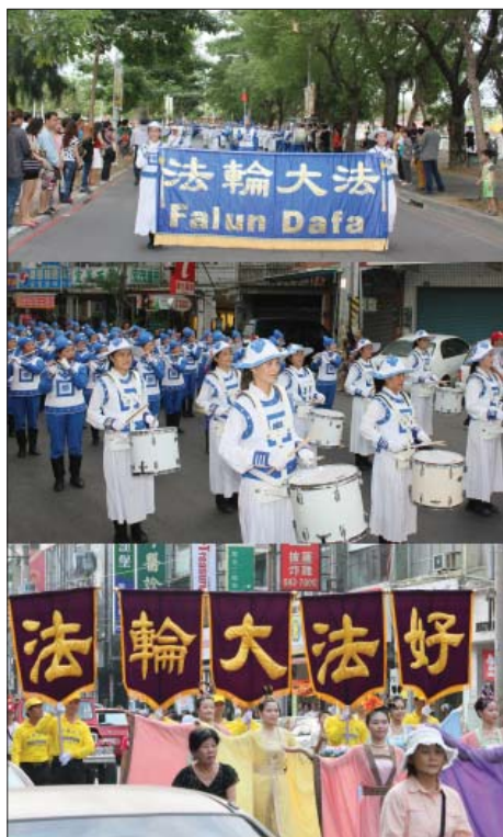
图：法轮功学员参加高雄左营万年季游行踩街

活动主持介绍说：现在邀请法轮功的天国乐团带来精彩的表演，大家请拍手鼓励。这个是世界最大的乐团，感谢法轮功天国乐团来赞助万年季，让这个活动越来越国际化，再次感谢，感谢