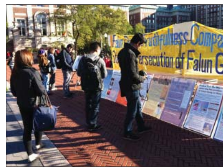
图：哥伦比亚大学学生驻足了解法轮功真相

一位中国学者对活摘器官的真相很感关注，但是希望能够有独立、客观的证据。展览的志愿者向她介绍了加拿大调查团对中共活摘法轮功学员器官的独立调查，并向她展示了《血腥的器官摘取》一书。她在看完以后认为活摘器官的罪行证据确凿，并表示这种罪行超出人性可以容忍的范围。