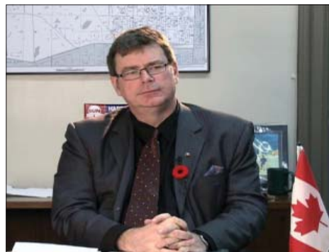
图：加拿大国会法轮功之友主席、国会议员布兰特·瑞诗吉博

议员认为，任何时候，对一个政府来说，活摘器官都是践踏人权活动中最严重的罪行。这个政府将要承担所有对外关系中的