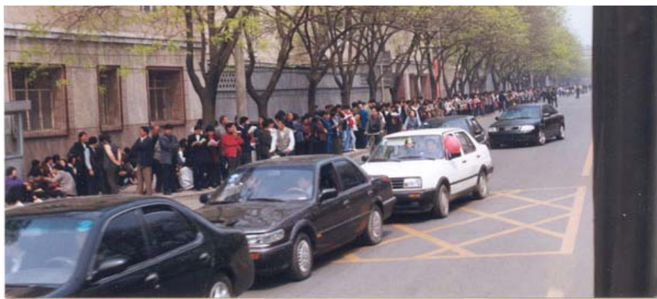
图：中共动用喉舌媒体罔顾事实对法轮功进行污蔑攻击、禁止法轮功书籍正常出版、动用公安非法骚扰甚至殴打法轮功学员等等，都是1999年4月25日万名法轮功学员集体和平上访起因。图为当时法轮功学员集体和平上访（注意街道上汽车、自行车都可以正常行驶，社会秩序正常）。

有人说“四·二五”上访人数太多而触动了中共。可上访是由中国宪法第四十一条和国务院《信访条例》明确规定的公民权利。“四·二五”上访人数达上万，那是因为中共邪党对法轮功的非法侵害涉及到上亿人的正当修炼权利，本应有上亿人去上访才对，“四二五”只去了一万人，怎么能说是多呢？造成如此众多民众合法权利受到侵害，罪魁祸首正是中共。一方面规定公民可以上访，一方面以上访为迫害的借口。这种中共特色，正是中共流氓本性的体现。