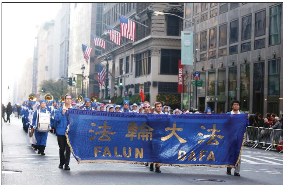
图：二零一二年纽约老兵节游行中法轮功学员的队伍

法轮功学员的队伍由天国乐团、仙女队、功法演示队和腰鼓队四个方阵组成。队伍阵容整齐，服饰亮丽，成为游行中一道独特的风景线。天国乐团奏响一曲辉煌的“法轮圣王”开道，仙女们身着典雅的唐装，手提着镶有金字“真善忍”的七彩大灯