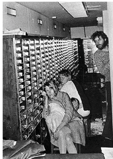
图：1973年的斯德哥尔摩银行劫持事件新闻图片

在正常的国家里，民众以和平的方式表达意见，包括游行示威，是非常平常的事情，也是受到法律保护的。比如美国总统小布什的两次就职典礼，每次都有上百万民众抗议，但布什政府并没有因此给抗议者扣上“围攻”、“闹事”的帽子，更没有对哪个团体进行迫害。只有中共邪党，才会疯狂地迫害和平表达意见的民众。