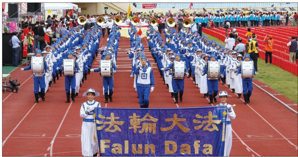
图：台湾志工大会师，天国乐团引领志愿服务团队近二万人进场

法轮大法（又称法轮功）于一九九五年由中国大陆传入台湾，显著的祛病健身效果、遵循真善忍做道德高尚的好人、保存优良的中国传统文化，已吸引几十万台湾人民走入修炼行列，近千个炼功点遍及全台湾三百多个乡镇。法轮功给广大人群带来的身心升华，令社会各界对其日益推崇，法轮功学员组成的天国乐团也经常受到邀请参与各种大型活动，比如为“全国义勇消防人员竞技大赛”、台湾全国运动会等进行演出。