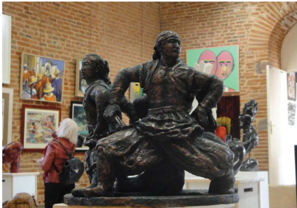
陶土雕塑：威武矫健的蒙古族小伙子。

全是颠倒黑白、蒙蔽真相、制造仇恨。我们从内心深处感到法轮大法太好了，我们也要做师父的弟子。我们如饥似渴地拜读了师父的所有著作，就这样开始在法轮大法中修炼了。