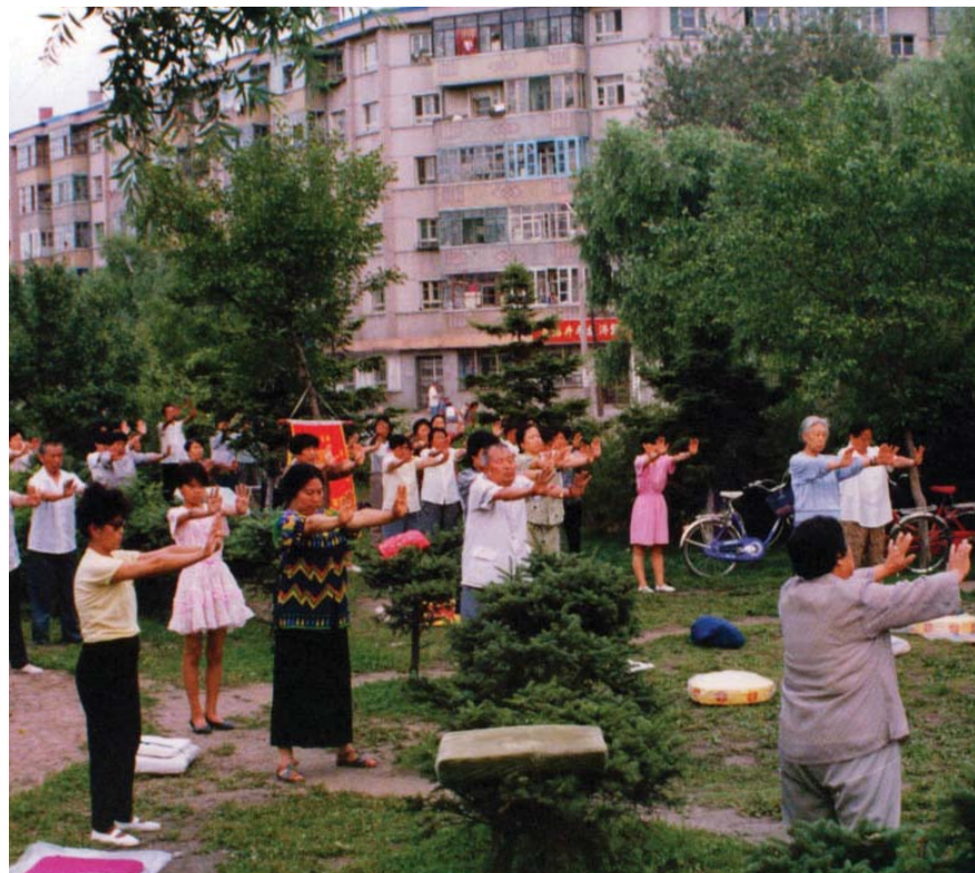
历史图片：九九年迫害发生前大陆法轮功学员集体炼功（第一套功法）

现在，我每天参加小组读大法书，并在老同修的带领下从城市到农村讲大法好的真相，救度众生。我的亲朋好友多，我逢人就讲法轮大法好！真善忍好！