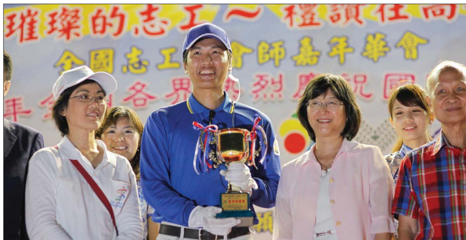
图：大会颁发最高荣誉奖项“精神总锦标奖”给天国乐团