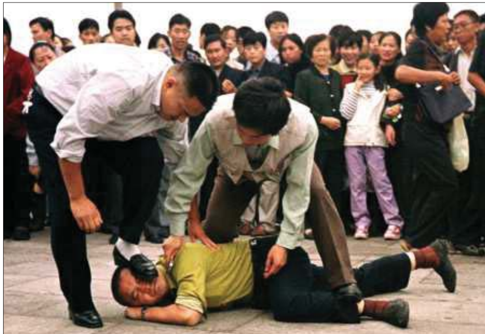
图：美联社照片：天安门广场，在众目睽睽之下，一名便衣警察用皮鞋踩着一名手无寸铁的法轮功学员的脸，另一名警察则一边踩学员的腿一边将一个手铐按到学员的脖子上。

没有伤害过任何人。而那些打人骂人抄家的人，那些迫害别人的人，他们是施害者，他们应该忏悔。