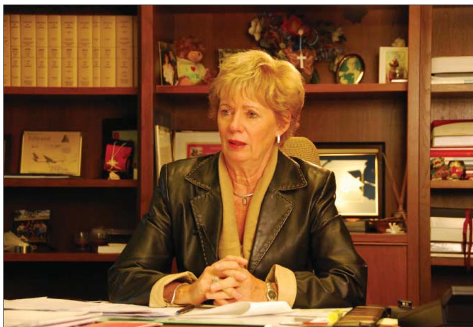
图：加拿大国会议员、国会法轮功之友成员朱迪·斯格诺

斯格诺议员从几年阅读的和跟踪的事实出发，认为有充分的理由相信，活摘器官的事实正在发生。她说：“显然，活摘器官的做法必须被停止。”她认为加拿大政府在这方面的努力远远不够。她说：“需要国际社会的压力，制止这一恶行和对人权的侵犯。特别是器官的问题，我认为要求每个人都坚持呼吁，这种罪