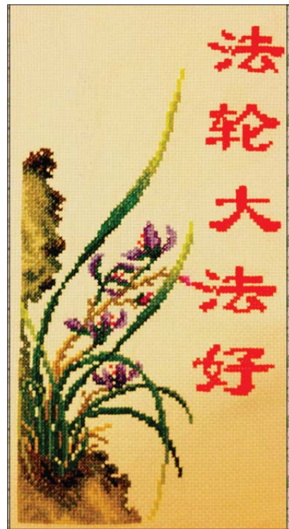
十字绣：法轮大法好

又一年，妈妈的娘家打起了内战，原因是：外公的赡养问题。刚好爸爸在外公家（外地）那边办事，准备把外公顺便接过来。亲戚侧目：“你家那孩子那么特性，肯定嫌弃老人。”爸爸说：我了解我家孩子，我打个电话，你们听听。“儿子（从小爸爸就这么称呼我），爸想把你外公接咱家养老，听听你的想法。”我说：“行啊，那太好了，外