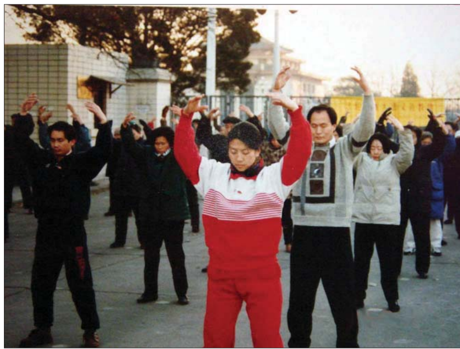
图：一九九九年七月前的大陆某炼功点

第二年的夏忙假，丈夫带我去省城诊治。我的父亲在省城一所卫校上班，托人找了位专家。我记得清清楚楚，六月九日赶到省城天色已晚。晚上大家坐在客厅闲聊。弟弟说：大姐，你试试炼炼法轮功咋样？我说：这功好炼不？他以前跟我提过，我不以为然没当回事。弟弟立即就给我示范打坐，又放了功法录像带。