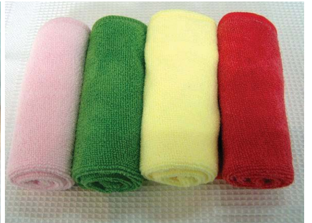
图：超细纤维清洁巾（劳教所主要加工粉蓝黄三种颜色）