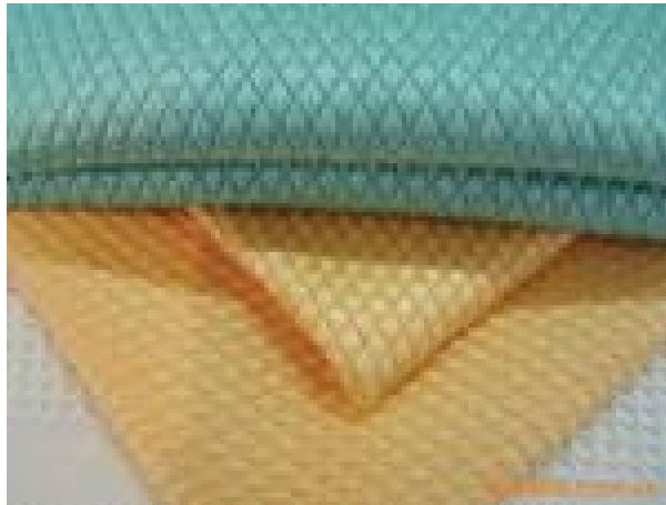
图：超细纤维鱼鳞布