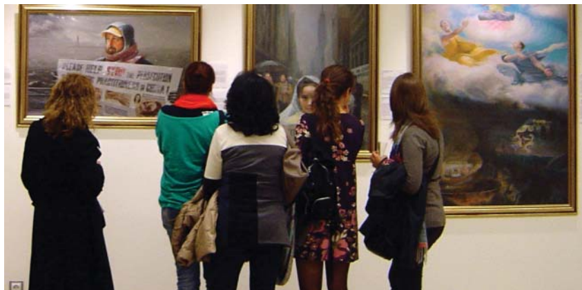
图：巴塞罗那市 Urgell 文化中心展览馆内，观众参观真善忍美展

他表示，“实际上，中国不仅违反了其对国际社会需承担的责任，也违反了对加拿大承担的责任，因为加拿大也同样是国际公约的缔约国。所以，我希望我们自己的外交事务国际人权委员会在加拿大举行同样的听证会，这样我们可以获得证人的证词。大卫·乔高和大卫·麦塔斯本身是加拿大人。他们写了一本书，能够在他们正在进行的活体摘取器官调查的方面提供最新的证据。”