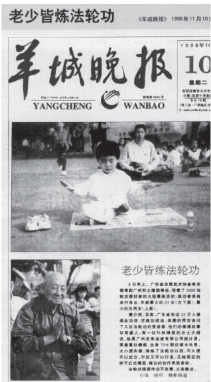
图:《羊城晚报》1998年11月10日报导:老少皆炼法轮功加开幕式的压题照片。

1998年8月28日, 《中国青年报》以《生命的节日》为题介绍98年中国沈阳——亚洲体育节上1500人的法轮功队伍的良好表现和法轮功的健身效果, 并配以两幅法轮功学员参