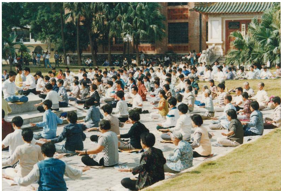
图：1998年广州法轮功学员集体炼功