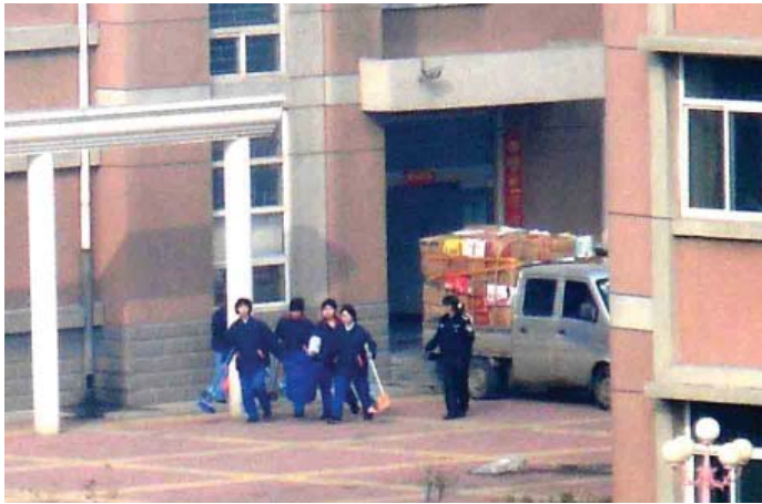
图：河北女子劳教所内部，局部放大：被劳教人员、警察、货车