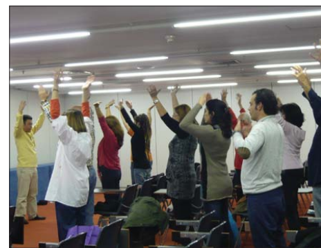
图：在法轮大法介绍会上，与会者学炼五套功法

在健康博览会结束后的第一个周末，炼功点来了很多在健康博览会上认识法轮大法的新学员。一位女士说她在炼功时不停地流泪；还有一位说在家中看《转法轮》时也是不停地流泪，她们不知道是怎么回事？当法轮功学员告诉她们，这可能是师父在为她们净化身体和下上许许多多修炼的机制时，她们非常激动，泪水不由又涌了出来……她们表示一定会认真读《转法