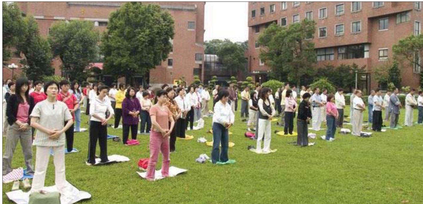
图：台湾法轮功学员集体炼功

我在大学读医学系五年级时，停止排球的团体练习，改为时间安排上较自由的长跑练习。一开始只是和几个同学一起跑校园的山坡，还不到两公里。接着逐渐增加距离，并参加路跑活动。还记得第一次参加的是七点五公里的路跑。跑步一开始对我