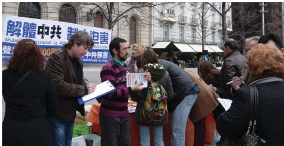
图：签字声援法轮功反迫害

法轮功学员们在广场上拉开写有“解体中共 制止迫害”的大横幅，在签字桌的一侧摆放着