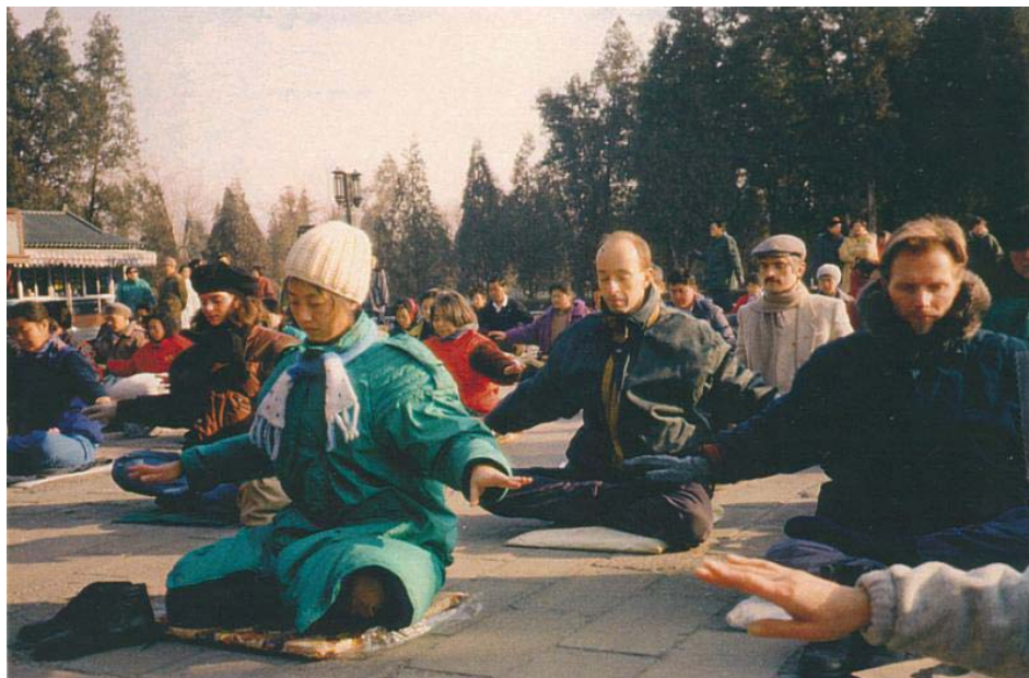
图：欧洲法轮功学员集体炼功

炼了不长时间后我的身体就有了微妙的变化，感觉身体很轻快，没有以往的那种疲劳感觉了，心情也较以前好多了，睡眠也得到一些改善。我就托一个阿姨（我同事的母亲）帮我买了《转法轮》和《法轮功》这两本书。说来也奇怪，每当我拿起《转法轮》读的时候，我就会很想睡觉并且会睡的很好。当时，由于我对大法理解不深，不知道