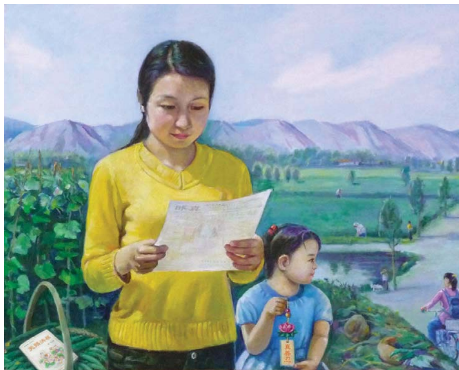
油画：得救的希望。在一块田间，母亲和小女孩，刚刚拿到大法弟子送来的真相资料。

们，建议所有不愿被谎言欺骗的人，放弃偏见，放下架子，静下心来看看法轮功学员发放的真相资料，你一定会受益良多。