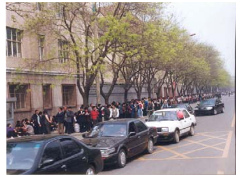
图：中共动用喉舌媒体罔顾事实对法轮功进行污蔑攻击、禁止法轮功书籍正常出版、动用公安非法骚扰甚至殴打法轮功学员等等，都是1999年4月25日万名法轮功学员集体和平上访起因。图为当时法轮功学员集体和平上访（注意街道上汽车、自行车都可以正常行驶，社会秩序正常）。

1999年4月25日法轮功学员集体到位于府右街的国家信访办上访，而信访办就在中南海附近。上访过程中，法轮功学员极其的平和安静，没有标语、口号，对当地的行人和交通没有造成任何影响。可后来中共为了给