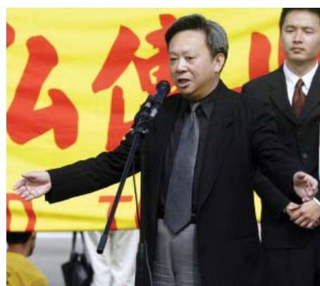
图：辛灏年先生在“审判江泽民”集会上发言

我想今天在美国，全世界，有这么多的法轮功朋友所兴起的审判江泽民的社会活动，他虽然