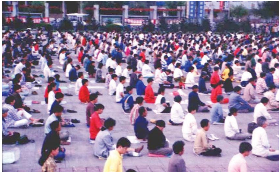
历史照片：九九年前大陆大法弟子集体炼功