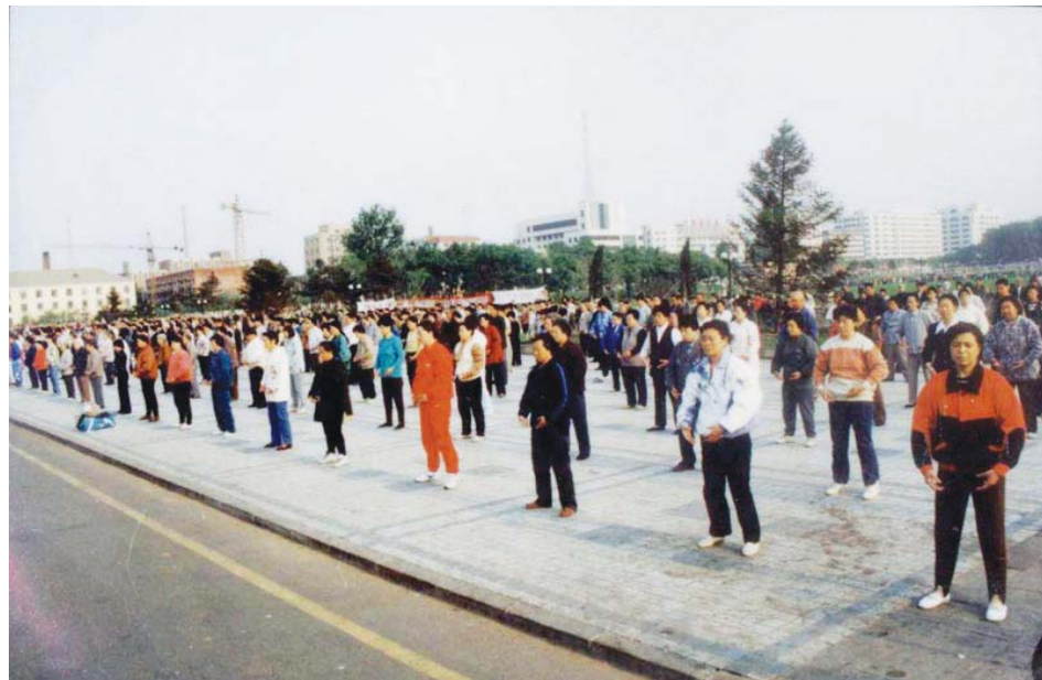
图：1998年5月大陆法轮功学员集体炼功场景

觉得生活有了意义，不再空虚，立即改掉了打麻将的恶习，在言行上也逐渐地用法理要求自己。