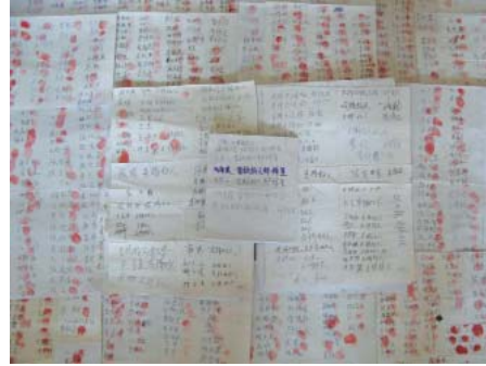
图：唐山及周边地区四千零一十一位民众的部份签名

两次开颅手术，命在旦夕。中共肆意迫害善良民众的恶行，引发了更多百姓的强烈不满，唐山及周边地区民众自发联名声援营救，截止十二月十五日，又有四千零一十一人签名摁红手印要求释放郑祥星，其中包括政府官员、学生、农村村民等，有的民众边签名边流泪，对中共残酷迫