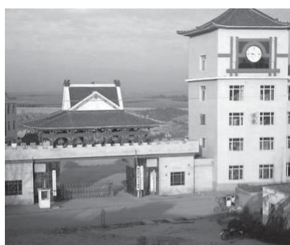
图：黑龙江省女子监狱

此刻，漂亮的妈妈少了一颗门牙，那是在劳教所被打掉的。因为坚持对真善忍的信仰，妈妈承受了很多酷刑折磨——被逼迫坐小凳，看中共侮蔑法轮功的书籍和录像，被强迫蹲在只有三十厘米的方砖内、手背后不许动，被吊铐，