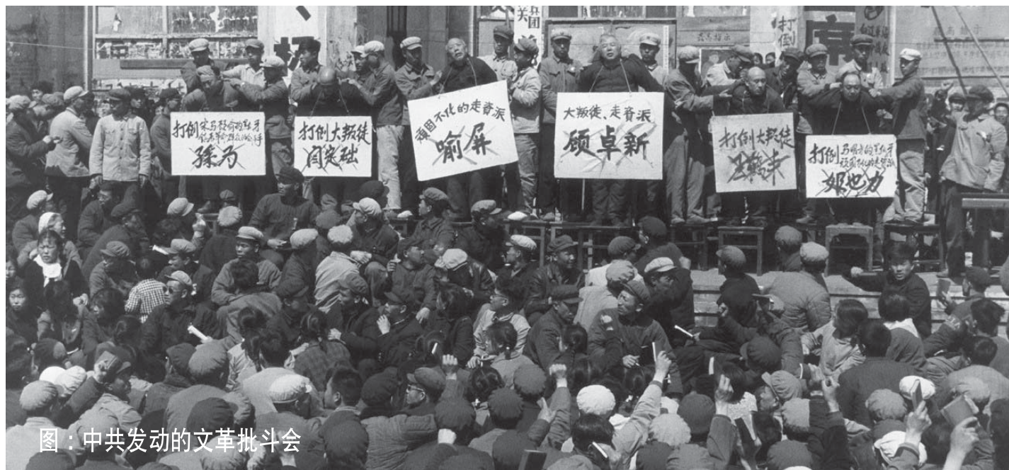
图：中共发动的文革批斗会

大学没上两年，文革开始了，停课闹革命，斗走资派，批反动学术权威，串联基层单位支左，乱哄哄你方唱罢我登场。那时的我因为有了初中批右派的心灵创伤，经常告诫自己万事都悠着点。对官方喉舌我习惯抱着侧面或反面看的姿态，譬如当官媒叫嚷紧密团结时，我明白那是四分五裂的局面；高唱我们的朋友遍天下时，无非是在世界上广遭孤立，形单影只，最多是有数的