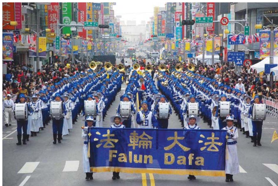
图：天国乐团行进在嘉义市最热闹的中山路圆环，民众夹道欢呼

乐团团员介绍说，法轮大法又称法轮功，于一九九五年从中国大陆传入台湾，教导修炼者遵循“真善忍”做道德高尚的好人，功法有显著的祛病健身效果。目前台湾有几十万民众修炼