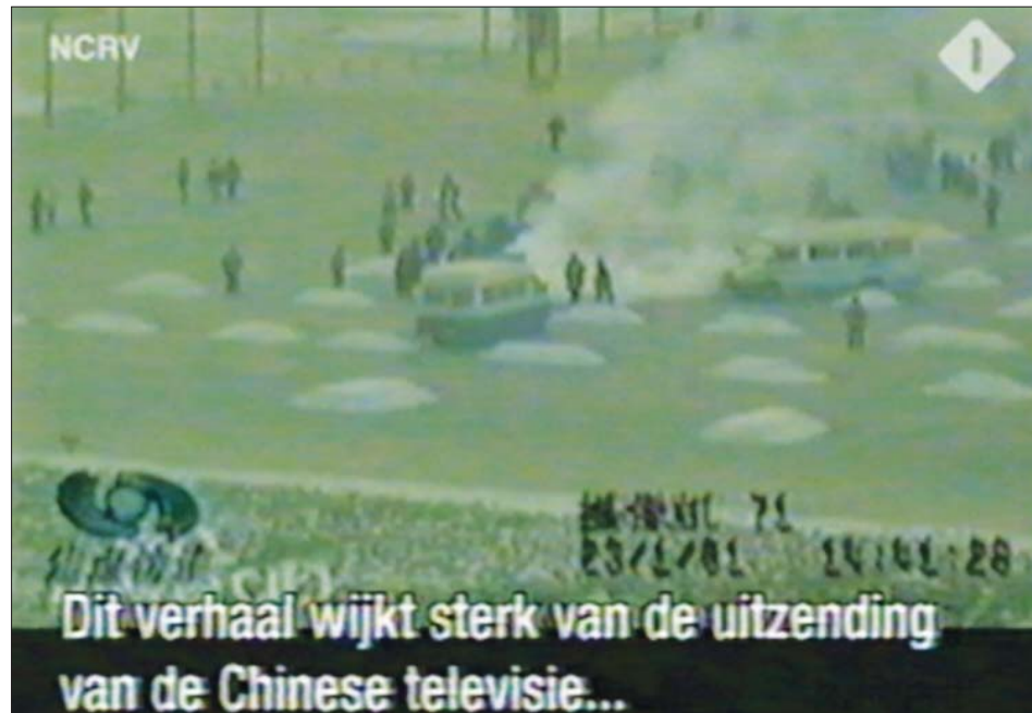
图：荷兰国家电视一台 2005 年 3 月 14 日在「时事评论」专题播放法轮功节目，其中揭露了中央电视台「自焚」伪案，质疑两辆警车为何备有（按中共媒体报导的）二十多个灭火器。