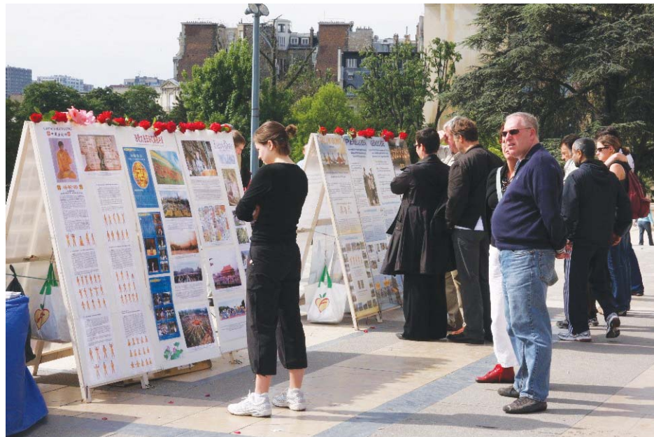
图：法国民众观看法轮功学员设立的真相展板

他讲道，有一次在我朋友家做客，女主人正在填表准备把自己的旧车卖给一个中国人，我无意中听到那个中国人的朋友说道，最好不要填写价钱，自己回去填少点可以少交税。我认为这样做很不诚实，对社会的健康也不利，于是我就说，最好不要这样做，我知道这种事在中国很普遍，但我认为这是应该改变的。那位中国人严肃地告诉我，请不