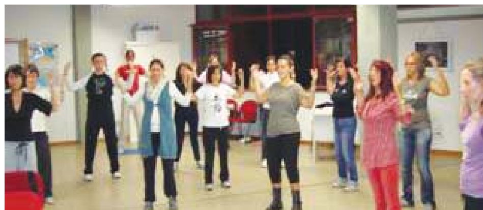
图：真察诺小镇民众学习法轮功第二套功法

一位女士说，她非常爱吸烟，每天都会不停地抽大量的香烟。在免费教功班结束后，她感到十分震惊，因为在这两个小