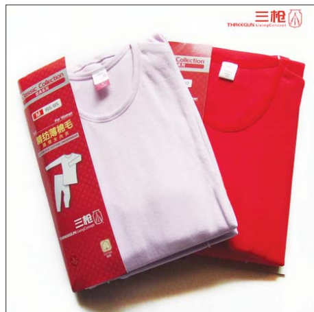
图：三枪牌棉毛衫裤

以上海女子劳教所为例，主要生产的产品是三枪牌棉毛衫裤(见图2)、长毛绒玩具、搓二极管(见图3)、串玻璃珠子、拧小灯泡等等。到处可以看到堆积的衣料和装各类奴工产品的箱子。棉毛衫裤的缝制使用缝纫机，为了出货赶工经常是连续几天几夜在工场间劳动，有时实在无法坚持才能在工作台上小睡一